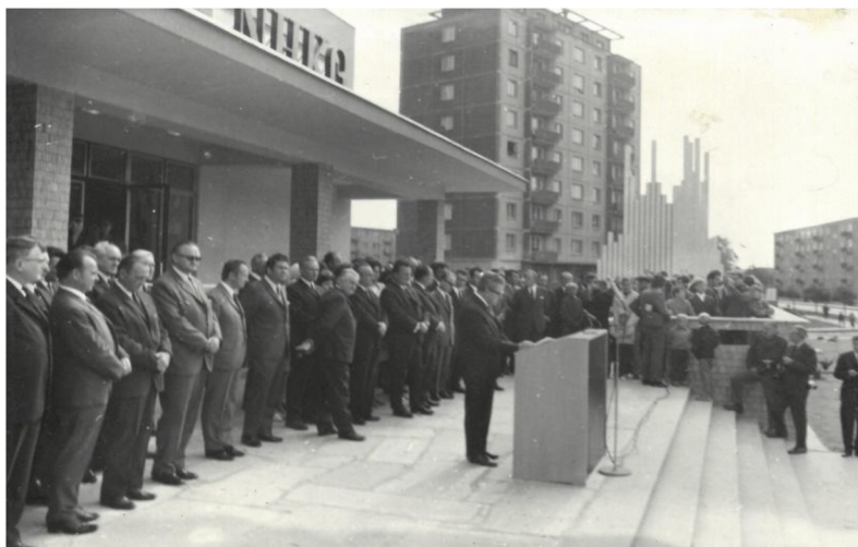
Obr. 4 – Shromáždění při slavnostním otevření Kulturního domu Zábřeh.