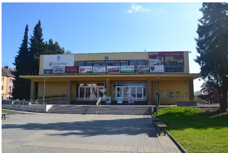
Obr. 7 – Současná podoba Kulturálního domu Zábřeh.