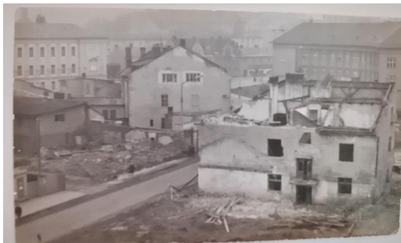
Obr. 1 – Průběh asanace v místě budoucího Kulturního domu Zábřeh.