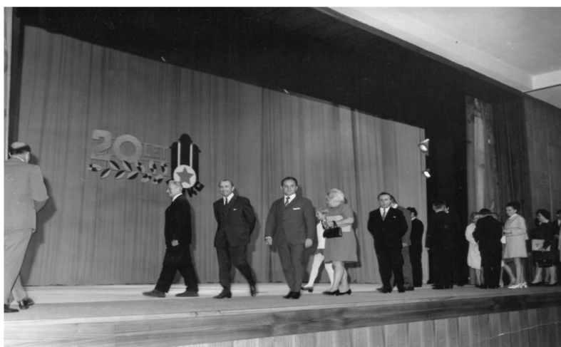
Obr. 6 – Znakový odkaz na oponě k 20. letému výročí založení N. P. NHKG. Fotografie dostupná v Archivu Kulturního domu Zábřeh.