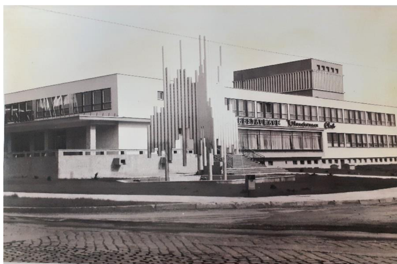
Obr. 3. – Finální podoba Kulturního domu Zábřeh (v 70. letech SZK ROH NHKG).