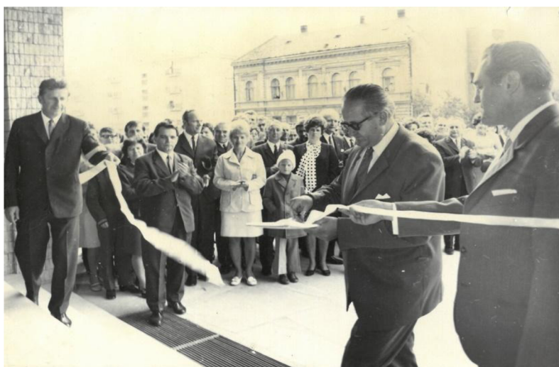
Obr. 5 – Slavnostní přestřížení pásky před vchodem do nového Kulturního domu v Zábřeze.