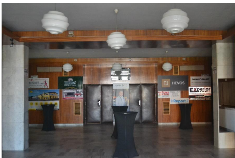
Obr. 9 – Foyer v Kulturálním domě Zábřeh.