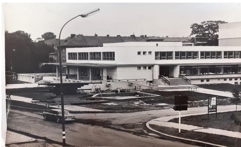
Obr. 2. – Dostavba Kulturního domu Zábřeh.