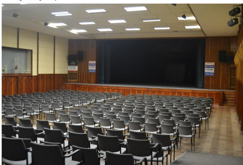
Obr. 9 – Sál Kulturálního domu Zábřeh.