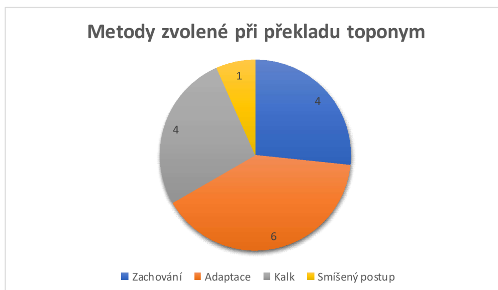
Obrázek 2: Četnost výskytu překladačských postupů u toponym

Dominantní metodou u překlادů toponym z úryvku je adaptace. Výskyt jednotlivých postupů je ilustrován následujícím grafem.