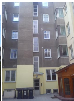
Fotografie č. 33. Dům, kde bydlí Marie