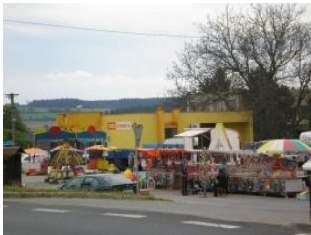
Fotografie č. 11. Pout' v Kámeně

Další podobnou slávu zažívají místní lidé 5. prosince, kdy po vesnici chodí čerti a Mikuláš. Mariina sestra chodí převlečená za Mikuláše každý rok (viz fotografie č. 12). Společně s přáteli obejdou každou rodinu v Kámeně, kde už na ně čekají rodiče dětí a těší se, až čerti postraší jejich děti. Nejde však jen o vystrašení místních dětí. Místní tento den berou jako možnost pobavení, a proto v tento den hraje významnou roli alkohol. Čerti společně s Mikulášem dostávají jako odměnu od rodin panáka, obvykle slivovici pálenou z ovoce, které místní pěstují na vlastních zahradách. Výjimečně dostávají nižší finanční odměnu.