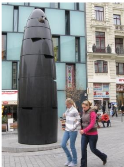
Fotografie č. 49. Fotografická tvorba Aleny

V neposlední řadě řadíme mezi volnočasové aktivity i cestování. Marie tráví své dovolené především v Kámeně, příliš nikam necestuje. Ve svém volnu chodí především na procházky nebo odpočívá na zahradě. Pokud cestuje, vyráží většinou na poznávací výlety po České republice. Na výlety nejezdí se svou rodinou, ale se svými přáteli.