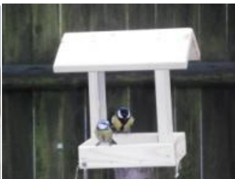
Fotografie č. 47 a č. 48. Fotografická tvorba Marie