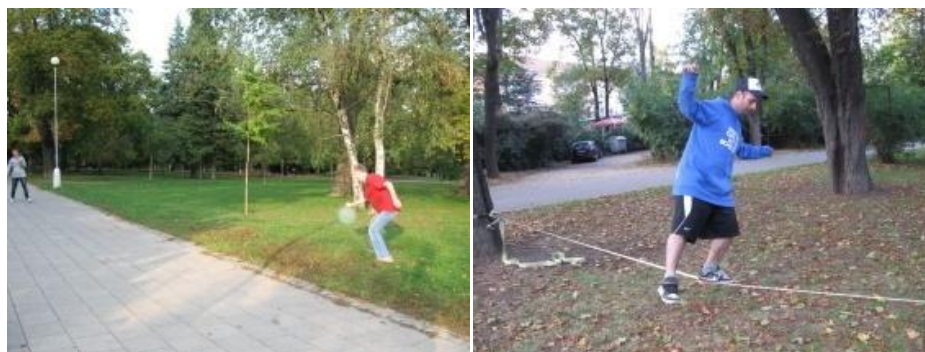
Fotografie č. 18. a č. 19. Frisbee a provazochodectví v Brně

V Brně je tomu podobně, stejně jako lidé v Kámeně využívají místní letiště a krajinu pro sport, využívají lidé v Brně místní parky pro běh, jízdu na kole i pro hraní frisbee (viz fotografie č. 18). Lidé tady také venčí psy. Alenu pozornost upoutává nový fenomén provazochodectví, který se v brněnských parcích poměrně rozmohl (viz fotografie č. 19). Alena osobně využívá park nejčastěji k běhu a pro jízdu na kole upřednostňuje místní cyklostezky.