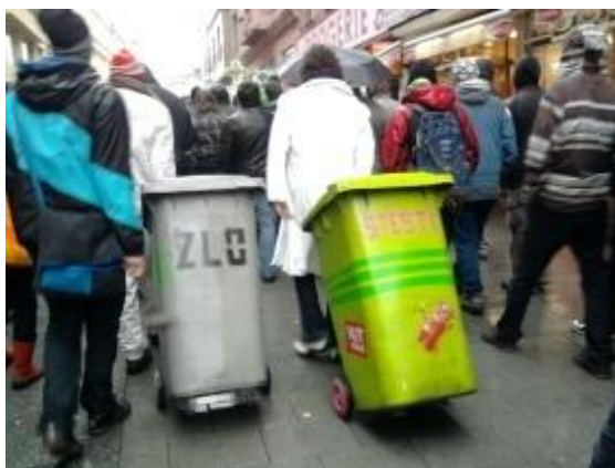
Fotografie č. 32. Demonstrace Brno

bezprostředně dotýkají. Tato demonstrace bojovala proti zpoplatnění vysokých škol a zúčastnilo se jí velké množství mladých lidí. Ačkoli otázka toho, zda by demonstrace měly být řazeny do volnočasových aktivit, je sporná, v této práci je do těchto aktivit počítat budeme. Demonstrace splňují jisté rysy volnočasových aktivit. Lidé nejsou nuceni se těchto aktivit účastnit, provozují tuto činnost dobrovolně ve volném čase a snaží se tak podílet na veřejném životě.