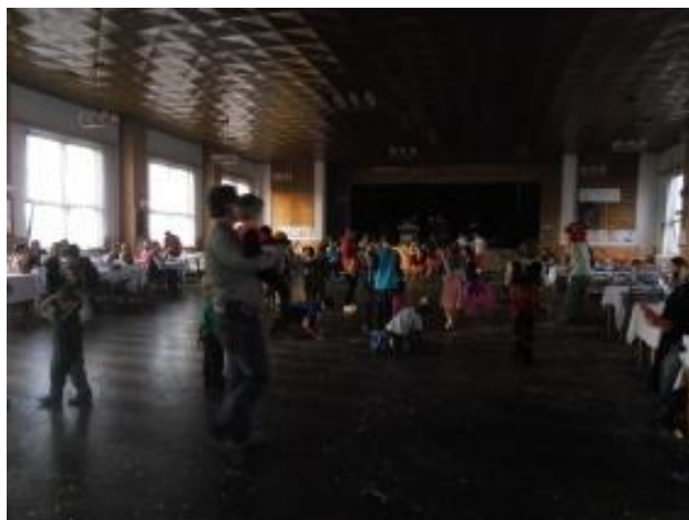
Fotografie č. 2. Dětský karneval Kámen

Pro děti je zde dále pořádán lampionový průvod v den slavení čarodějnic, který probíhá na místním letišti. Průvodu a slavnosti se neúčastní pouze děti, ale i dospělí. Na tomto průvodu je účast o poznání větší než na dětském karnevalu, protože tato akce nevyžaduje žádnou větší organizaci. Oslava čarodějnic je vždy zakončená opékáním vuřtů, jak můžeme vidět na fotografii č. 3. Marie a její rodina se účastní průvodu každoročně. „Jak je patrné venkov dodnes umí slavit a sám se bavit.“ (Blažek, 2004, s. 154) Kámen tedy nepotřebuje vždy navštěvovat okolní města, aby si mohl užít zábavu.