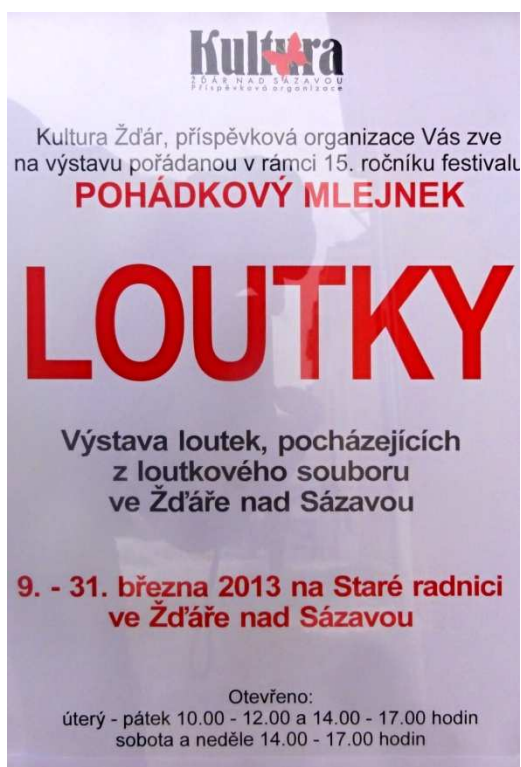
Plakát na výstavu loutek