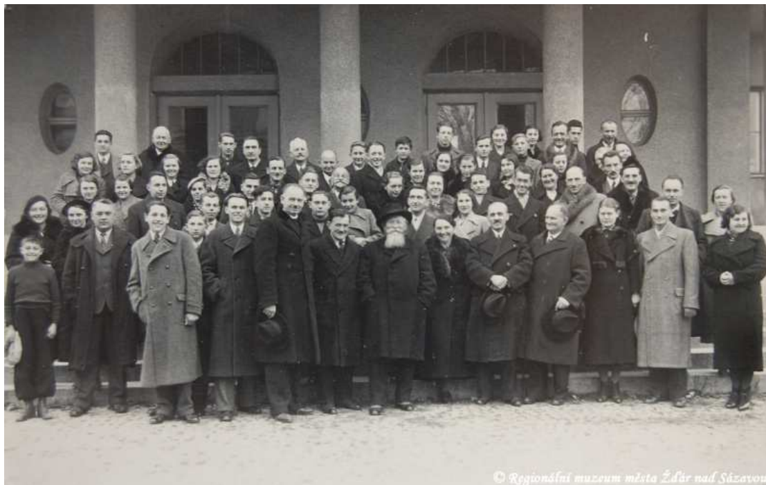
Účastníci loutkářské školy Sokolské Župy Havlíčkovy v Městě Žďáře v roce 1936