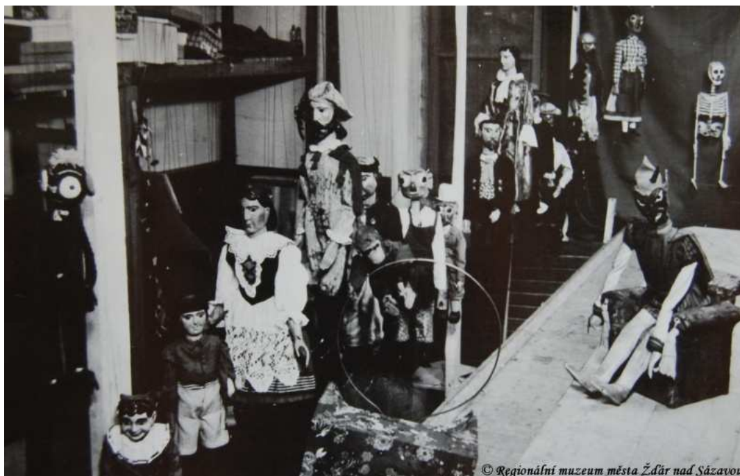
Fotografie zachycující uložení loutek v Sokolovně