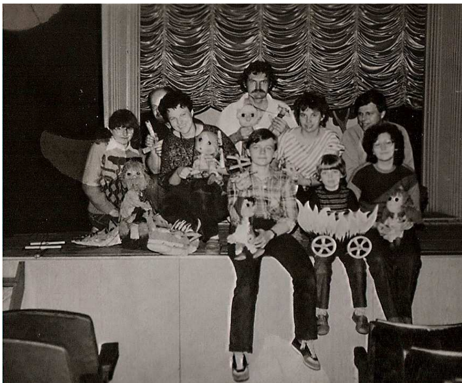
Fotografie zachycující loutkáře po zkoušce pohádky Dračí komedie