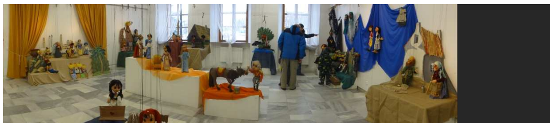
Panoramatický pohled na výstavu