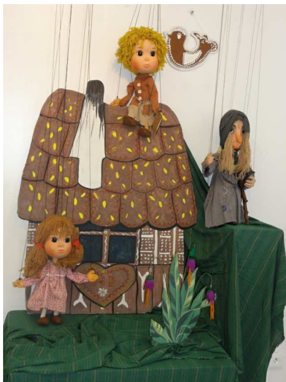
Soubor marionet pro pohádku Perníková chaloupka