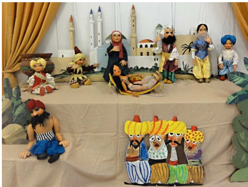
Soubor marionet pro pohádku Šuki a Muki čili Čarovné bačkory