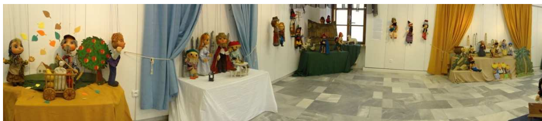
Panoramatický pohled na výstavu