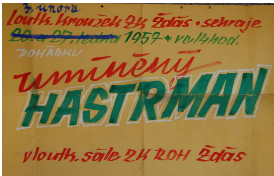
Plakát z 50. let