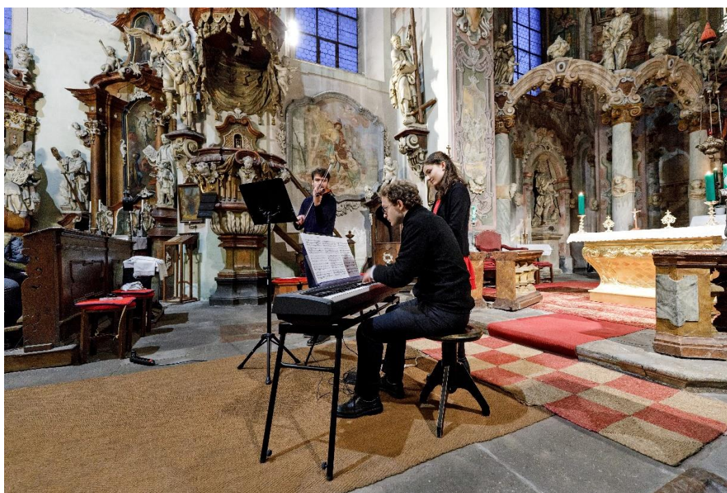
Obrázek 17 - Fotografie z průběhu koncertu