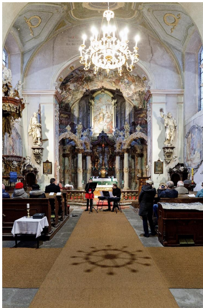
Obrázek 16 - Fotografie z průběhu koncertu