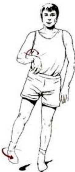
Obrázek 1 Wernickeovo-Mannovo držení (Kolář, 2012, s. 387)

Ve stádiu relativní úpravy dochází ke zlepšování stavu. Je dosaženo hybnosti distálních segmentů končetin (Šeclová, 2004, s. 15).