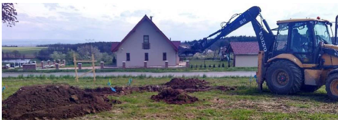
Obrázek 6 – Skrývka zeminy (ilustrativní obrázek) 53