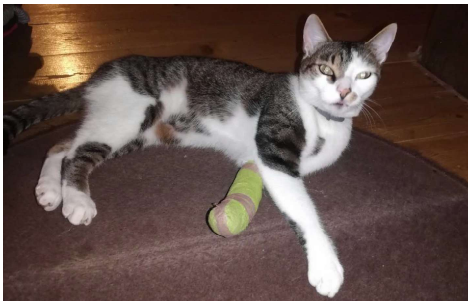
Obrázek 3 – Postřelený kocour (ilustrativní fotografie) 47

Dne 3. 2. 2021 v 15:00 hod. zjistil pan Kamil H., že jeho kocour kulhá na pravou zadní nohu. Majitel kocoura ihned odvezl ke zvěrolékaři, který jej ošetřil a z vnější části pravého stehna vyjmul olověnou diabolku. U kocoura došlo k drobné rance na kůži, přičemž k poškození stehenní kosti nedošlo. Kamil H. se následně dostavil na Policii ČR, kde o incidentu učinil oznámení. 46