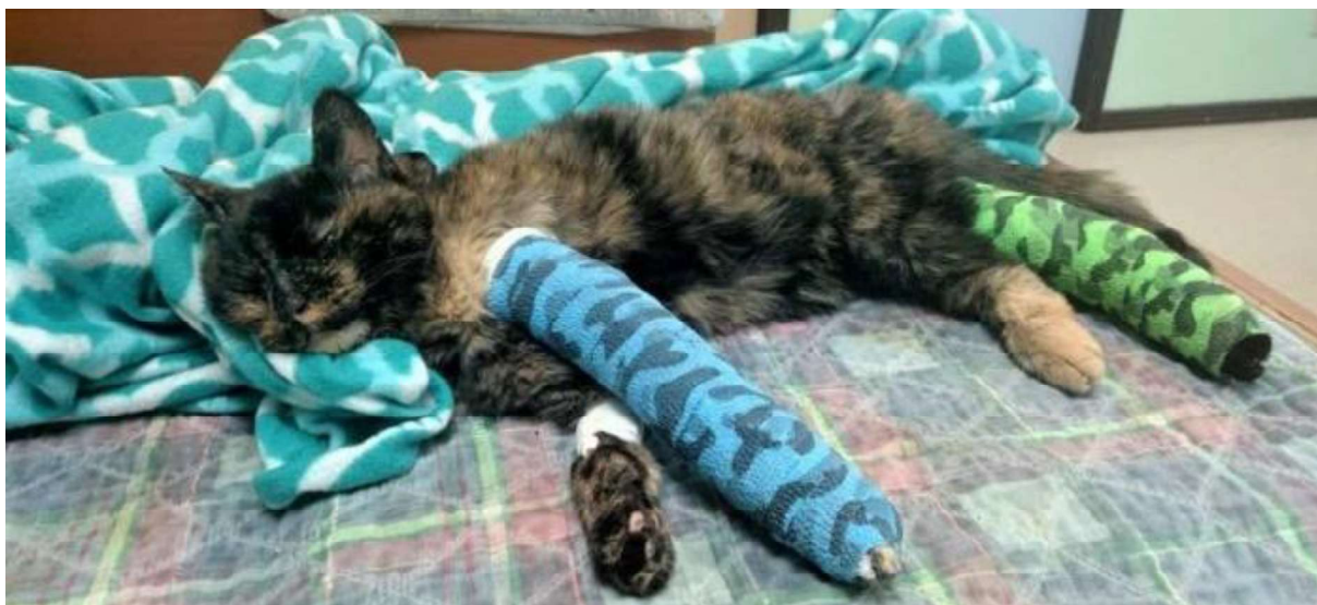
Obrázek 8 – Týrání kočky (ilustrativní obrázek) 57

Na základě těchto zjištění byly zahájeny úkony trestního řízení pro podezření ze spáchání přečinu týrání zvířat dle § 302 odst. 1, odst. 2 písm. a), odst. 3 písm. c) trestního zákoníku, tím že uvedeným jednáním bezdůvodně vystavil zvíře působení negativních stresových vlivů biologické povahy v podobě duševních útrap a stresu a fyzikální povahy v podobě vyvolání nepřiměřené bolesti, utrpení a neúměrného fyzického vyčerpání. Tímto jednáním pachatel porušil § 2 odst. 1 zákona č. 246/1992 Sb., na ochranu zvířat proti týrání a § 4 odst. 1 písm. k), n) zákona č. 246/1992 Sb., na ochranu zvířat proti týrání, tedy týral zvíře zvláště surovým a trýznivým způsobem na místě veřejnosti přístupném.