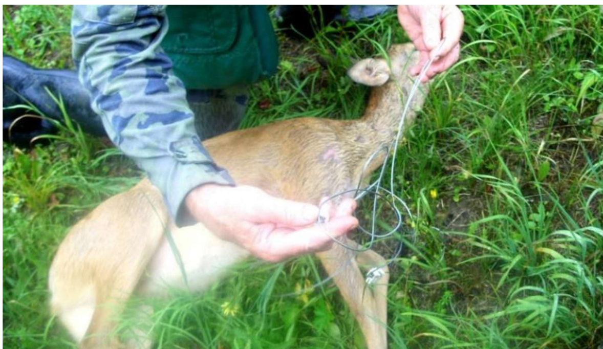
Obrázek 10 – Muž hlídal vinici pomocí drátěných pytláckých pastí (ilustrativní obrázek) 61

Dne 4. 11. 2020 bylo na obvodním oddělení Policie ČR Nový Bydžov přijato oznámení od myslivce Karla P., který při honitbě poblíž obce Hrádek našel v lese celkem 7 drátěných ok, jež se používají k pytláčení zvěře. Ve dvou okách byly chyceny srny, které vysvobodil a vypustil do volné přírody. 60