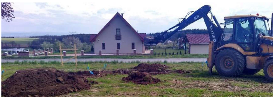
Obrázek 6 – Skrývka zeminy (ilustrativní obrázek) 53