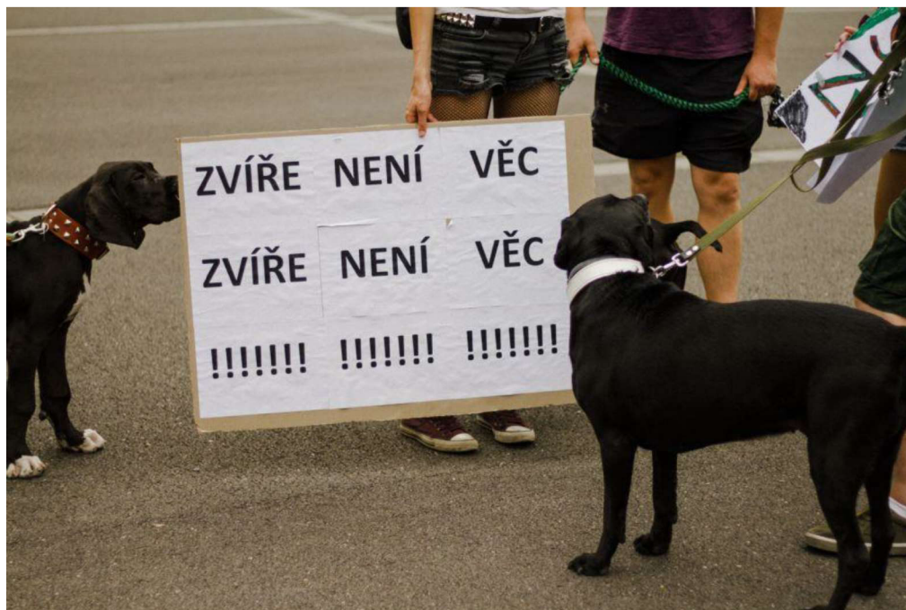
Obrázek 1 – Svoboda zvířat na demonstraci 3

Dalším významným právním předpisem, který upravuje postavení zvířete ve společnosti, je zákon č. 89/2012 Sb., občanský zákoník, který uvádí, že „Živé zvíře má zvláštní význam a hodnotu již jako smysly nadaný živý tvor. Živé zvíře není věcí a ustanovení o věcech se na živé zvíře použijí obdobně jen v rozsahu, ve kterém to neodporuje jeho povaze.“ 2