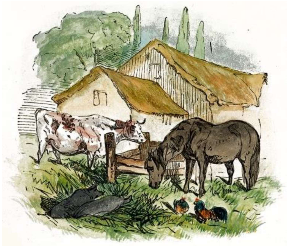
Obrázek 2 – Chov hospodářských zvířat 17

k téměř úplnému vymizení právní ochrany zvířat proti týrání z našeho právního řádu, a to bezmála na půl století.