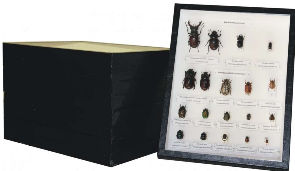
Obrázek 5 – Sbírka brouků České republiky (ilustrativní obrázek) 51

Dne 19. 7. 2021 bylo na Policii ČR přijato anonymní oznámení. Neznámá osoba na internetových stránkách portálu Bazoš.cz nabízela k prodeji přibližně 40 kusů neživých exemplářů silně ohrožených a kriticky ohrožených zvláště chráněných druhů brouků, kdy přílohou oznámení byla též fotografie předmětného inzerátu. 50