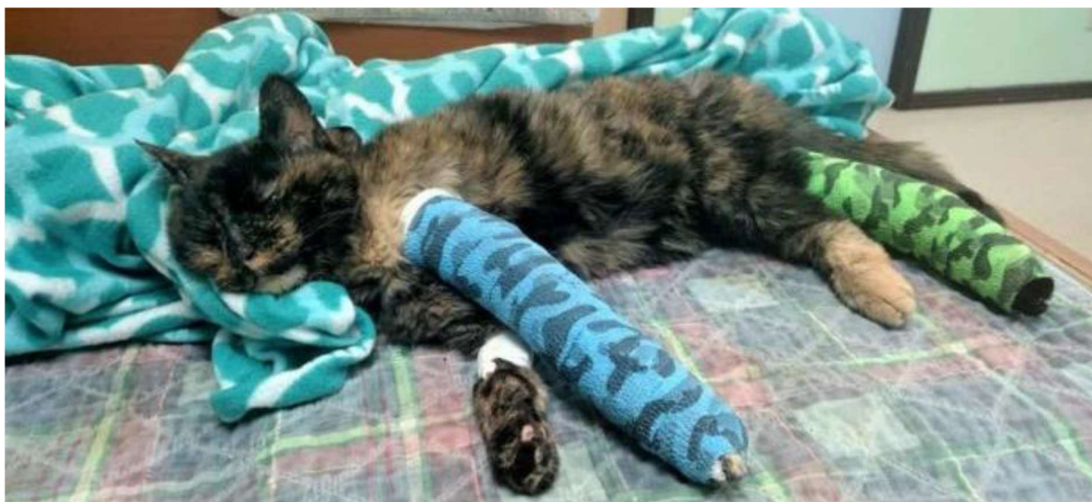
Obrázek 8 – Týrání kočky (ilustrativní obrázek) 57

Na základě těchto zjištění byly zahájeny úkony trestního řízení pro podezření ze spáchání přečinu týrání zvířat dle § 302 odst. 1, odst. 2 písm. a), odst. 3 písm. c) trestního zákoníku, tím že uvedeným jednáním bezdůvodně vystavil zvíře působení negativních stresových vlivů biologické povahy v podobě duševních útrap a stresu a fyzikální povahy v podobě vyvolání nepřiměřené bolesti, utrpení a neúměrného fyzického vyčerpání. Tímto jednáním pachatel porušil § 2 odst. 1 zákona č. 246/1992 Sb., na ochranu zvířat proti týrání a § 4 odst. 1 písm. k), n) zákona č. 246/1992 Sb., na ochranu zvířat proti týrání, tedy týral zvíře zvláště surovým a trýznivým způsobem na místě veřejnosti přístupném.