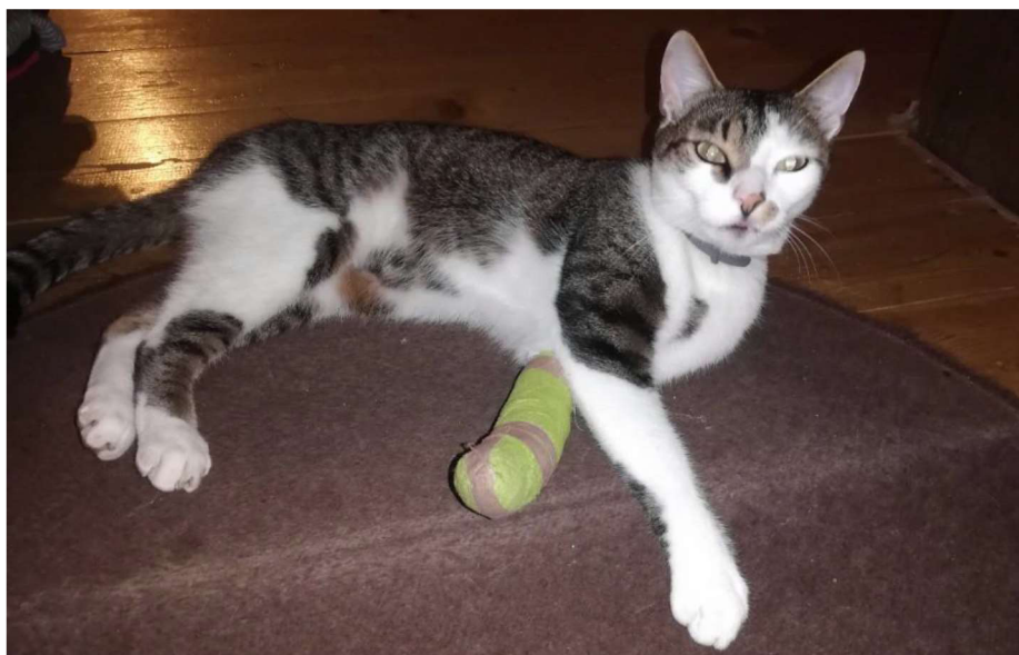
Obrázek 3 – Postřelený kocour (ilustrativní fotografie) 47

Dne 3. 2. 2021 v 15:00 hod. zjistil pan Kamil H., že jeho kocour kulhá na pravou zadní nohu. Majitel kocoura ihned odvezl ke zvěrolékaři, který jej ošetřil a z vnější části pravého stehna vyjmul olověnou diabolku. U kocoura došlo k drobné rance na kůži, přičemž k poškození stehenní kosti nedošlo. Kamil H. se následně dostavil na Policii ČR, kde o incidentu učinil oznámení. 46