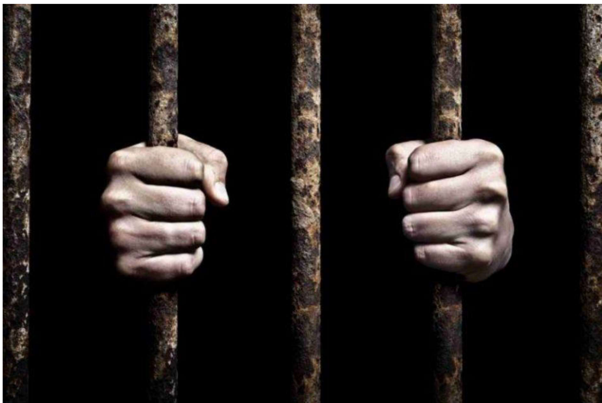
Obrázek 11 – Za mřížemi (ilustrativní obrázek) 63

V uvedené případové studii nedošlo k usmrcení zvěře, jelikož chycené srny v pytláckých okách našel pozorný myslivec a vysvobodil je, aniž by jim vzniklo vážné zranění. Pachatele se i přes veškeré úsilí policejního orgánu nepodařilo ustanovit, a tak nedošlo k jeho potrestání.