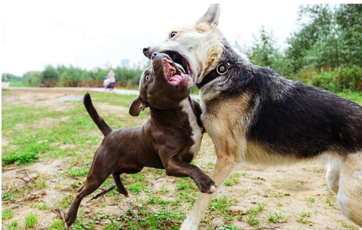
Obrázek 4 – Psí boj (ilustrativní obrázek) 49

Dne 10. 6. 2022 okolo 22:00 hod. venčila Miroslava O. své štěně rasy německý špic na ulici před svým domem. Během této chvíle (paní Miroslava měla svého psa přivázaného na vodítku) přiběhl pes rasy křížence stafordšírského teriéra s pitbulem a jejího psa napadl. Svědkem incidentu byl i majitel křížence, který k místu napadení přispěchal, vzal svého psa, připnul jej na vodítko a z místa utekl. Napadením však vzniklo štěněti zranění ve formě tržné rány na zadní straně krku, které si vyžádalo veterinární ošetření. Za toto ošetření zaplatila Miroslava O. částku ve výši 4 500,- Kč. Majitelka psa následně celou skutečnost ohlásila na linku 158. 48