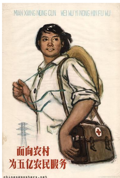
Obrázek 23 《面向农村为五亿农民服务》1965

LIN, Rixiong. Chinese posters [online]. [cit. 14.5.2018]. Dostupný z: https://chinese posters.net/posters/pc-1965-030.php