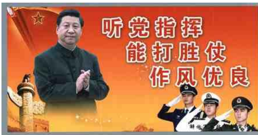
Obrázek 20 《听党指挥能打胜仗作风优良》2013

AUTOR NEUVEDEN. international institute of social history [online]. [cit. 14.5.2018]. Dostupný z: https://search.socialhistory.org/Record/1495949