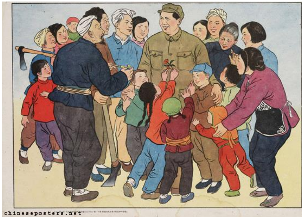
Obrázek 28 《毛主席爱儿童》1960

A, Zhi. Chinese posters [online]. [cit. 14.5.2018]. Dostupný z: https://chinese-posters.net/gallery/d29-715.php