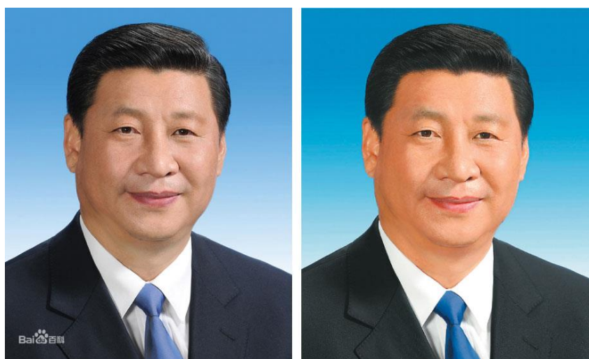
AUTOR NEUVEDEN. The New York Times [online]. [cit. 14.5.2018]. Dostupný z: https://www.nytimes.com/interactive/2017/11/09/world/asia/xi-propaganda.html