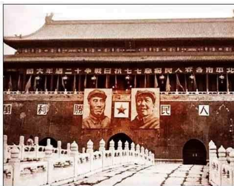
Obrázek 2 Portrét Mao Zedonga (vpravo) v roce 1949