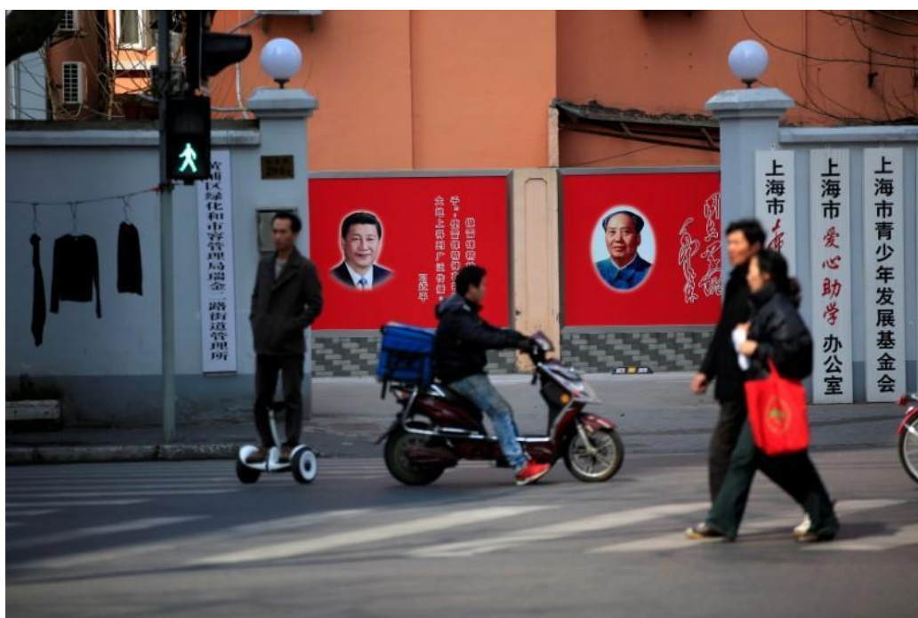
Obrázek 6 Xi Jinping (vlevo) a Mao Zedong (vpravo) v Šanghaji 2017