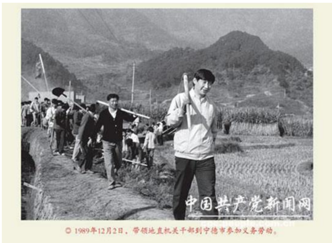
Obrázek 11 Fotografie Xi Jinpinga v Ningde 1989

AUTOR NEUVEDEN. The Mediated Image [online]. [cit. 14.5.2018]. Dostupný z: https://themediatedimage.com/2015/05/10/xis-little-red-app-and-the-face-of-contemporary-propaganda/