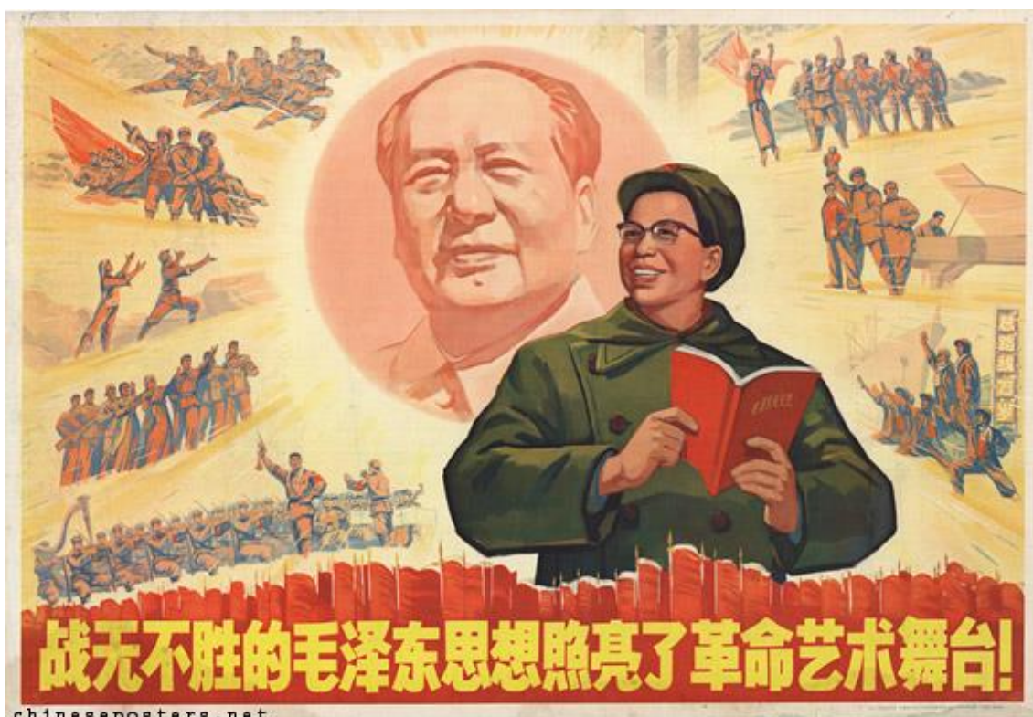
Obrázek 36 《战无不胜的毛泽东思想照亮了革命艺术舞台! 》1969

ZHEJIANG WORKERS-PEASANTS-SOLDIERS FINE ARTS ACADEMY, WANG ZHAODA COLLECTIVE WORK. Chinese posters [online]. [cit. 14.5.2018]. Dostupný z: https://chineseposters.net/posters/e15-573.php