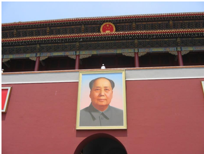
Obrázek 1 Portrét Mao Zedonga na náměstí Tian'anmen v Pekingu

AUTOR NEUVEDEN. Wikimedia Commons [online]. [cit. 14.5.2018]. Dostupný z: https://commons.wikimedia.org/wiki/File:Chairman_Mao.jpg