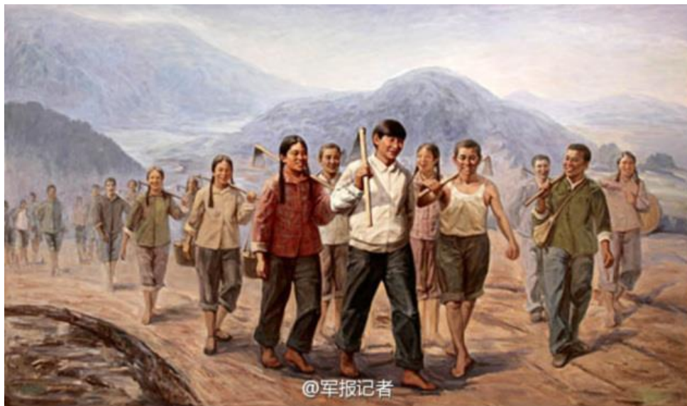
Obrázek 10 Xi Jinping v Ningde