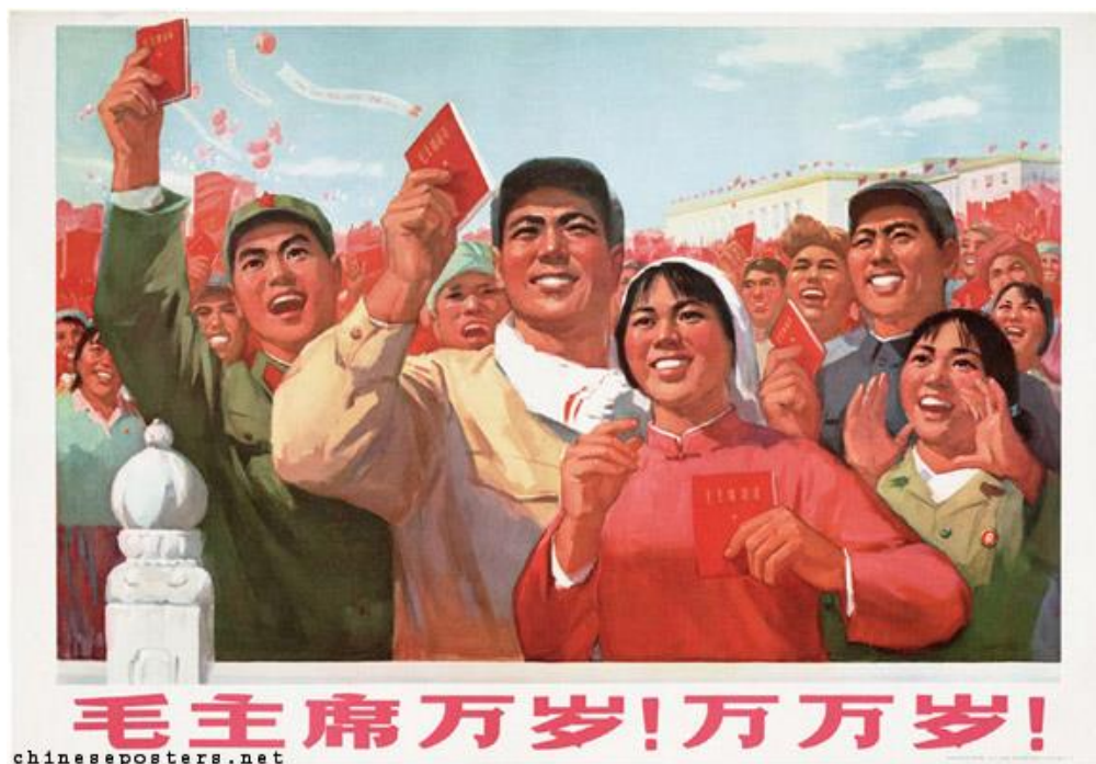
Obrázek 30 《毛主席万岁! 万万岁!》1970

SHANGHAI FINE ARTS ACADEMY WORK PROPAGANDA TEAM, REVOLUTIONARY COMMITTEE COLLECTIVE WORK. Chinese posters [online]. [cit. 14.5.2018]. Dostupný z: https://chineseposters.net/posters/e13-701.php