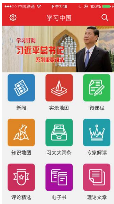
Obrázek 32 Mobilní aplikace 学习中国

AUTOR NEUVEDEN. The Mediated Image [online]. [cit. 14.5.2018]. Dostupný z: https://themediatedimage.com/2015/05/10/xis-little-red-app-and-the-face-of-contemporary-propaganda/