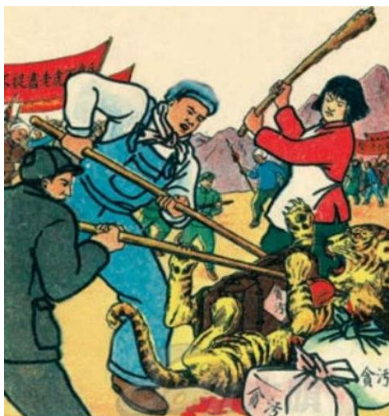
Obrázek 16 《打老虎》