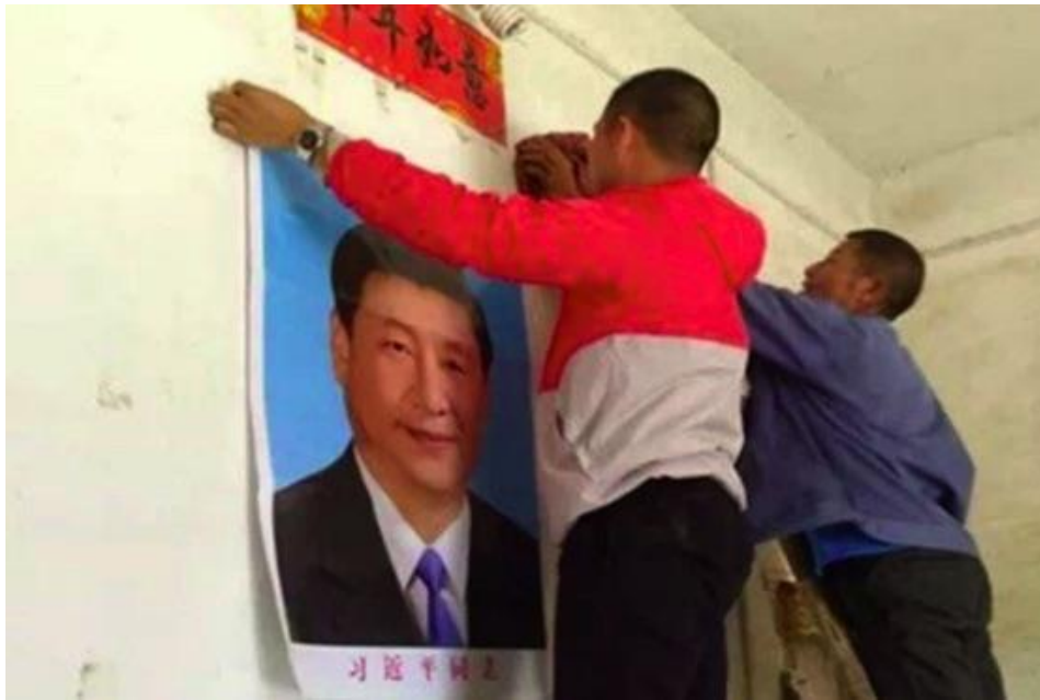
Obrázek 8 Lidé umísťujú portrét Xi Jinpinga na zed' 2017