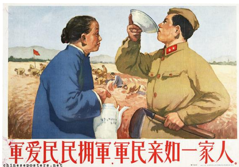
Obrázek 19 《军爱民，民拥军，军民亲如一家》1957

CAO, Youcheng. Chinese posters [online]. [cit. 14.5.2018]. Dostupný z: https://chineseposters.net/posters/e15-354.php