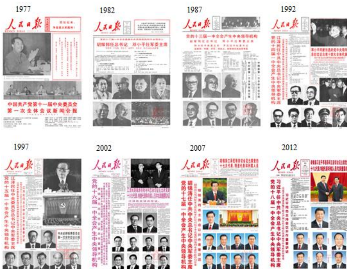
Obrázek 3 Titulní strany novin 人民日报 mezi lety 1977-2012

AUTOR NEUVEDEN; upraveno autorem. The New York Times [online]. [cit. 14.5.2018]. Dostupný z: https://www.nytimes.com/interactive/2017/11/09/world/asia/xi-propaganda.html