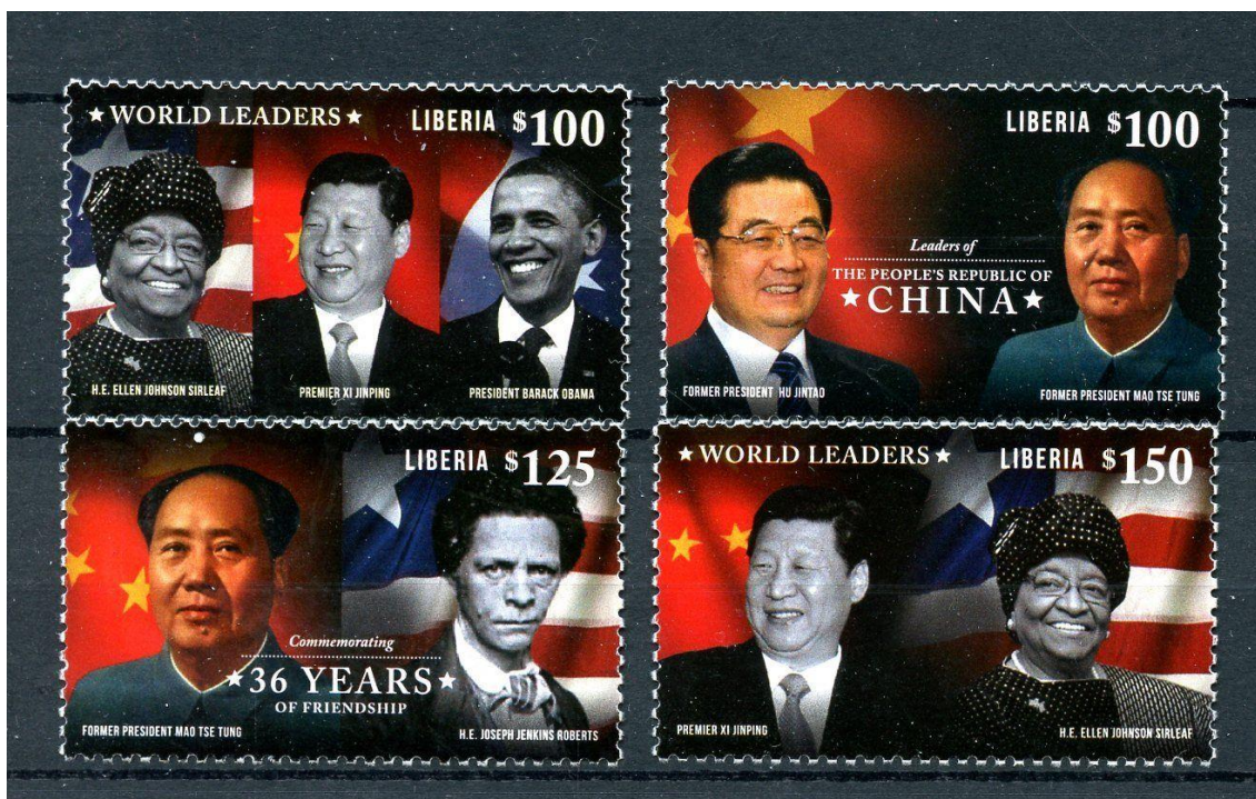
Obrázek 41 Liberijské poštovní známky *World Leaders* 2014