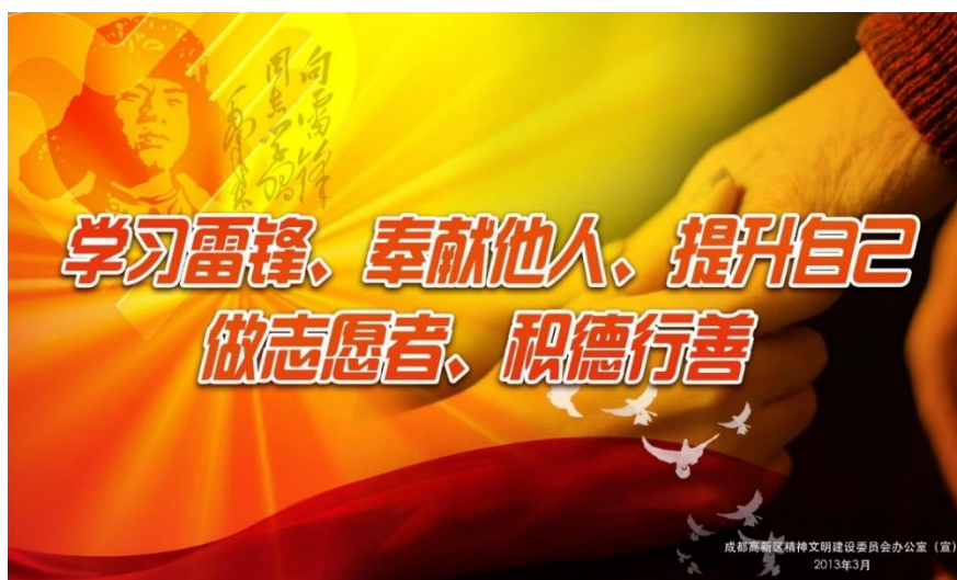
Obrázek 39 《学习雷锋，奉献他人，提升自己，做志愿者，积德行善》2013

CHENGDU WENMING BAN. wenming [online]. [cit. 14.5.2018]. Dostupný z: http://www.wenming.cn/jwmsxf_294/yjsbdjwmsxfgyggzpb/gygg/xf/201303/t20130320_1127862.shtml