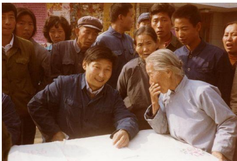
Obrázek 14 Fotografie Xi Jipinga z roku 1983

AUTOR NEUVEDEN. The Mediated Image [online]. [cit. 14.5.2018]. Dostupný z: https://themediatedimage.com/2015/05/10/xis-little-red-app-and-the-face-of-contemporary-propaganda/