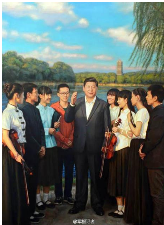
Obrázek 29 Xi Jinping se studenty Pekingské univerzity

AUTOR NEUVEDEN. The Mediated Image [online]. [cit. 14.5.2018]. Dostupný z: https://themediatedimage.com/2015/05/10/xis-little-red-app-and-the-face-of-contemporary-propaganda/