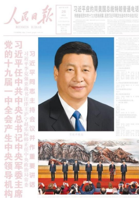
AUTOR NEUVEDEN. The New York Times [online]. [cit. 14.5.2018]. Dostupný z: https://www.nytimes.com/interactive/2017/11/09/world/asia/xi-propaganda.html