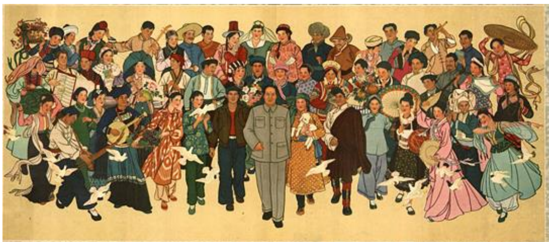
Obrázek 25 《民族大团结万岁》1960

NATIONAL PAINTING DEPARTMENT OF THE CENTRAL ART ACADEMY, upraveno autorem. Chinese posters [online]. [cit. 14.5.2018]. Dostupný z: https://chineseposters.net/posters/e15-561.php