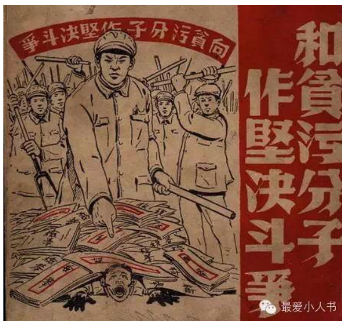
Obrázek 15 《和贪污分子作坚决斗争》1952

AUTOR NEUVEDEN. Meiri toutiao [online]. [cit. 14.5.2018]. Dostupný z: https://kknews.cc/zh-cn/culture/om8b44p.html