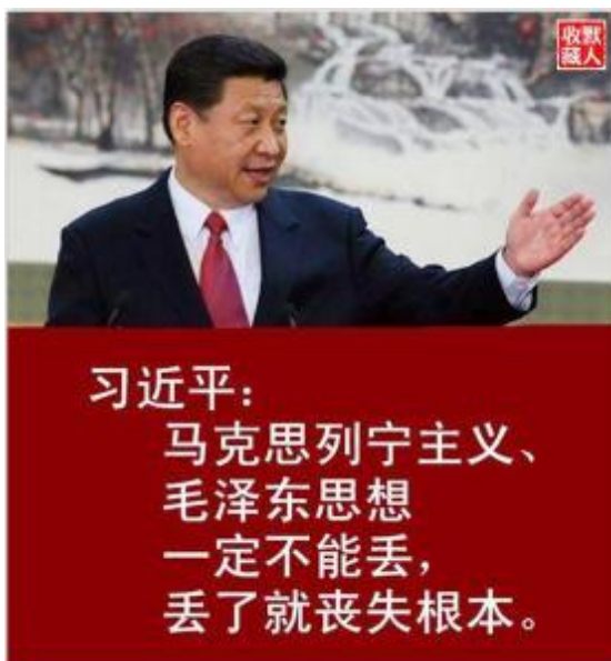
Obrázek 34 《马克思列宁主义，毛泽东思想一定不能丢，丢了就丧失根本。》2012

AUTOR NEUVEDEN. Blog Sina [online]. [cit. 3.4.2018]. Dostupný z: http://blog.sina.com.cn/s/blog_71d006f9010140f3.html