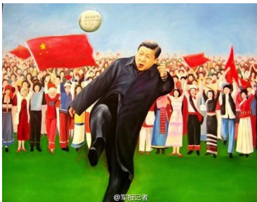
Obrázek 26 Xi Jinping vede zástupce čínských národnostních menšin