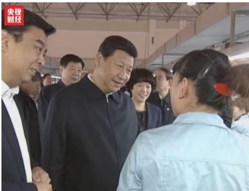
AUTOR NEUVEDEN. Qingdaonews [online], [cit. 14.5.2018]. Dostupný z: http://news.qingdaonews.com/qingdao/2017-10/12/content_20029283.htm