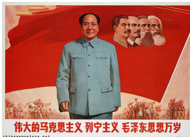
Obrázek 33 《伟大的马克思主义列宁主义毛泽东思想万岁》1971

SHAANXI PROVINCIAL CLASS EDUCATION EXHIBITION HALL. Chinese-posters [online]. [cit. 14.5.2018]. Dostupný z: https://chinese-posters.net/posters/g2-26.php