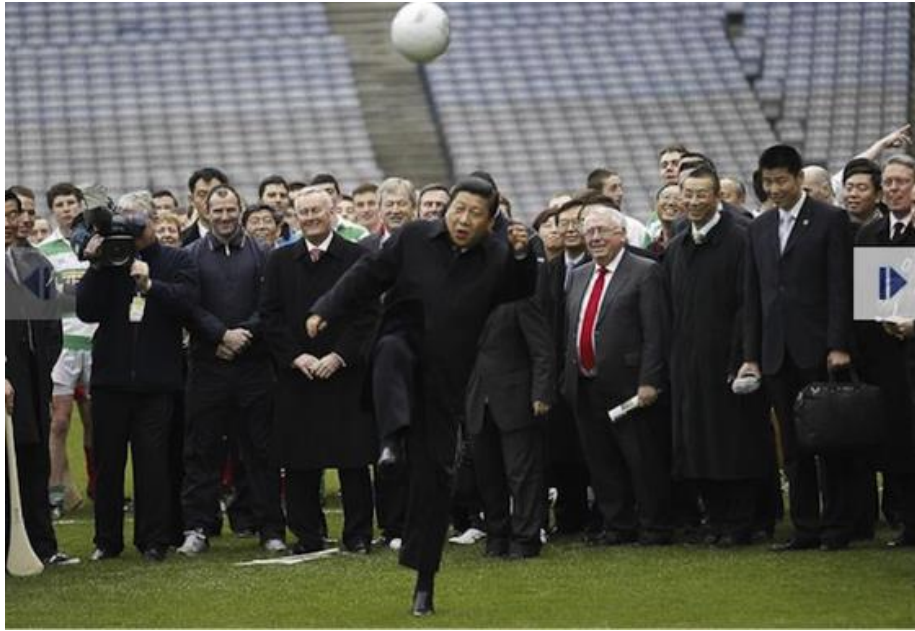
Obrázek 27 Xi Jinping během návštěvy Dublinu v roce 2012