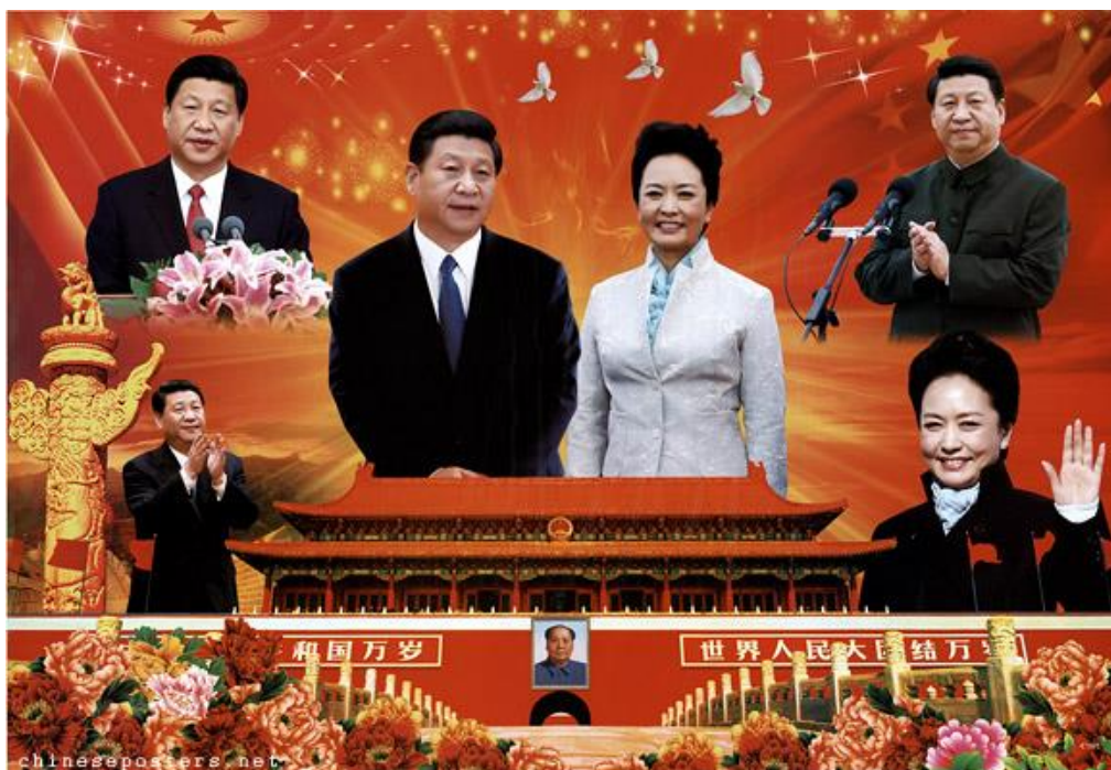
Obrázek 37 Xi Jinping a Peng Liyuan 2012

AUTOR NEUVEDEN. Chinese posters [online]. [cit. 14.5.2018]. Dostupný z: https://chinese posters.net/posters/e37-412.php