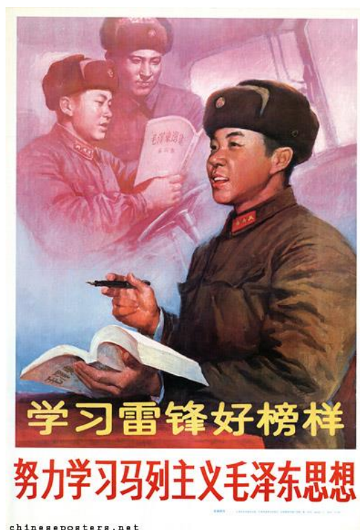
Obrázek 38 《学习雷锋好榜样-努力学习马列主义毛泽东思想》

XU, Fugen. Chinese posters [online]. [cit. 14.5.2018]. Dostupný z: https://chinese posters . net/posters/e13-3.php