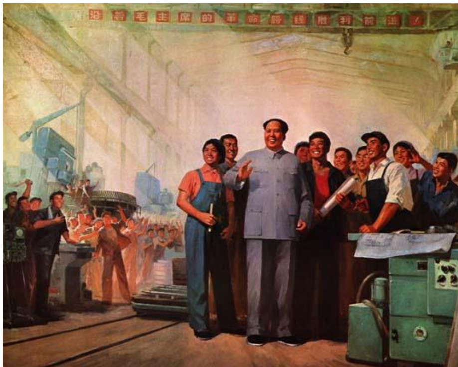
Obrázek 21 《光辉的道路，灿烂的前程》1976

WORKERS OF SHANGHAI, YANGCHUAN, AND LUTA. A Visual Sourcebook of Chinese Civilization [online]. [cit. 14.5.2018]. Dostupný z: https://depts.washington.edu/chinaciv/graph/9prelead.htm