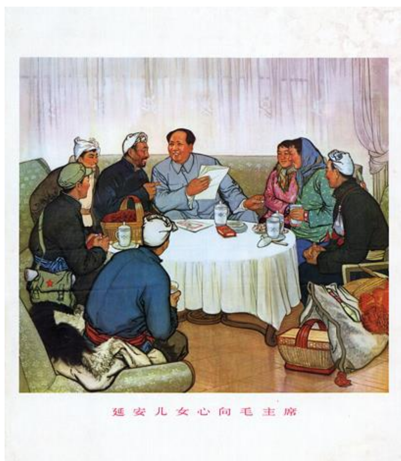
Obrázek 12 《延安儿女心向毛主席》1974

SHAANXI PROVINCIAL FINE ARTS CREATION GROUP, upraveno autorem. Chinese posters [online]. [cit. 14.5.2018]. Dostupný z: https://chinese posters.net/posters/e13-631.php