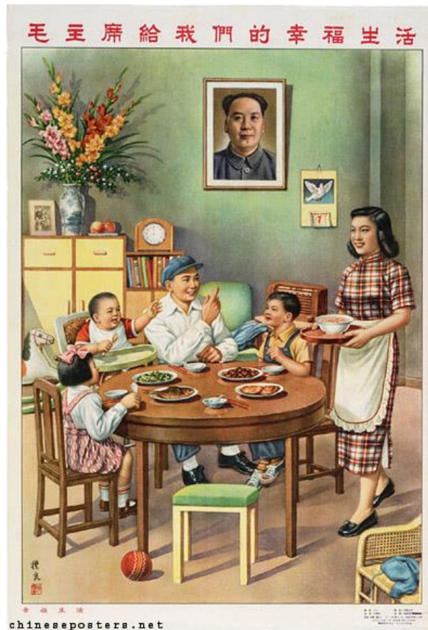
Obrázek 7 《毛主席给我们的幸福生活》 1954

XIN, Liliang. Chinese posters [online]. [cit. 14.5.2018]. Dostupný z: https://chineseposters.net/posters/e16-269.php