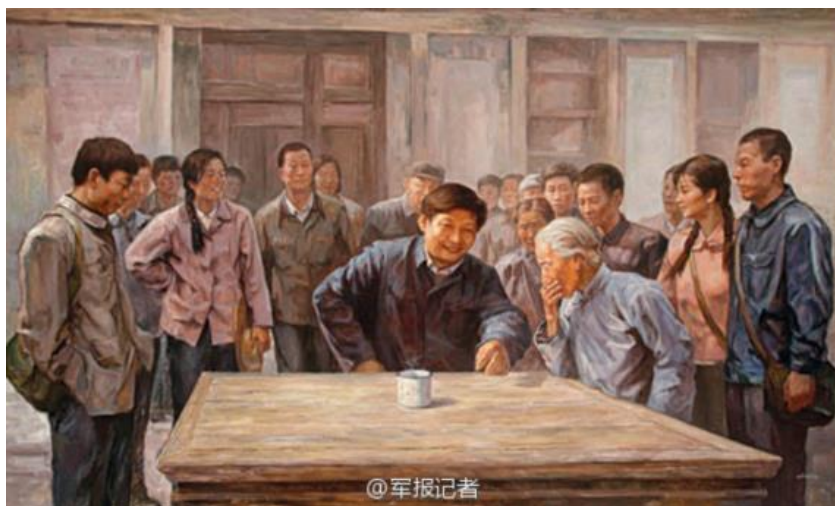
Obrázek 13 Xi Jinping v okrese Zhengding

AUTOR NEUVEDEN. The Mediated Image [online]. [cit. 14.5.2018]. Dostupný z: https://themediatedimage.com/2015/05/10/xis-little-red-app-and-the-face-of-contemporary-propaganda/