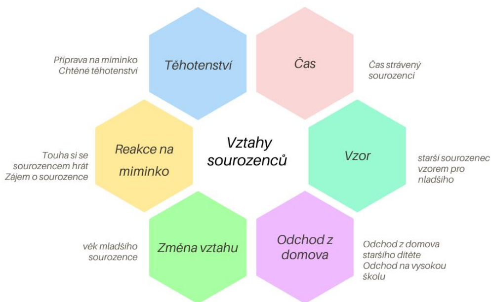
Schéma 1: Ukázka témat otázek

Rozhovor tvořilo 29 otázek a pro děti z nově vzniklých rodin 31 otázek.