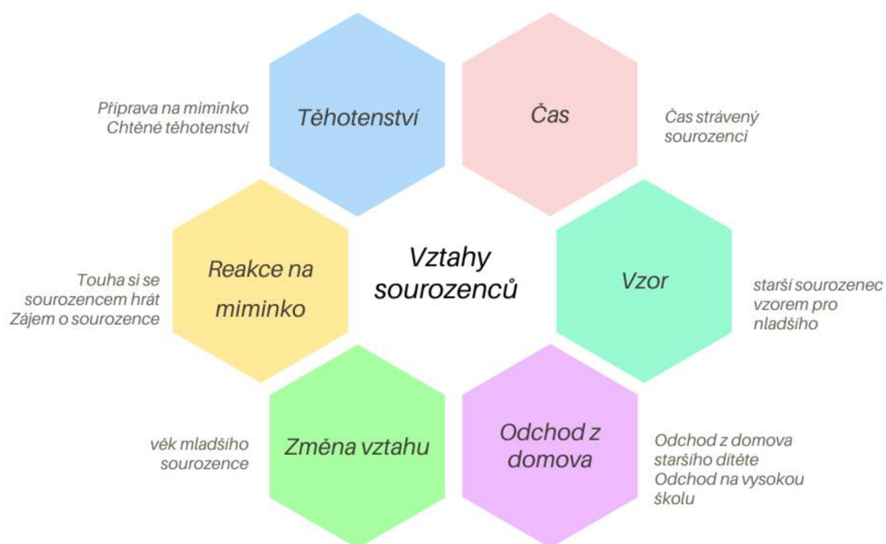
Schéma 1: Ukázka témat otázek

Rozhovor tvořilo 29 otázek a pro děti z nově vzniklých rodin 31 otázek.