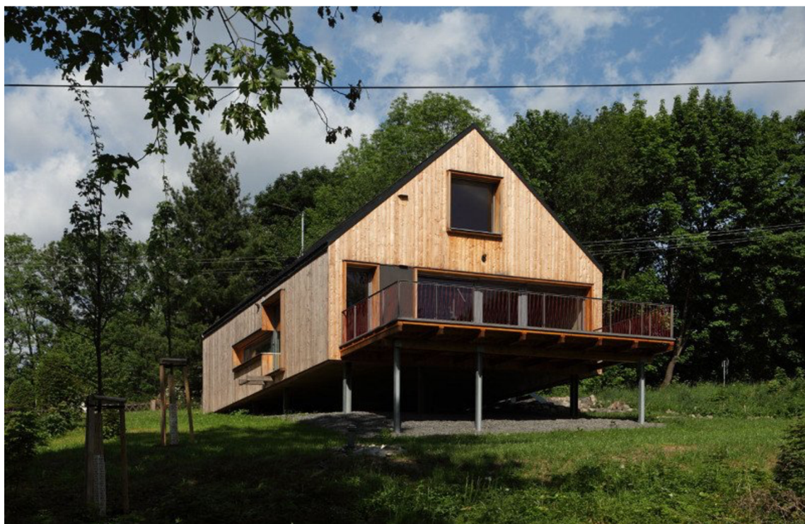
Obr. 11. Futura Freestyle v Pulečném (Horák, P., Zahradníček, J. 2014)

Fasáda je zde řešena obkladem z prken kladených vertikálně. Jedná se o provětrávanou fasádu s vloženou tepelnou izolací. Skladba obvodového pláště je ze třech základních vrstev – CLT panel, tepelná izolace, fasádní prkna (Horák, P., Zahradníček, J. 2014).