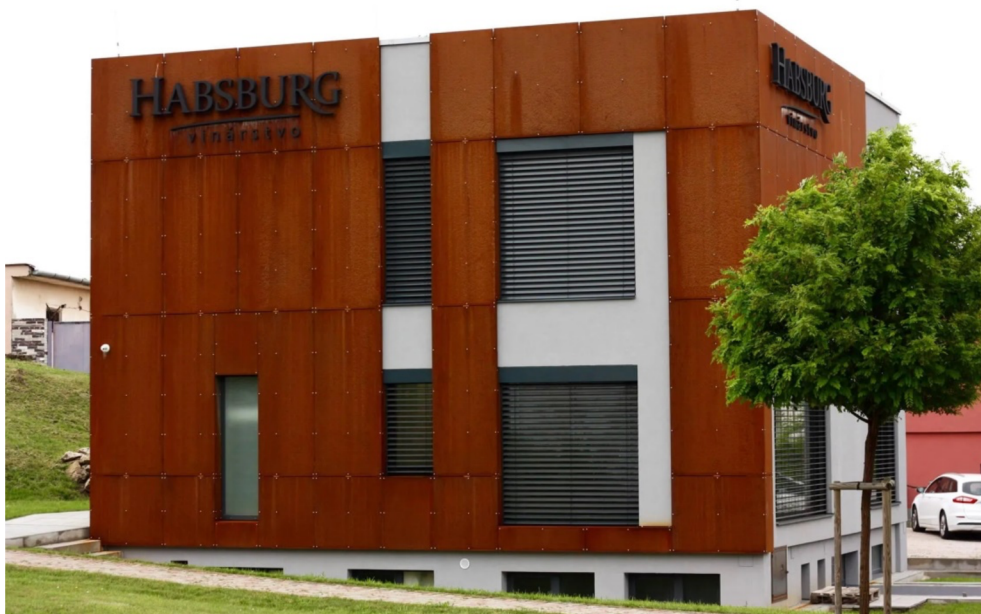
Obr. 2. Použití materiálu Cor-ten na fasádu (Archiweb, 2022)

Moderním materiálem pro fasády je sklo. Skleněné fasády jsou obvyklým řešením zejména pro velké kancelářské budovy. Může být součástí fasádní konstrukce nebo tvoří tenkou zavěšenou fasádu, která je instalována na venkovní zdi budovy. Prvky