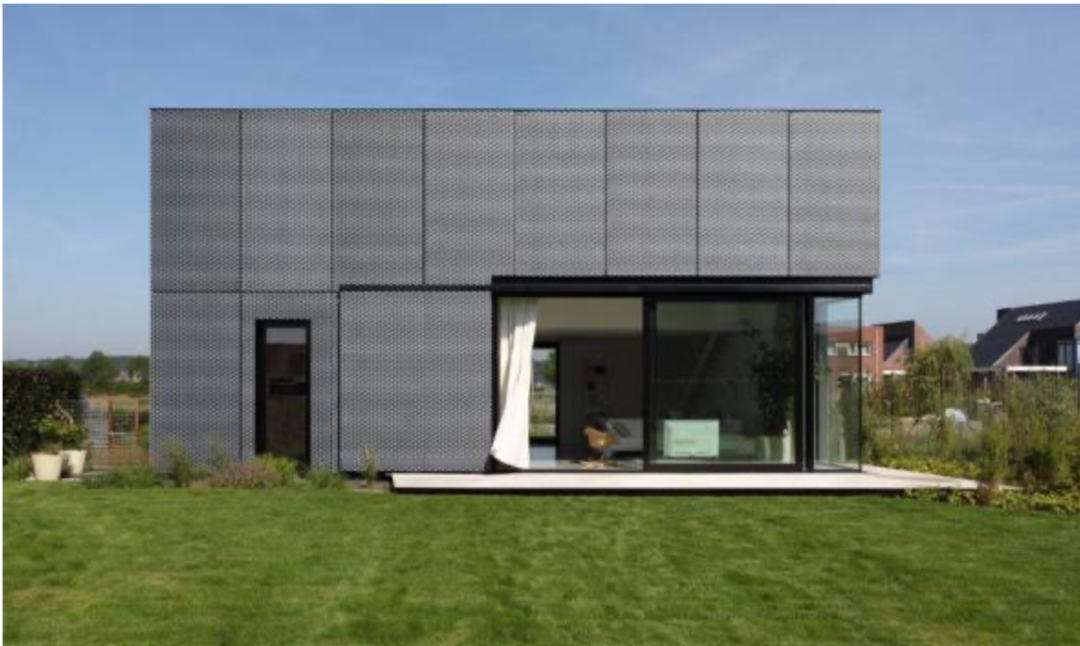
Obr. 1. Použití materiálu tahokov na fasádu (Adgnews, 2022)

na roštu, nebo s provětrávanou mezerou, nebo kompozitní materiál s termojádrem (Daňková, 2015).