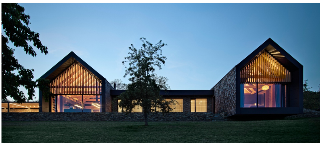
Obr. 7. Chalet Karlov

Na střechu a fasádu byly použity modřínové šindele.