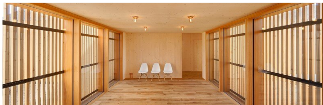
Obr. 14. Wohnhaus aus Holz v Neumarkt in der Oberpfalz (Nurgül, 2018)