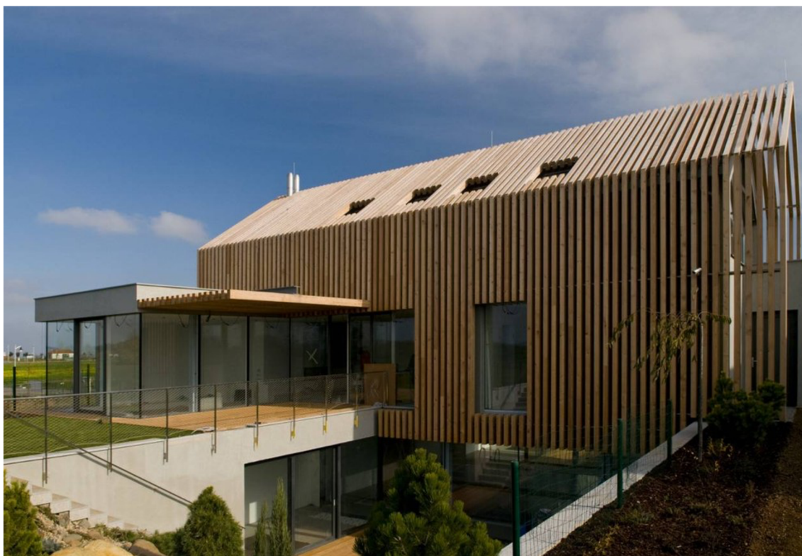
Obr. 15. Dům u Kamenů

Konstrukce fasády je realizována z ráků o profilu 100 x 200 mm z lepeného lamelového dřeva ze sibiřského modřínu. Ráky jsou neseny na nerezových zámečnických prvcích, které jsou kotveny do pláště objektu. Trubky z nerez oceli zde nahrazují nosné horizontální latě. Odsazení lamelových ráků je 185 mm od fasády (Grochalová a kol. 2013).