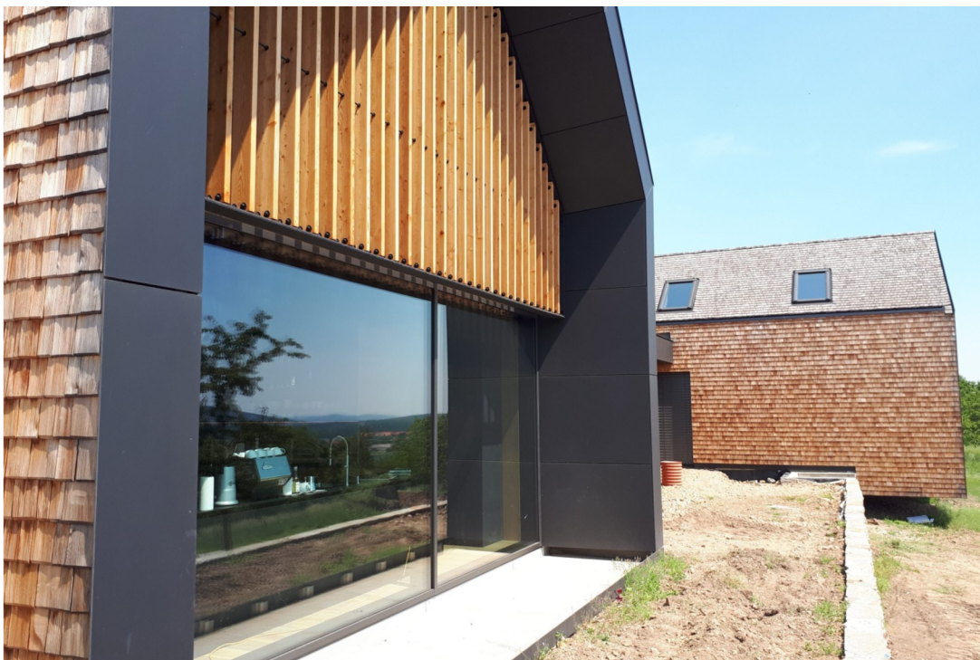
Obr. 8. Chalet Karlov