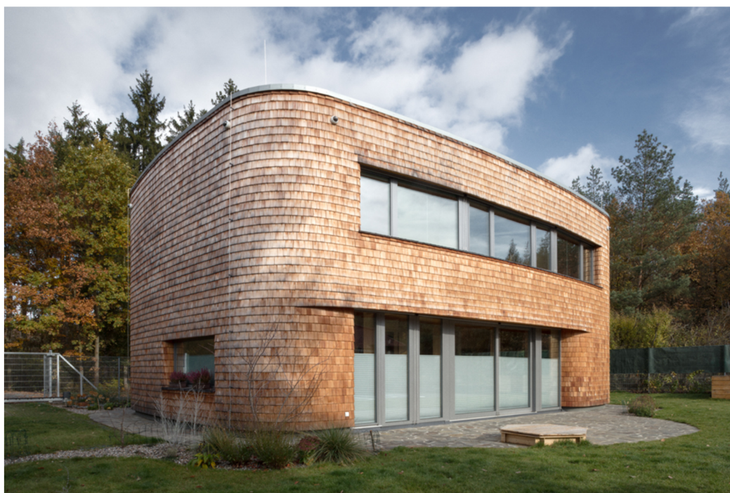
Obr. 9. Rodinný dům v Dobříši (Mímosa, 2022)

Konstrukčně je dům dřevostavbou z masivních dřevěných panelů s difuzně otevřenou skladbou vnější obálky (Kozlová, 2017). Plášť je zateplen dřevovláknitou izolací, finální vrstvou jsou modřínové šindele. Fasáda ze štípaných šindelů dává domu drobnější měřítka a sounáležitost s lesem za zády, relativně snadno kopíruje tvar stavby. Část stěn v interiéru je opatřena šindelí a hliněnou omítkou (Mímosa, 2022).