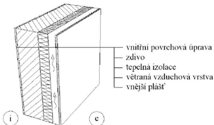
Obr. 4. Příklad provětrávané fasády

U provětrávaných fasád (Obr. 4) je dodržen odstup od konstrukční obvodové stěny. Mezi ní a tepelnou izolací s fasádním obkladem z nejrůznějších materiálů (dřevo, cihly, kov, keramika, plast) je vytvořena vzduchová mezera. V mezeře dochází k proudění vzduchu za pomoci komínového efektu, což umožňuje účinný odvod vlhkosti a zároveň zabráňuje přehřívání fasády. Větrané fasády nacházejí použití u dřevostaveb i novostaveb, protože umožňují široké použití finálních povrchů.