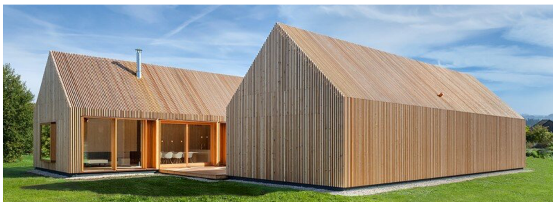
Obr. 13. Wohnhaus aus Holz v Neumarkt in der Oberpfalz (Nurgül, 2018)

Objekt je obložen vertikálními lamelami z modřínového dřeva bez dalších povrchových úprav (Nurgül, 2018). Jedním z důvodů bylo i ekologické hledisko stavby, které bylo uplatněno i tak, že výřezy po oknech a dveřích z masivní obvodové konstrukce byly upraveny a použity v interiéru jako stoly. Část okenních otvorů je z exteriéru překryto lamelami, které slouží částečně jako ochrana proti slunci, vytváří v interiéru soukromí a v exteriéru dojem celistvosti a jednolitosti fasád.