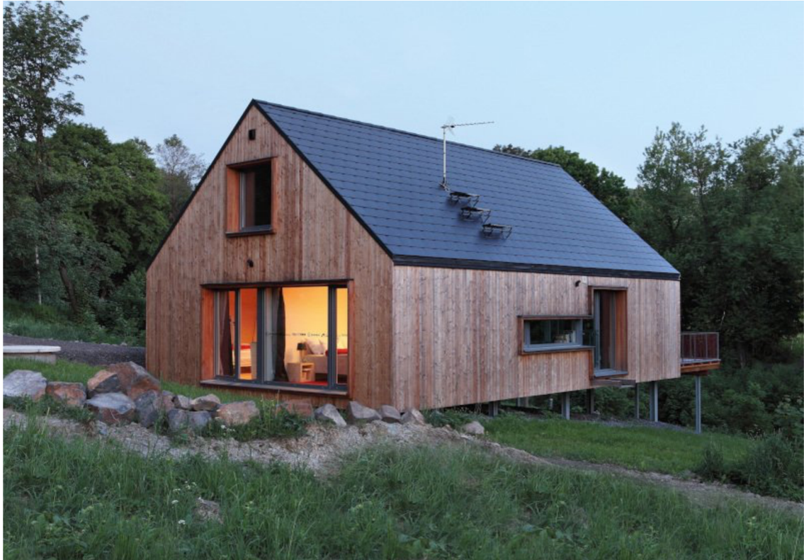
Obr. 12. Futura Freestyle v Pulečném (Horák, P., Zahradníček, J. 2014)