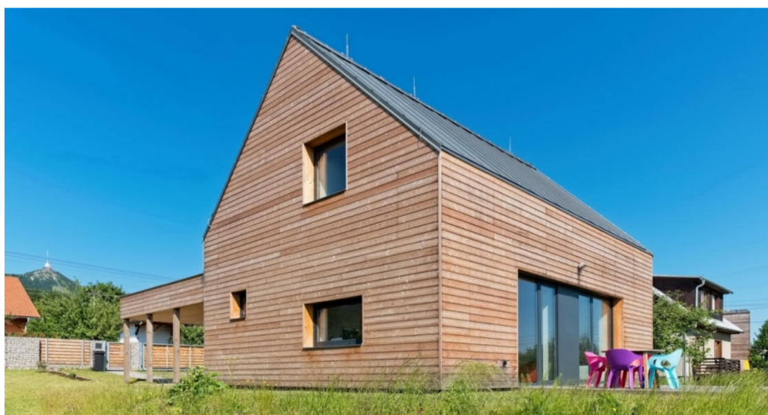
Obr. 10. Dům pod Ještědem (archiweb, 2017)

Jednoduše a pragmaticky řešený malý dům v horském prostředí situovaný na okraji Liberce (Obr. 10). Malé rozměry domu vyžadují velmi precizní návrh. Všechny prostory objektu jsou řešeny na milimetr včetně rozmístění nábytku. Díky tomu je docíleno toho, že v relativně malém domě nabydete dojem prostorného bydlení. Modřínové obložení fasády má být ponecháno vlivům počasí, časem tedy získá stříbrnou patinu. Krytina střechy je předzvětralý titan-zinek (archiweb, 2017).