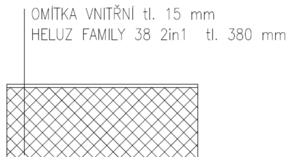
Obr. 6. Referenční zděná konstrukce

Již druhy uvedených nosných konstrukcí mají své klady a zápory. Zděná konstrukce je například při hodnotách pasivního domu vystavěna z tvárnic o větší