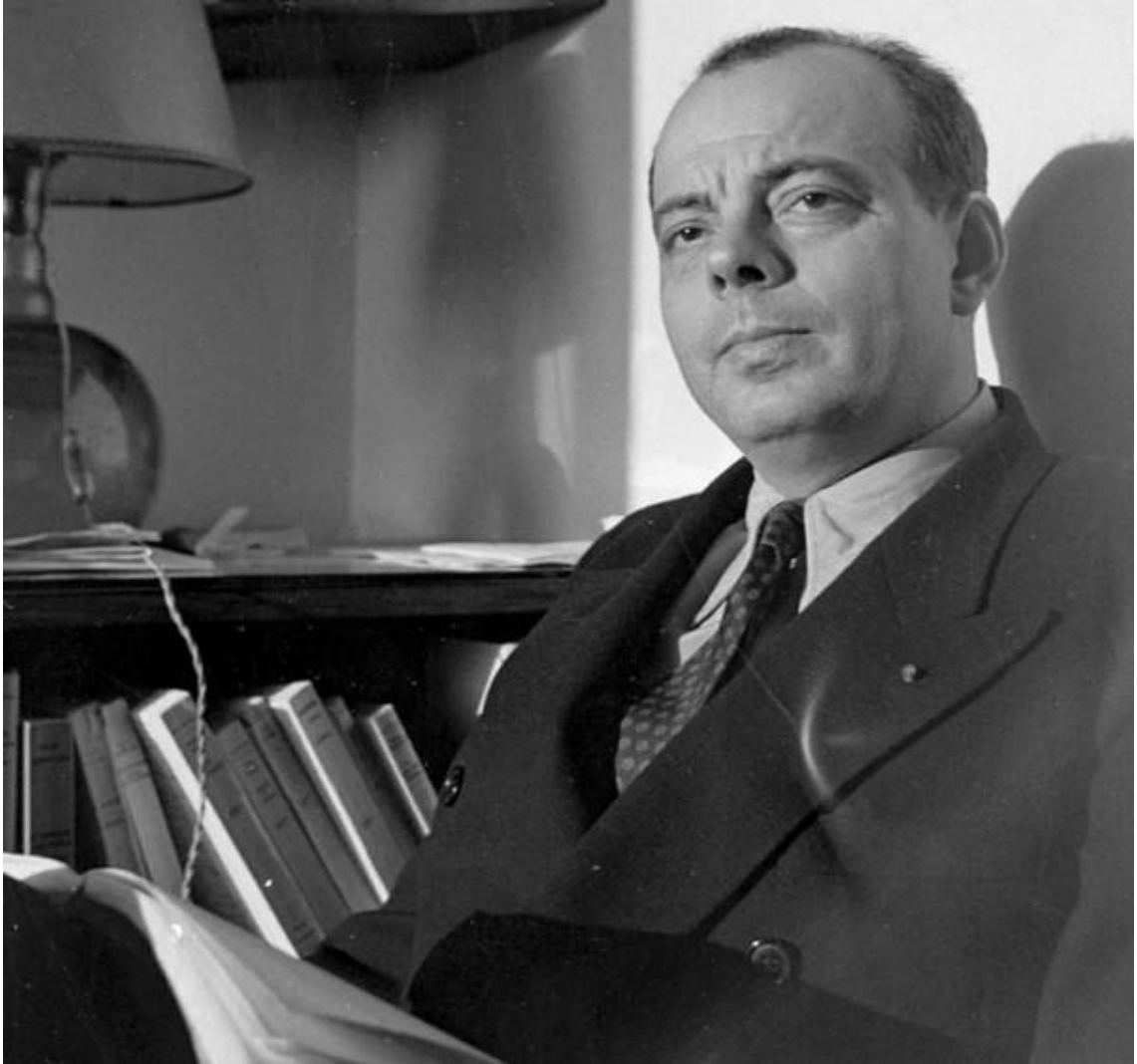
Le portrait de l'auteur du Petit Prince Antoine de Saint-Exupéry.