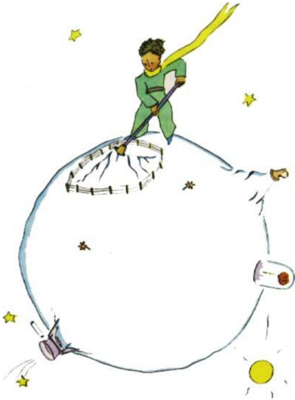
Le petit prince à sa planète.