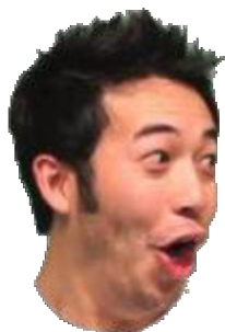
Obrázek 1: Discord Emoji – PogChamp

Poznámka: Zkratka "Pog" původně znamená "Play of the Game". Další verze tohoto emotu může být např. Poggers.