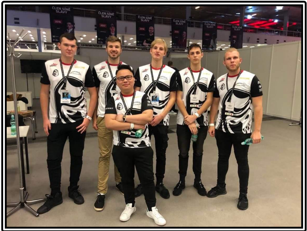
Obrázek 8: Mistrovství české republiky 2021 v Brně