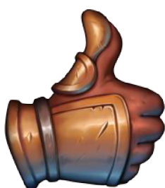
Obrázek 5: Wild Rift Emoji – GOOD JOB! 3