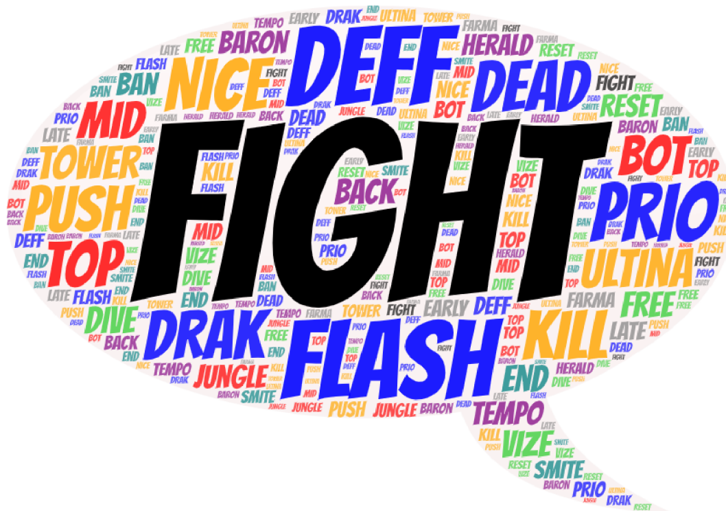
Obrázek 14: Slovní mrak obsahující nejčastější slova objevující se v nahrávkách

Slovní mraky neboli Word Clouds vyjadřují vizuální reprezentaci slov. Větší důraz je kladen na slova, která se v komunikaci objevují hojněji.