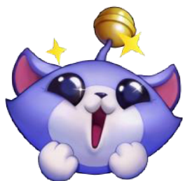
Obrázek 3: Wild Rift Emoji – TOO CUTE! 1