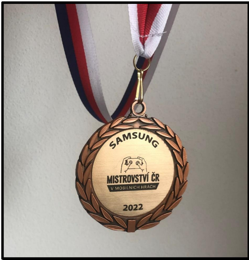
Obrázek 10: MČR 2022 – bronzová medaile