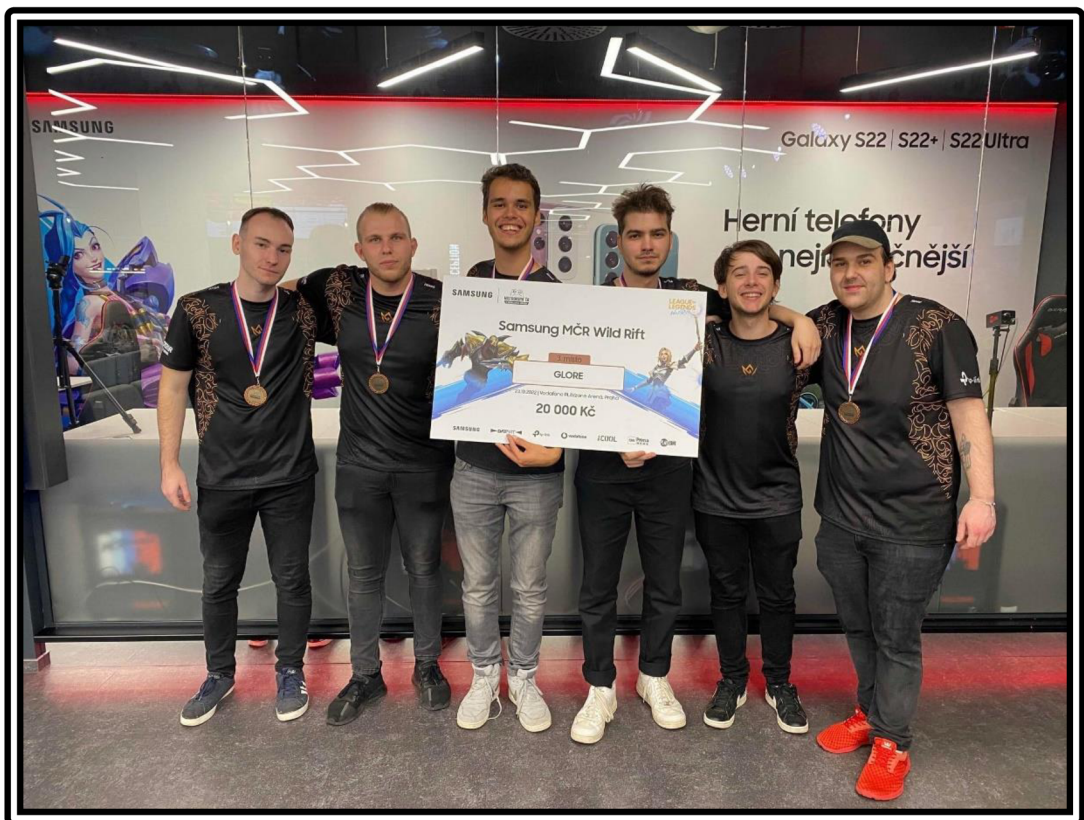
Obrázek 9: Mistrovství České republiky 2022 v Praze