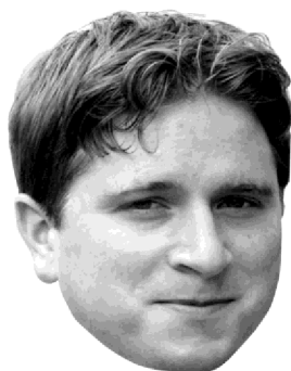
Obrázek 2: Discord Emoji – Kappa

Poznámka: Zkratka "Pog" původně znamená "Play of the Game". Další verze tohoto emotu může být např. Poggers.