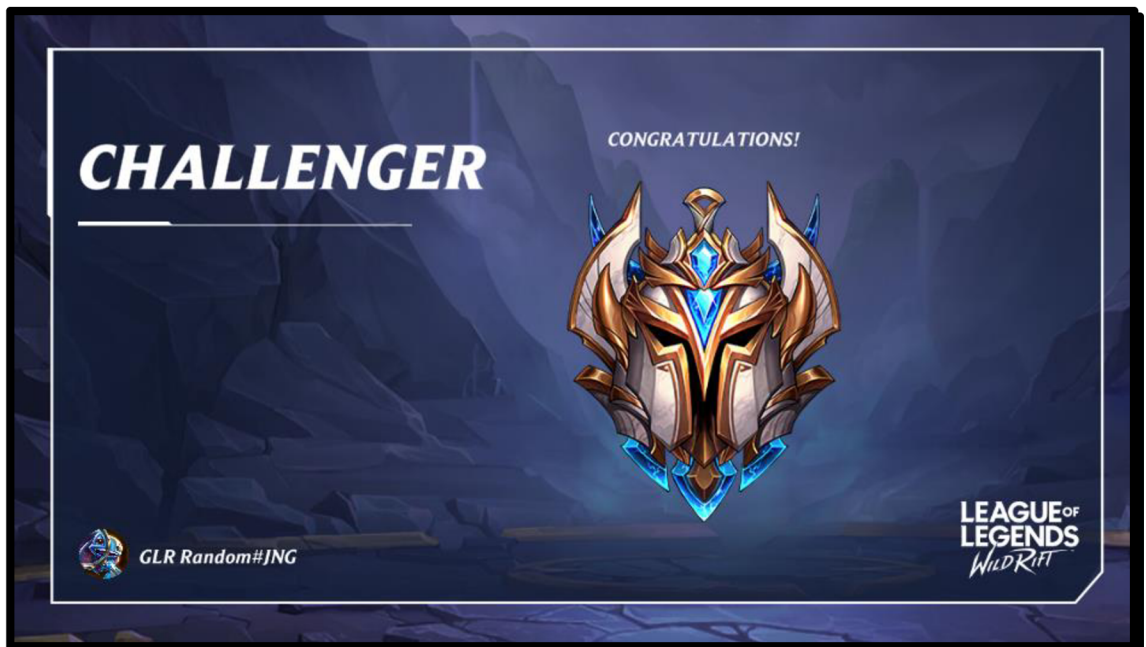
Obrázek 11: Dosažení nejvyšší divize – Challenger