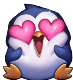
Obrázek 4: Wild Rift Emoji – I LOVE IT! 2