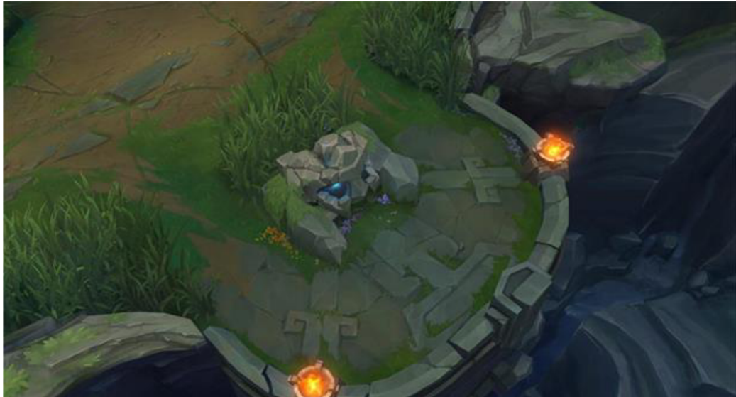
Obrázek 7: Výklenky na postranních linkách ve hře League of Legends

Rozdíl nacházíme také u goldů, které se ve WR získávají mnohem snadněji. Goldy neboli zlatáky zde dostáváme za každého creepa (nebo taktéž miniona), který poblíž hráče zemře. Není tedy třeba last hitovat k zisku goldů, ačkoli je last hitování v samotné hře velmi důležité a díky němu hráč získává podstatně více peněz pro nákup herních itemů.