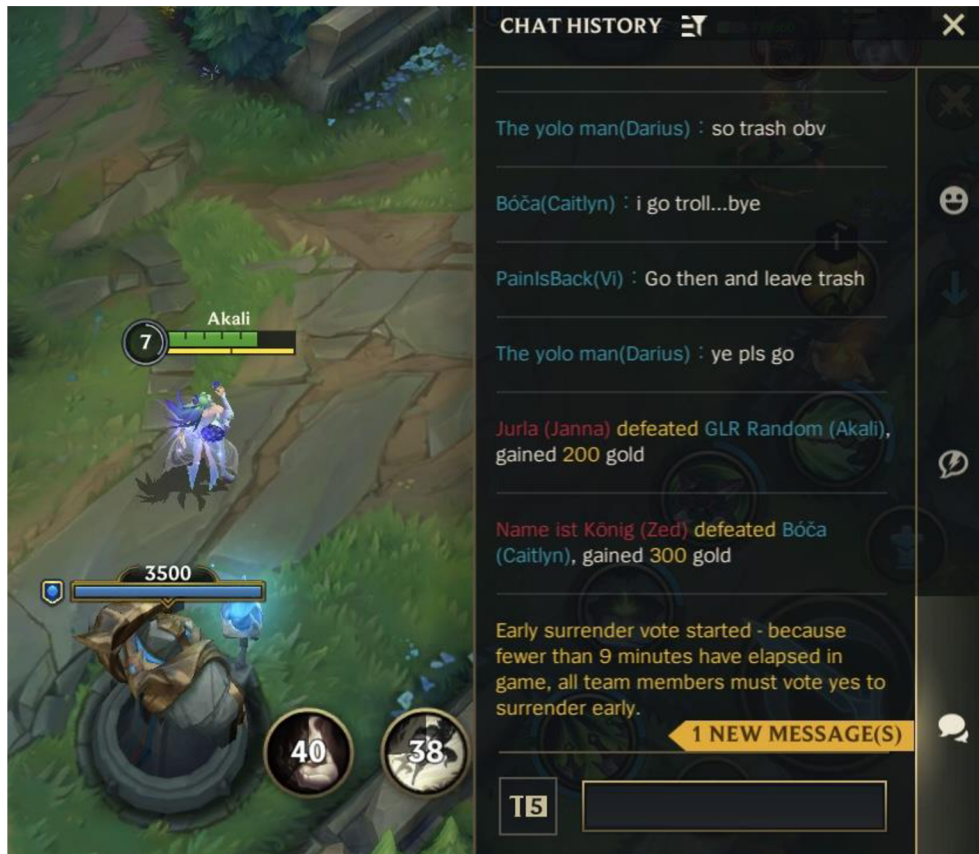
Obrázek 12: Screenshot ze hry Wild Rift, ukázka toxického chatování ve hře

Komunikace v online hrách slouží k usnadnění mnoha věcí, ale ne vždy na nás udělá chatování s ostatními pozitivní dojem. Níže můžeme vidět screen z hodnocené hry, kde se hra nevyvíjela úplně dobře, což mělo za následek negativní dopad na mentalitu a psychiku ostatních zahraničních hráčů. Na obrázku můžeme vidět, že celá tato komunikace vyústila v surrender neboli kapitulaci, v níž se hlasovalo o předčasném ukončení hry.