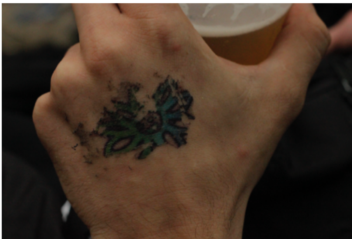
Fotografie tetovacích nálepek na kůži, záběry z párty, 2020