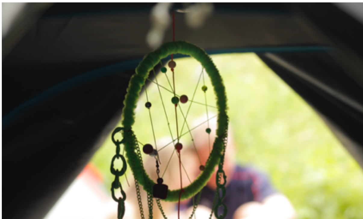
Lapač snů, 2020