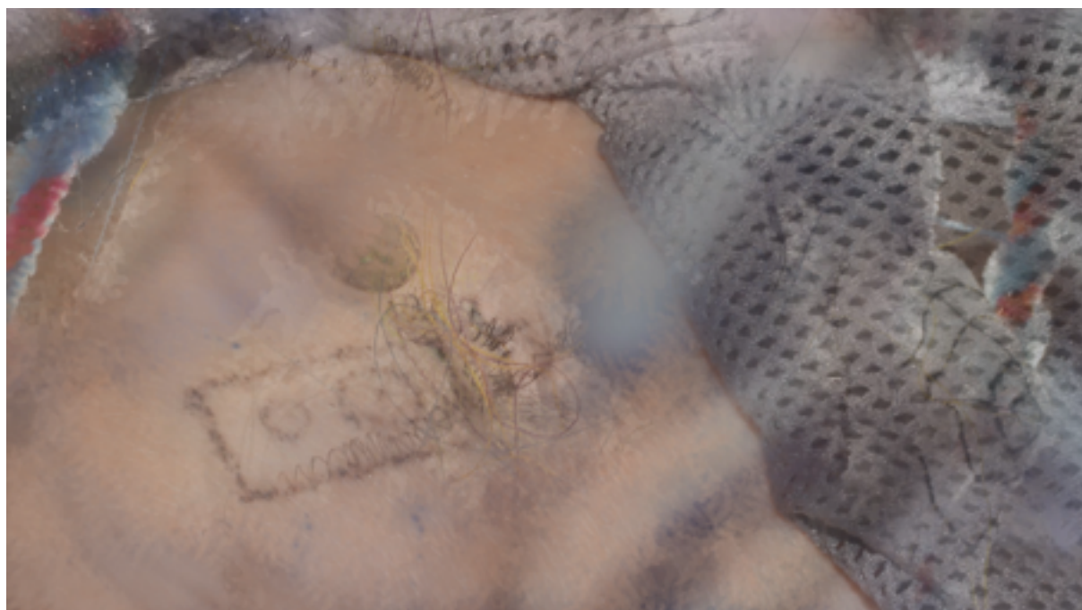
Screenshot z videa, transformace fotek, 2020