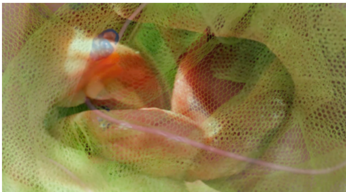
Screenshot z videa, transformace fotek, 2020