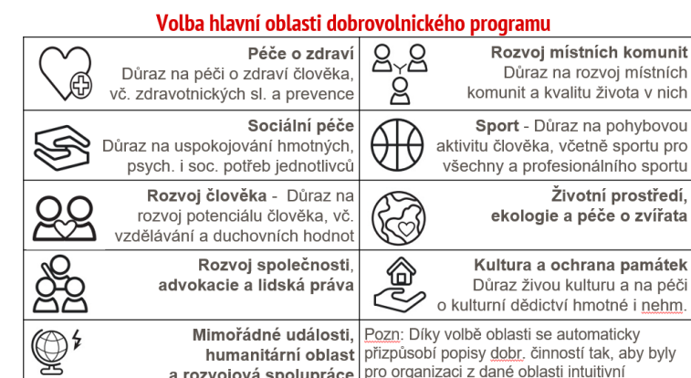
Obrázek č.2: Oblasti dobrovolnického programu v aplikaci DOBROMETR