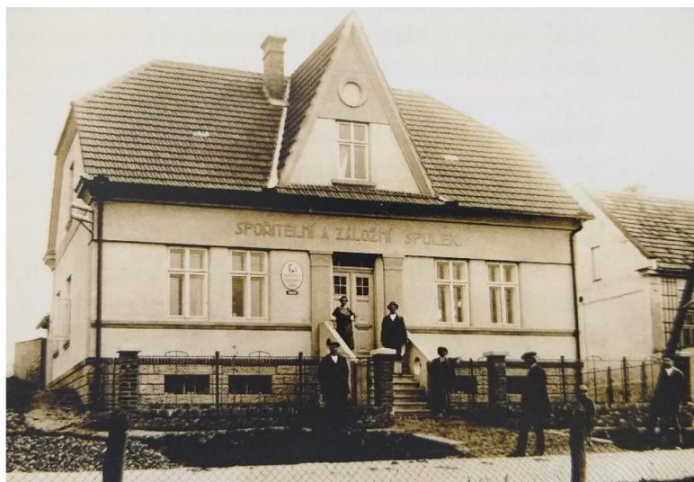
Obrázek 1 Budova pošty kolem roku 1925