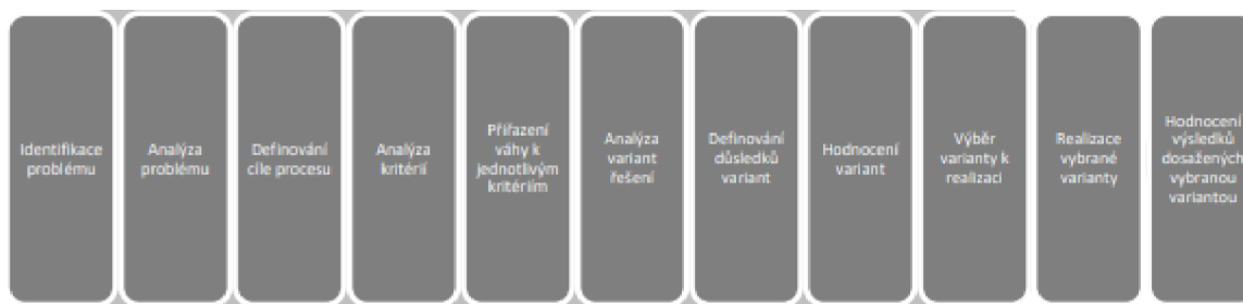
Obrázek 1: Postup procesu rozhodování (ŠTĚDRŮŇ, 2015.)

Bohumír Štědroň, pedagog a autor mnoha odborných publikací, definoval podrobně členění. Proces rozhodování podle tohoto autora, přestože vypadá dosti složitý a má 11 fází, obsahuje vše potřebné k jasnému určení cíle, pro zvolení vhodné metody a ke kontrole výsledků. Na obrázku 1 je posloupnost, která ukazuje po jednotlivých krocích postup rozhodovacího procesu. 5