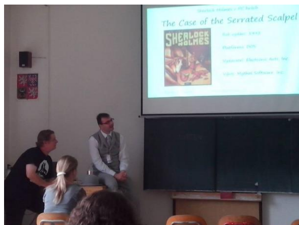
Obrázek 4 Whocon Brno 2014