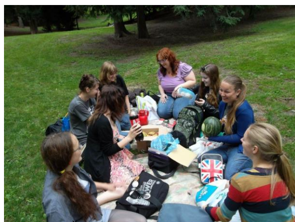
Obrázek 3 Šestý sraz Sherlockians v Praze (srpen 2012)