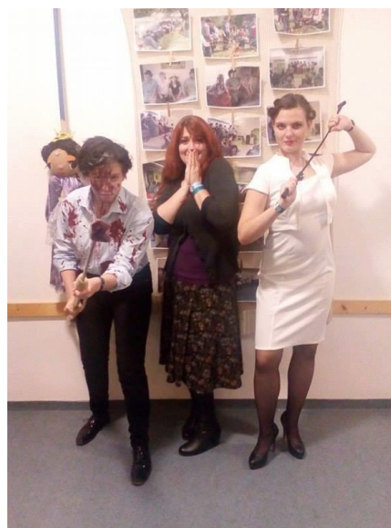
Obrázek 5 Autorkapráce s cosplayery na Whoconu 2014 a PragoFFestu 2016