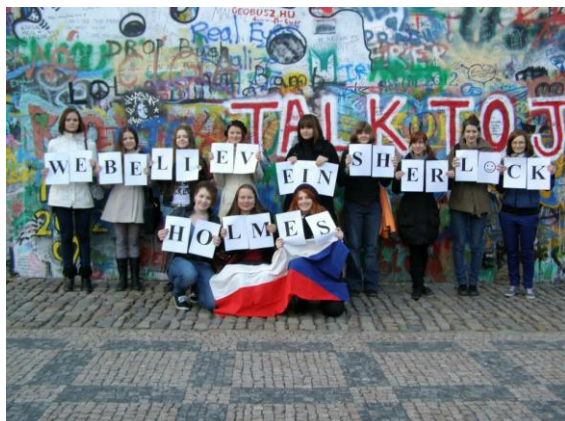
Obrázek 2 Druhý sraz Sherlockians v Praze (leden 2012)