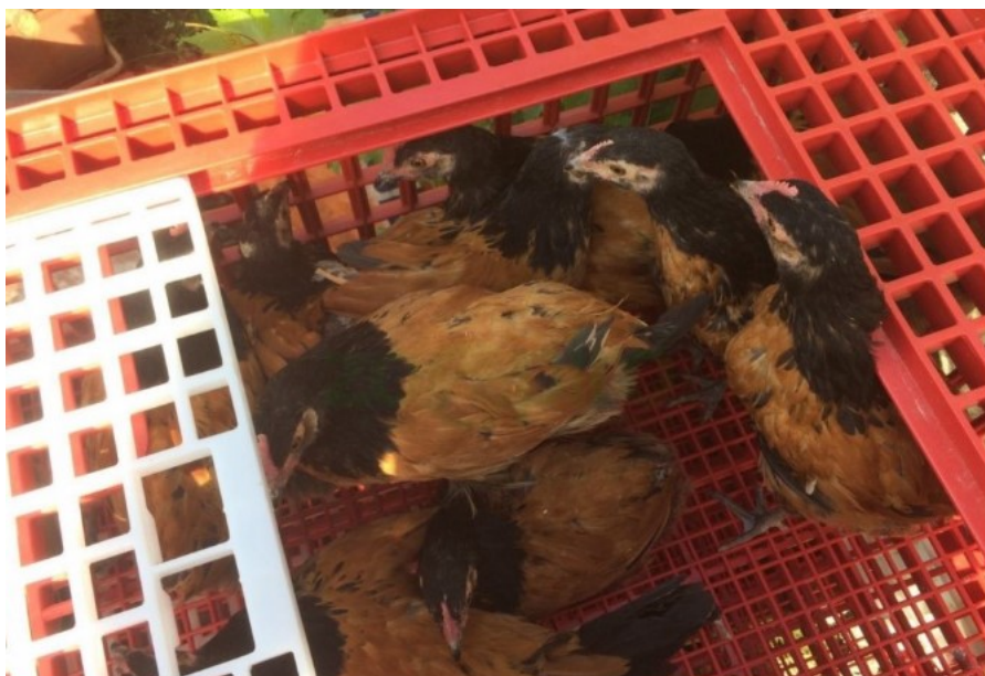
Obr. 4.1. Preprava hydiny