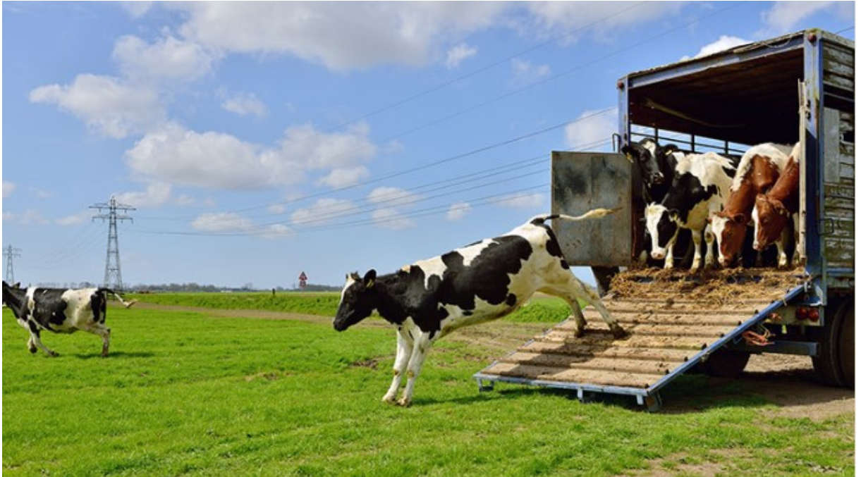
Obr. 1.2 Preprava hovädzieho dobytku

prepravovať až 12 hodín. Okrem toho EFSA poskytuje odporúčania na zmiernenie rizika súvisiaceho s vysokou hustotou chovu. Vo väčšine druhov tieto odporúčania ani neumožňujú, aby si zvieratá počas cesty pohodlne ľahli. Pokiaľ ide o konkrétny prípad neodstavených teliat, hoci existujú jasné dôkazy o tom, že pre tieto zvieratá existujú vyššie riziká, EFSA neodporúča zákaz, ale zaujíma slabší postoj a odporúča, aby sa mohli prepravovať po 4 týždňoch veku [10].