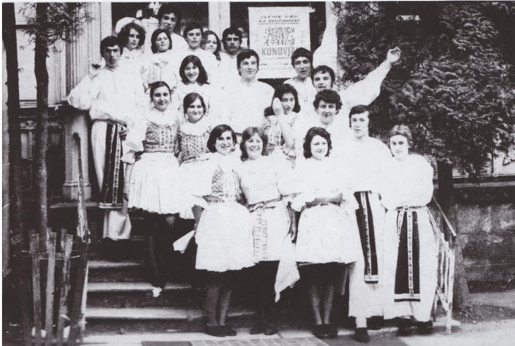
Příloha č. 1: FS Kunovjan v roce 1974.