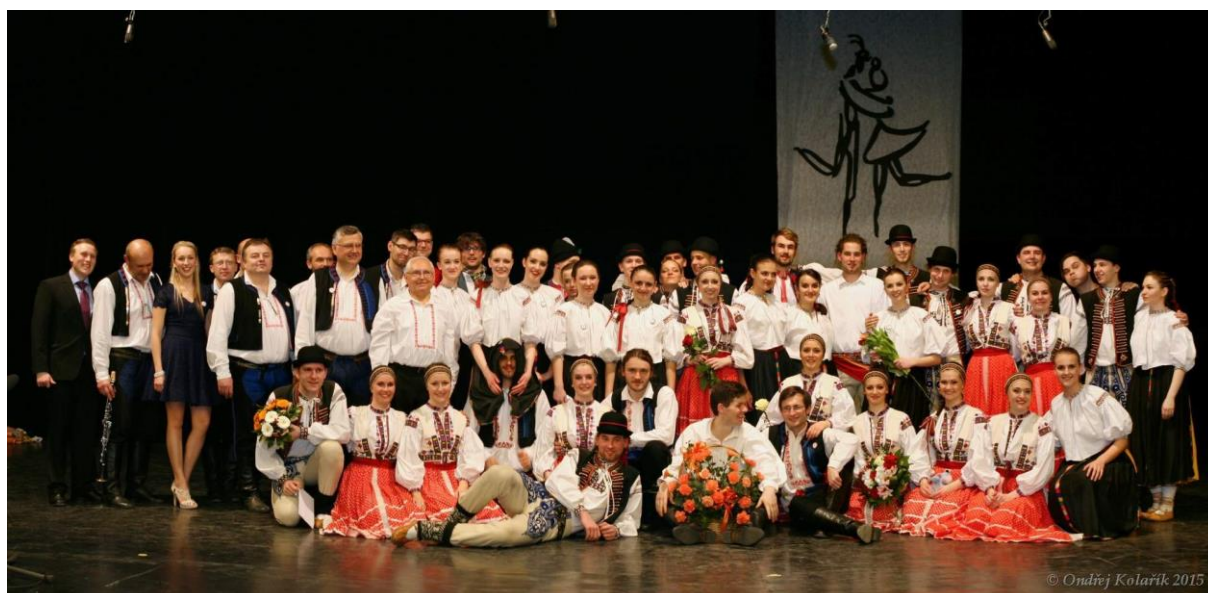
Příloha č. 6: FS a CM Kunovjan v roce 2015, premiéra Proměny a cesty.