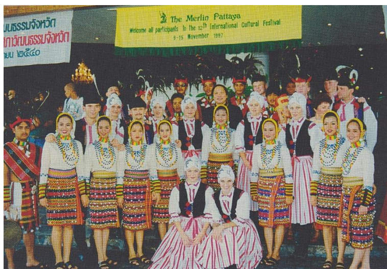
Příloha č. 3: FS Kunovjan v roce 1997, Thajsko.