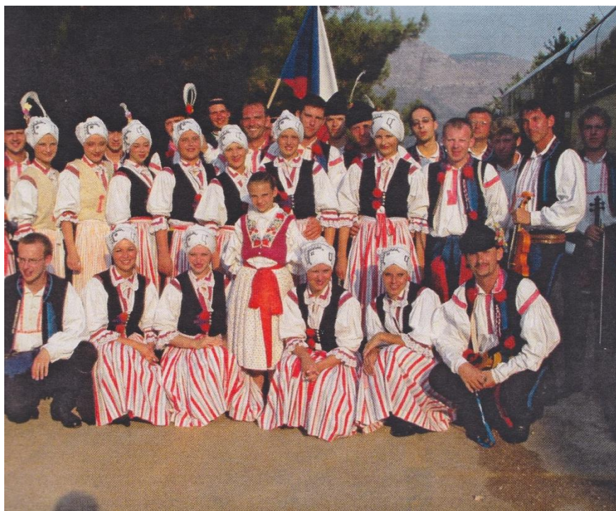
Příloha č. 5: FS Kunovjan v roce 2004, Itálie. Zdroj: kronika FS Kunovjan