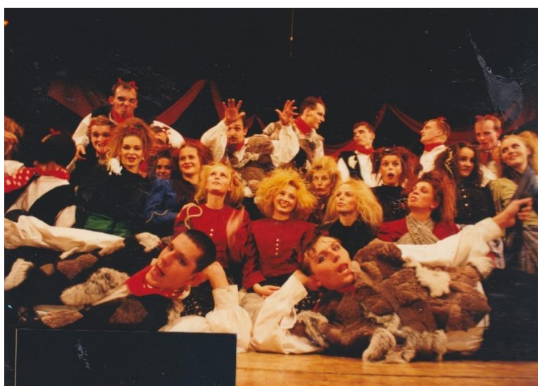
Příloha č. 4: FS Kunovjan v roce 2000, premiéra Podoby ohně.