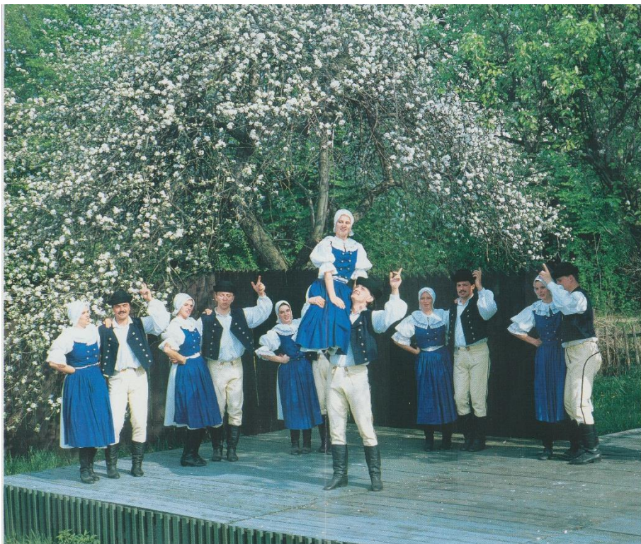
Příloha č. 2: FS Kunovjan v 90. letech.