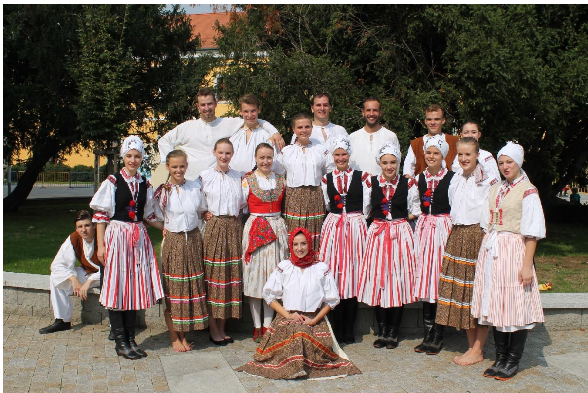
Příloha č. 7: FS Kunovjan v roce 2018.