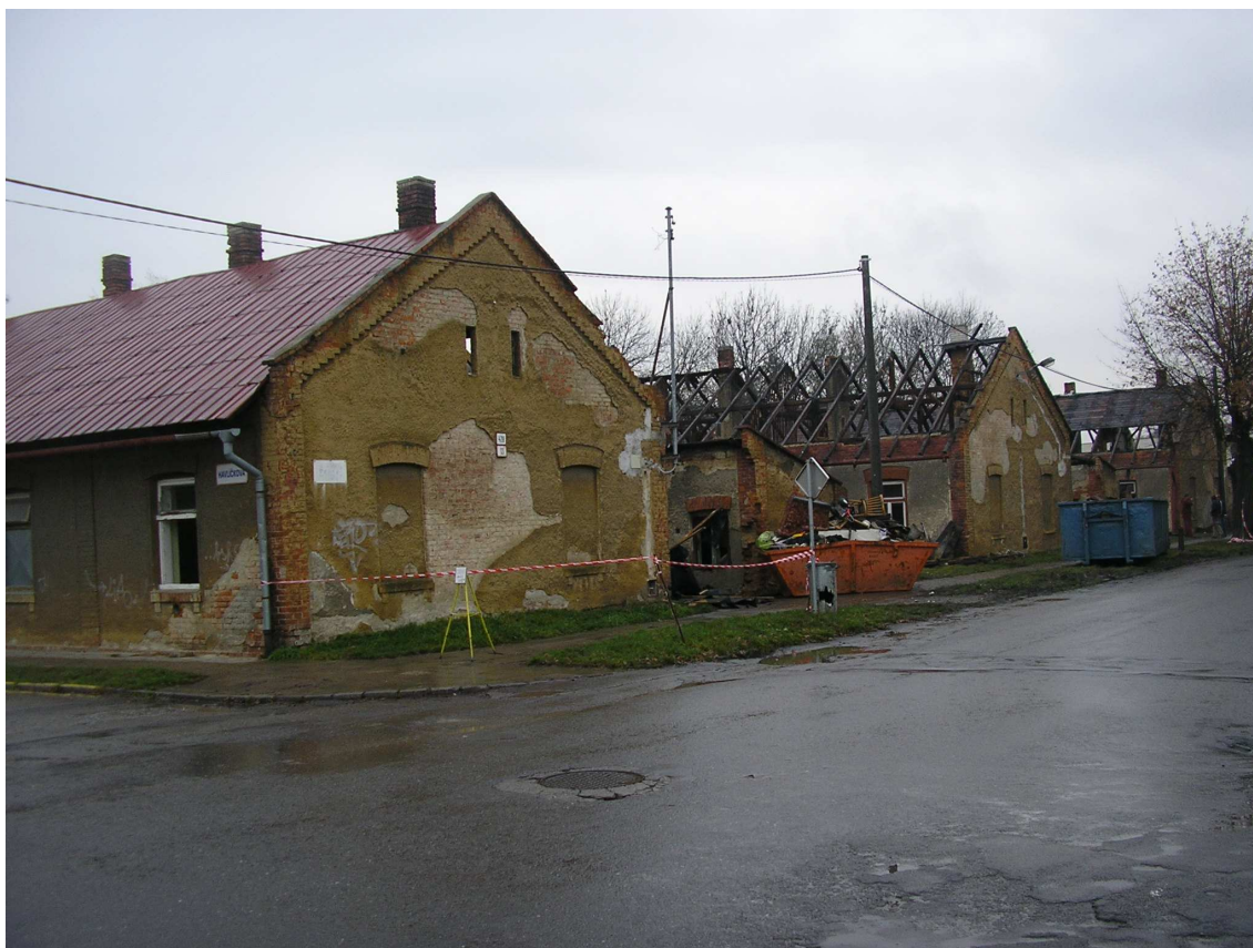
Příl. č. 2: Fotografie z bourání několika domů ze Školní ulice 77