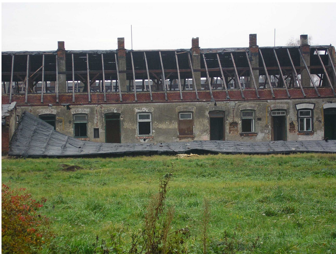
Příl. č. 3: Fotografie z bourání několika domů ze Školní ulice 78