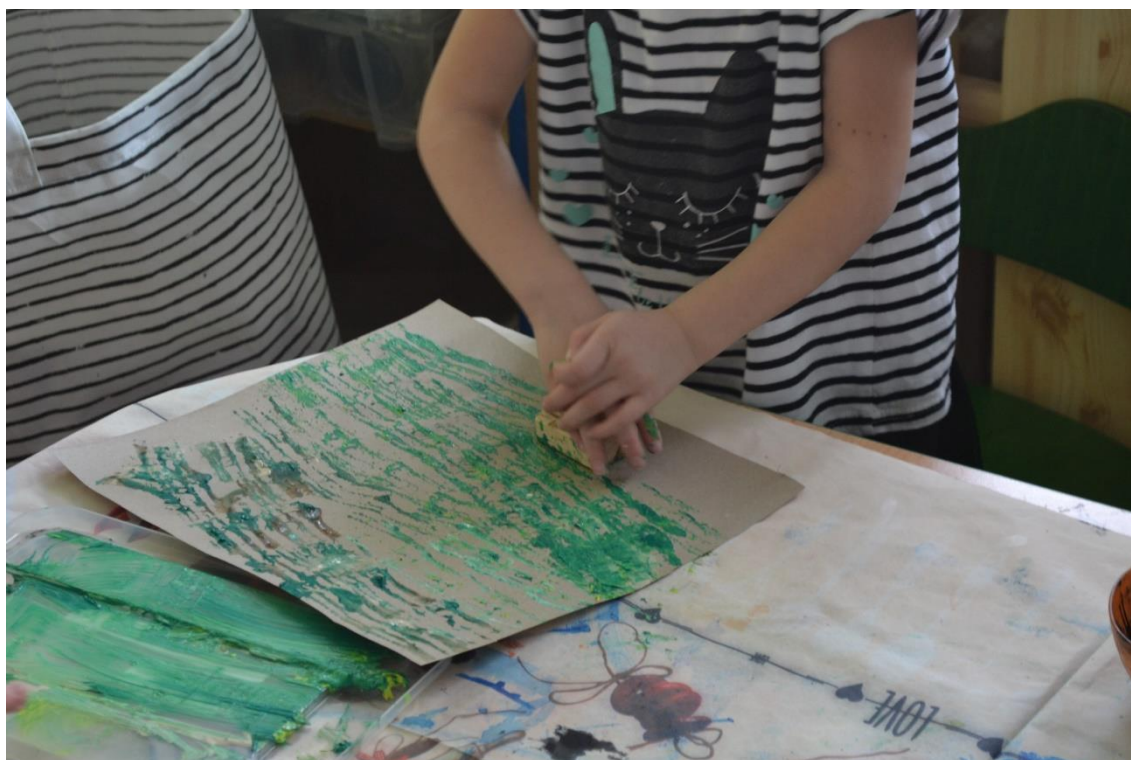
Obr. č. 14 Louka – otiskování matice vyrobené z razítka obmotaného přírodním provázkem

Reflexe: Cíle této aktivity se podařilo splnit. Děti kreativně přistupovaly k tisku razítkem, k mému překvapení začaly používat i táhlý pohyb a mnohonásobné vrstvení motivu. Vznikaly tím zajímavé efekty, nad kterými se děti upřímně radovaly. Získaly zkušenosti i s množstvím použité barvy, protože při nadměrném namočení razítka do barvy a jeho následném otištění na papír, vzniká barevná skvrna bez viditelné stopy razítka.