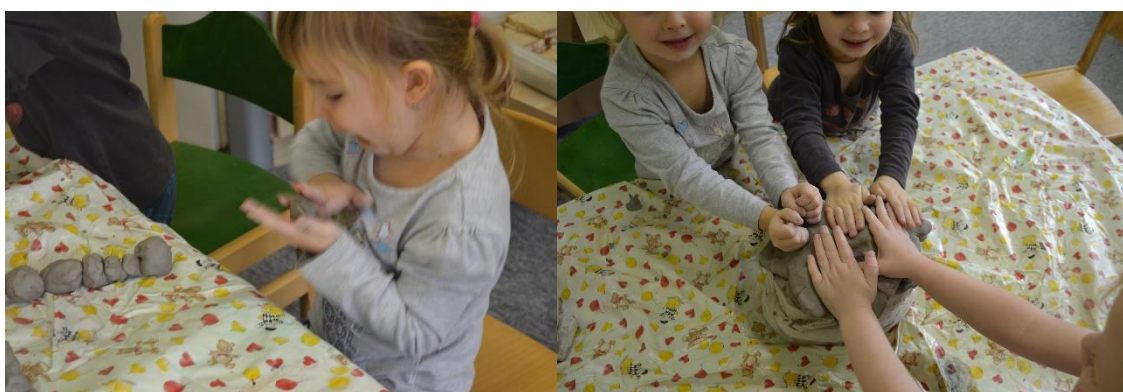
Obr. č. 18 a Obr. č. 19 Housenka – tvarování z keramické hlíny. Vytváření kuliček.