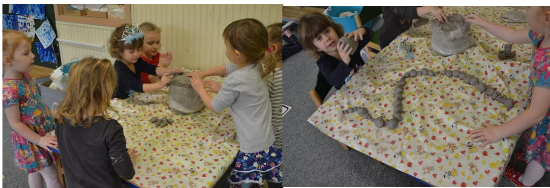
Obr. č. 16 a Obr. č. 17 Housenka – tvarování z keramické hlíny. Vytváření kuliček.