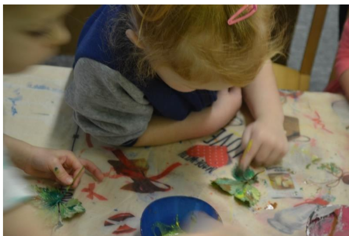
Obr. č. 4 Listy – otiskování listů, míchání barev

Reflexe: Cíle této aktivity se podařilo splnit. Jelikož některé děti musely čekat, protože opakovaně používaly k otiskování stejný list, doporučovala bych příště nasbírat větší počet listů stejného tvaru. Při otiskování jsem musela komunikovat s dětmi a nabádat je, aby nepoužívaly nadměrný přítlak, a tím nedocházelo k poškození listů.