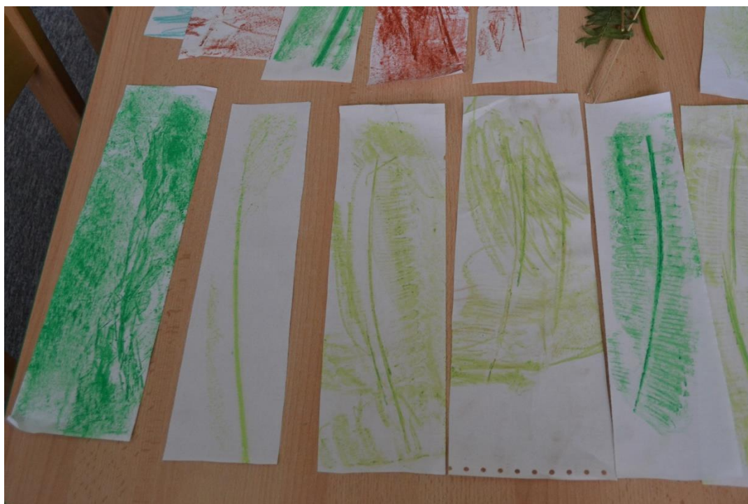
Obr. č. 11 Stébla – frotáž voskovými pastely

Reflexe: Cíle aktivity se podařilo naplnit pouze částečně. Pro některé děti bylo příliš obtížné uskutečnit ploché tahy po struktuře listu. Neustále uchopovaly pastel, jako by chtěly kreslit a tím vytvářely pouze lineární kompozice. List se jim nezobrazil, ztrácely motivaci pokračovat v práci. Patrná byla také nezralost koordinace pohybů rukou, ruce nespolupracovaly, musela jsem jim pomáhat přidržovat papír.