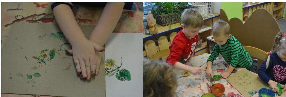
Obr. č. 5 a Obr. č. 6 Listy – otiskování listů, míchání barev