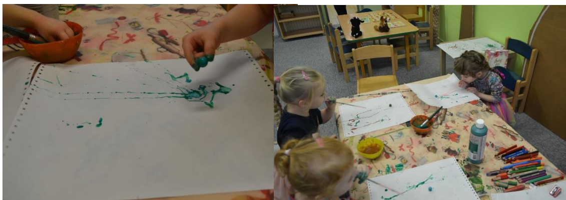
Obr. č. 9 a Obr. č. 10 Vysoká tráva – malba korálkem namočeným v barvě za použití foukání do brčka