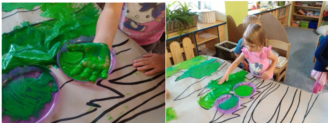
Obr. č. 2 a Obr. č. 3 Tráva – malba temperovými barvami pomocí rukou