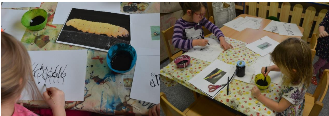
Obr. č. 20 a Obr. č. 21 Houseňák Pepík - studijní kresba tuší