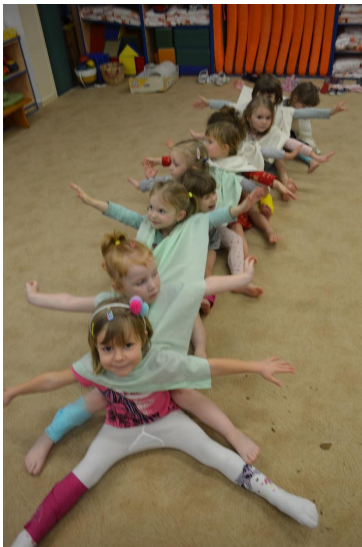
Obr. č. 23 Housenka v pohybu akce – pohybová aktivita, stylizace specifických rysů housenky na vlastním těle

Reflexe: Cíle aktivity byly splněny. Děti zaujalo netradiční ztvárnění housenčina těla. Aktivita pro ně byla velice přitažlivá, byly motivované. Nejtěžší částí se jeví uplatnění motorických dovedností při omotávání částí těla krepovým papírem. Zde byla nutná dopomoc učitelky. Nenechaly se ale odradit a zvládly dotáhnout aktivitu až ke konečnému výsledku, kterým byl obraz pohybující se housenky ve velkém nástěnném zrcadle.