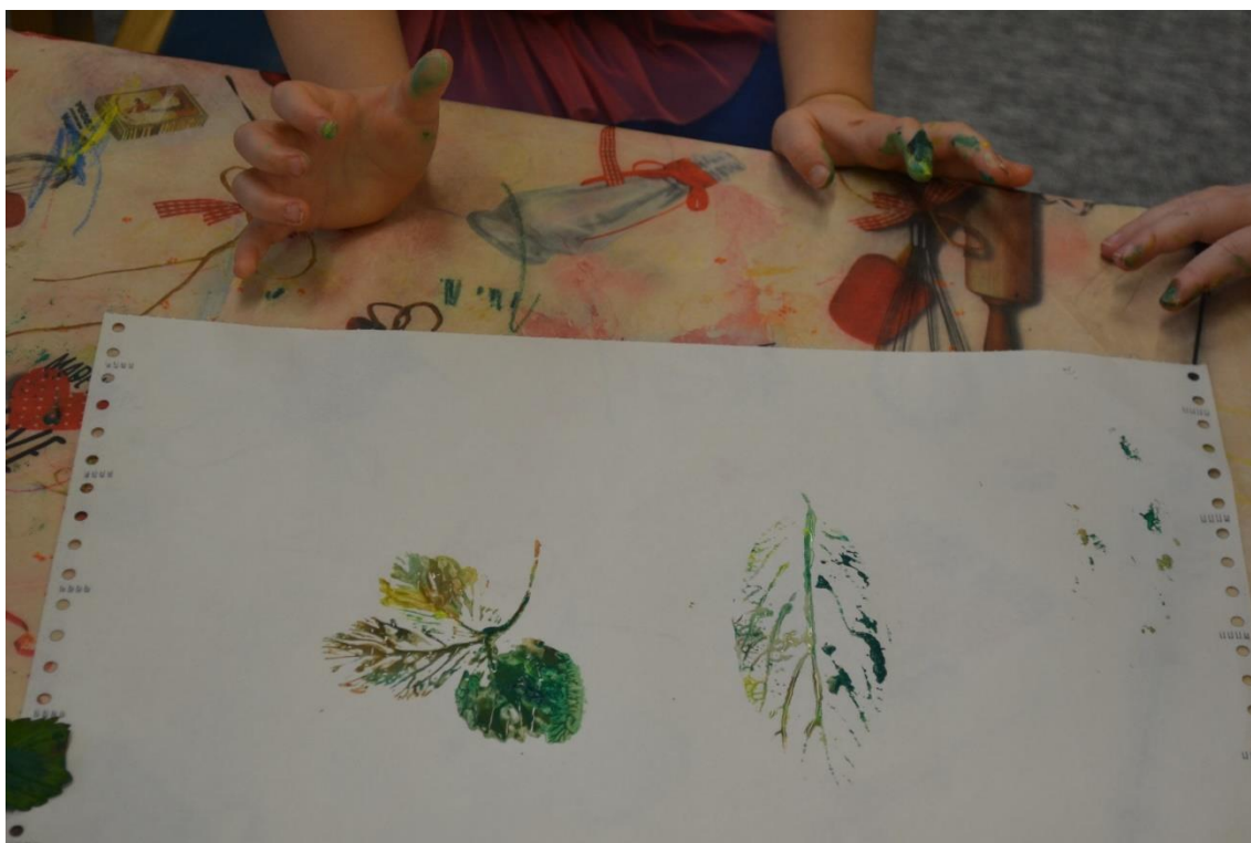
Obr. č. 7 Listy – otiskování listů, míchání barev