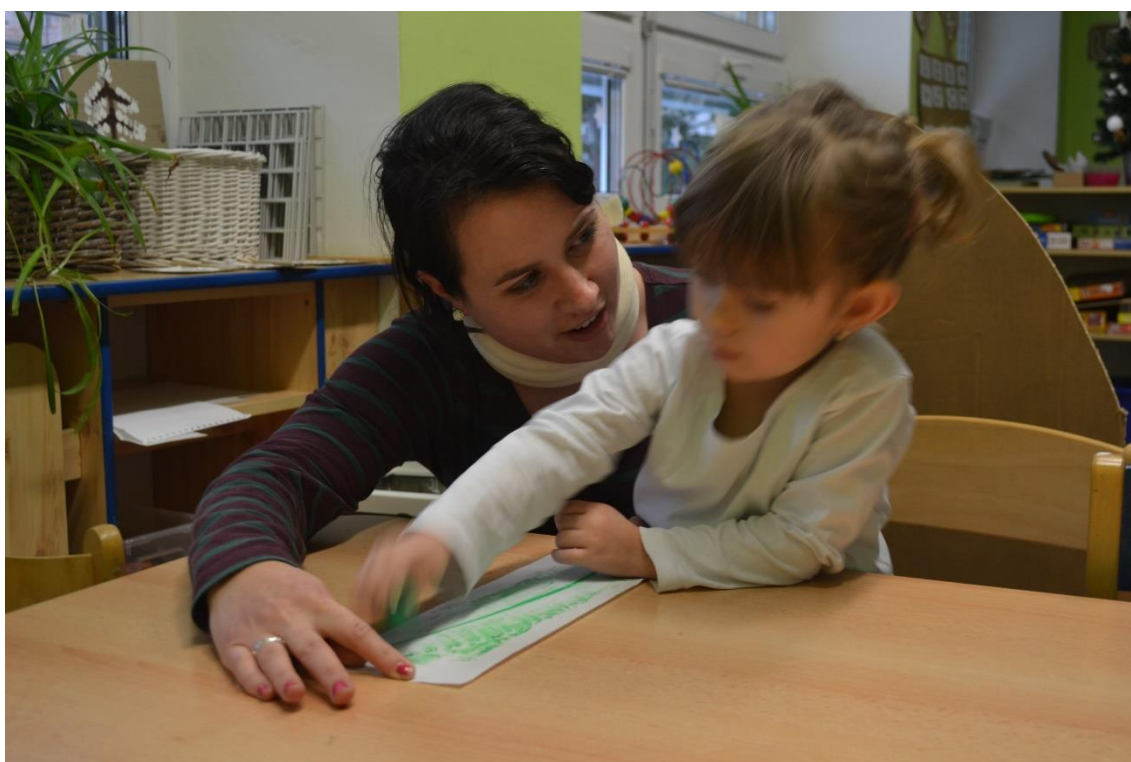
Obr. č. 13 Stébla – frotáž voskovými pastely