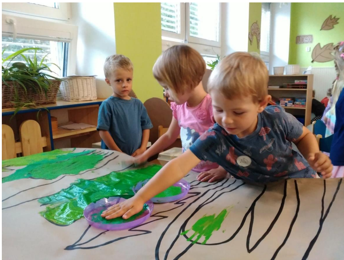
Obr. č. 1 Tráva – malba temperovými barvami pomocí rukou

Reflexe: Cíl aktivity se podařilo naplnit. Děti práce s barvou fascinovala, pracovaly celými dlaněmi, neměly zábrany nechat barvu protékat mezi prsty. Některým dětem činilo potíže naznačovat tahem růst rostliny, protože objevovací charakter aktivity je vedl spíše ke krouživým pohybům dlaní. Odpovídá to prvotní fázi vývoje dětského výtvarného projevu.