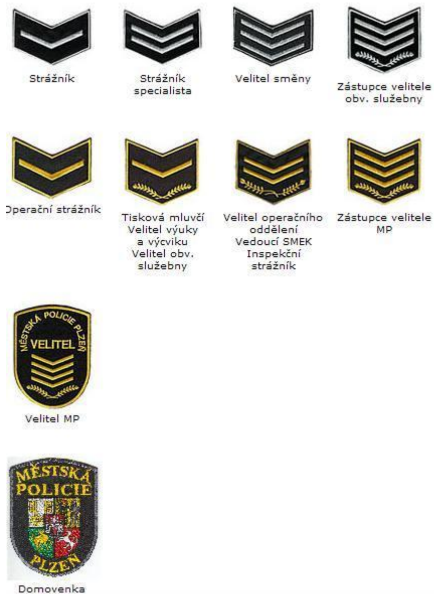
Obrázek 2