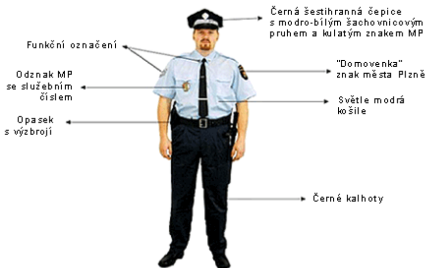
Obrázek 3