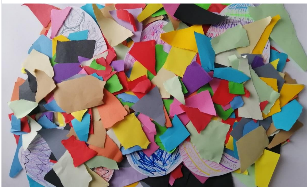
Obrázek č. 7: autoři: všichni