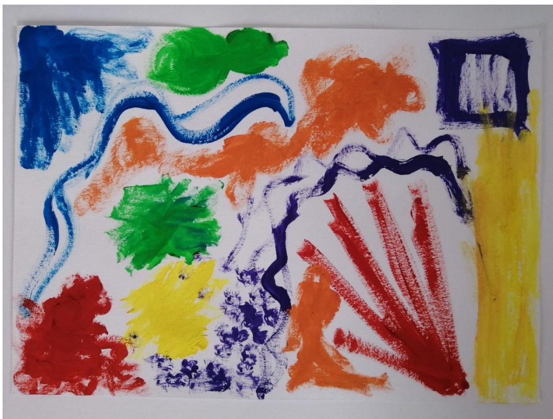
Obrázek č. 3: autoři: Tomáš a Martin