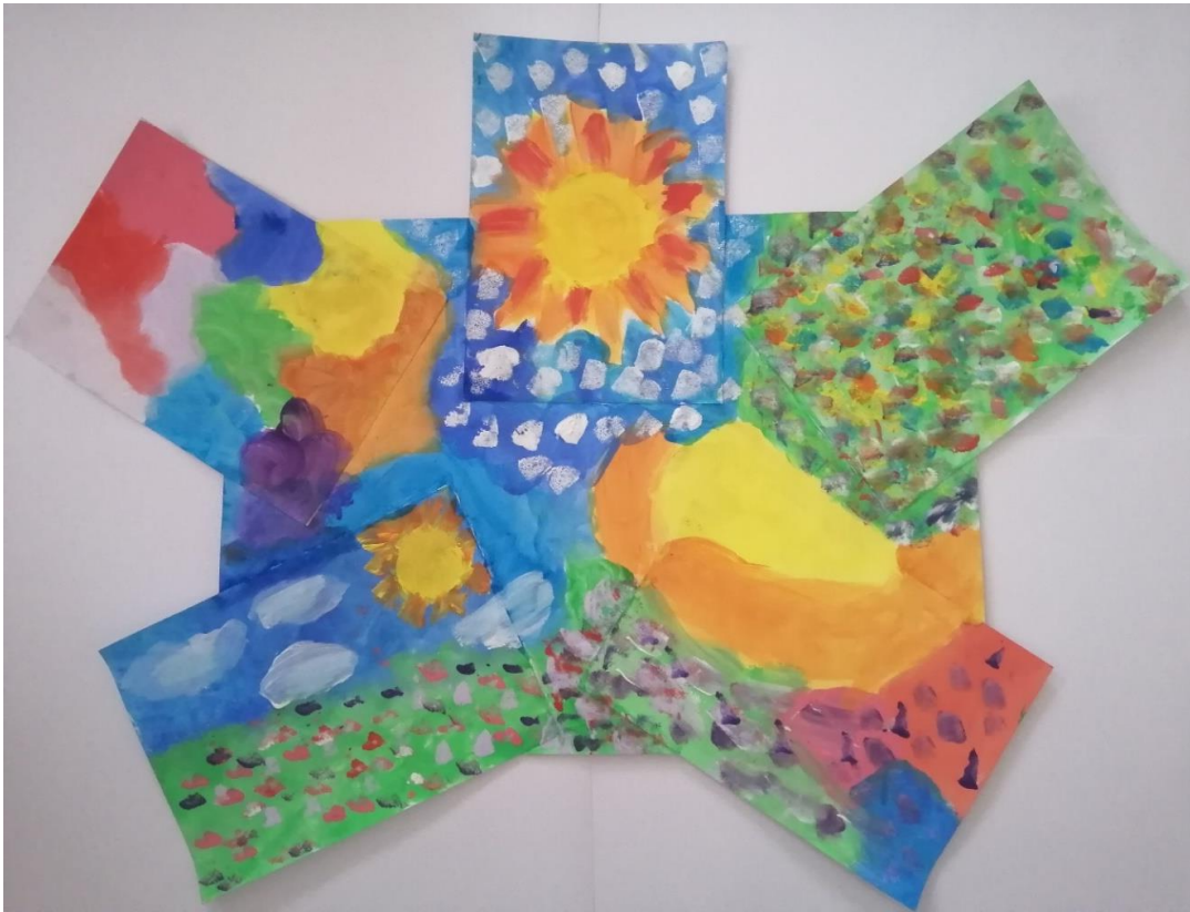
Obrázek č. 4: autoři: všichni