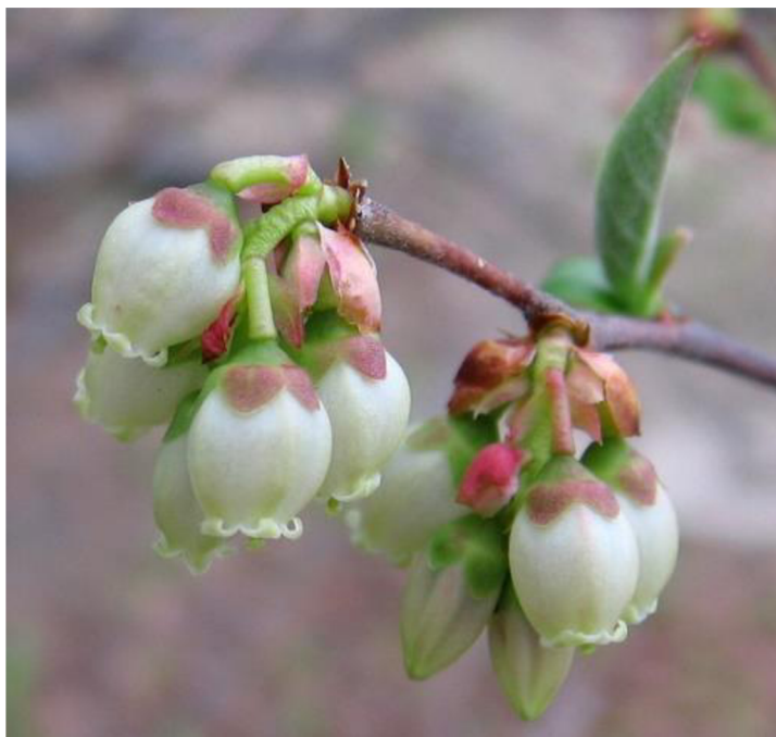
Obrázek 1: Květy brusnice chocholičnaté

cizosprašné, v případě potřeby však také samosprašné, to ale snižuje kvalitu jejich plodů (Paprštein et al. , 2009; Grulich, 2020). Na severní polokouli kvete v období od února do června (Nesom et Davis , 2002). V České republice obvykle v období od května do června (Anonymous4, 2017). Plodem jsou kulovité barvou obvykle sytě modré až modročerné bobule (Hejný et al. , 1990; Grulich, 2020). Tyto bobule jsou nazývány borůvky. Velikost bobulí je v průměru 0,4–1,2 cm. Dužina je světle zelená, nebarví a obsahuje spoustu drobných semen (Nesom, 2001; Grulich, 2020). Keř plodí v podmínkách České republiky obvykle od konce června až do září (popř. října) (Paprštein et al. , 2009; Anonymous4, 2017). Plody nedozrávají najednou, ale v období několika týdnů (Anonymous4, 2017; Anonymous5). Rostlina začíná kvést a plodit už v prvním roce života (Retamales et Hancock , 2012; Anonymous5).