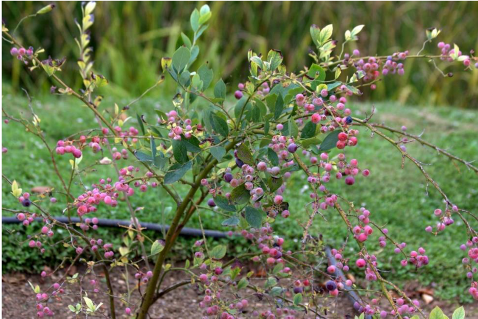
Obrázek 3: Brusnice prutovitá kultivar 'Maru'