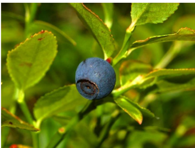
Obrázek 4: Detail plodu brusnice borůvky

Brusnice borůvka ( V. myrtillus ) se vyskytuje v Evropě, Asii a v západní části Severní Ameriky. V České republice se vyskytuje vzácně v teplých oblastech, poměrně hojně ve středních polohách a hojně na horách. Je to opadavý keř, dorůstající maximálně 0,6 m. Květy vyrůstají z paždí listů a mají bílou nebo nazelenalou barvu s narůžovělým nádechem. Plodem jsou kulovité bobule, které jsou nejčastěji modročerné, výjimečně bělavé nebo červené (v době zralosti). Jsou velmi malé, o velikost v průměru 0,5–0,7 mm (jen velmi vzácně se dají nalézt bobule o velikosti až 1 cm) plody brusnice borůvky jsou obecně v průměru až 2x menší než plody brusnice chocholičnaté. Dužina borůvek je modrofialová a barví (Vander Kloet 1988; Hejný et al. , 1990; Hoskovec 2007).