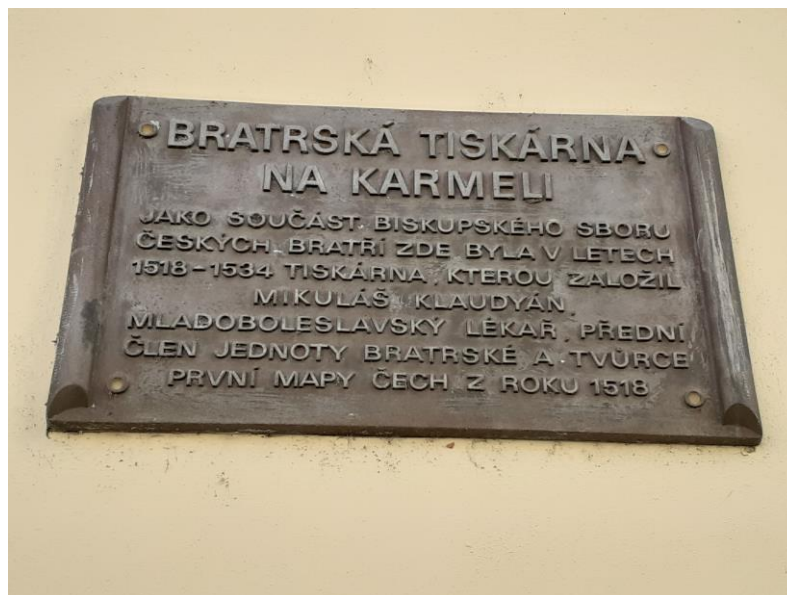
Obrázek 8 - Pamětní deska na budově bratrské tiskárny

Knihtisk – šíření vzdělání. Právě tento vynález zapříčinil rychlé pronikání gramotnosti mezi veřejnost, v případě mladoboleslavské tiskárny, mezi českou společností. Knihtisk tak prostřednictvím vydávaných publikací šel ruku v ruce se vzděláním.