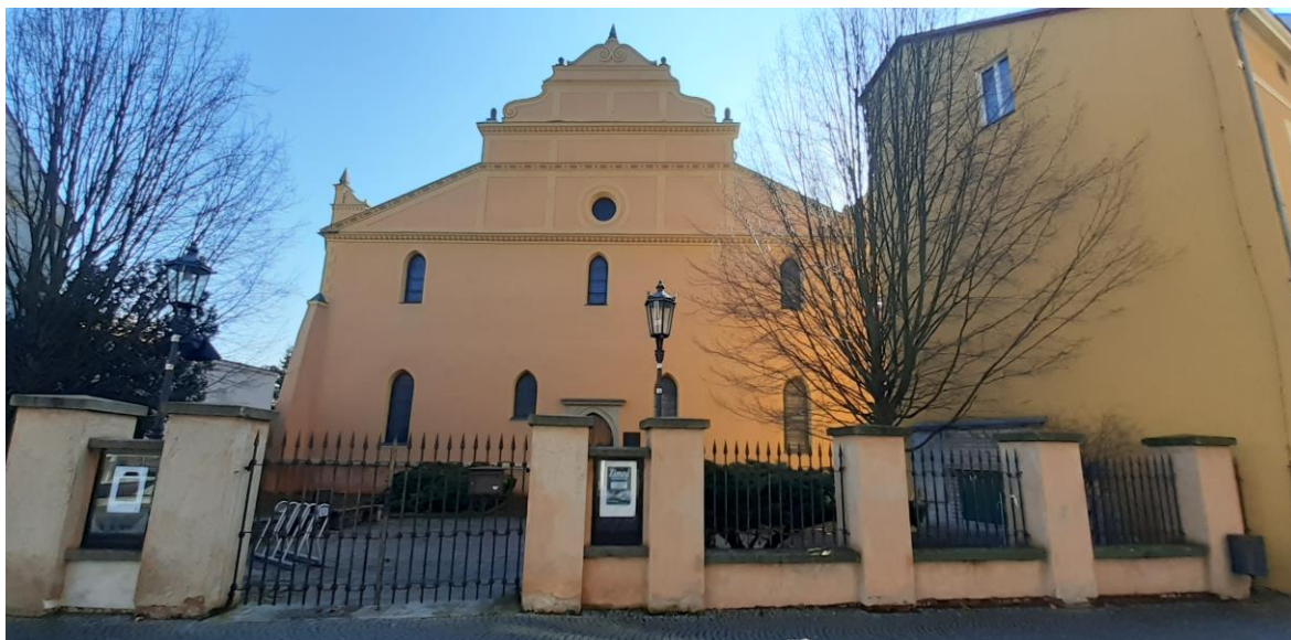
Obrázek 3 - Sbor českých bratří

těchto rozlehlých prostor se neodklání od jejího původního účelu. Oltář zde nenajdeme. Klasická výzdoba duchovních míst, jako jsou kreslené výjevy z bible, obrazy, sochy, chybí úplně. Nenalezneme zde ani žádné kreslené výjevy, obrazy ani sochy. Stejně tak, jak vidíme a vnímáme prostory dnes, tak byly vnímány před přibližně 470 lety. Celkový dojem je tedy velmi strohý, nikterak honosný. I přesto je však možné uvést, že z prostor nečiší prázdnota, spíše návštěvníka nadchne jeho jednoduchost a především rozloha. To však byl záměr Jednoty. Poukázat na jejich vnímání života založeném na přísné morálce, práci a učení, ale i na život bez majetku, který má člověka v jeho práci a vzdělání povznést. Sbor českých bratří v jeho zadní části oklopuje volný prostor (dnes park), kde měl být původně zřízen bratrský hřbitov. Nikdy se tomu tak ale nestalo kvůli jeho podloží s nadbytkem spodních vod.