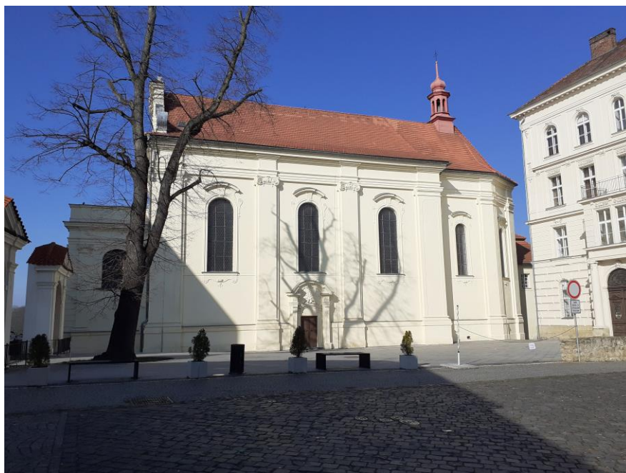
Obrázek 1 - Kostel sv. Bonaventury

Tato část Nového města zaznamenala velký rozmach. Členové Jednoty z řad obyvatel Mladoboleslavska i přívrženci z řad bratrské šlechty skupují pozemky a domy v okolí tohoto komplexu (např. Václav Budovec z Budova, popravený s českými pány a rytíři na Staroměstském náměstí v Praze po bitvě na Bílé hoře). Nové město, uzavřené pouze závorami (šraňkami), se tak rozrůstá a zaznamenává tak značný kulturní a hospodářský rozmach v tehdy již průmyslovém městě. Oblast Karmel a její členy však brzy doženu politické machinace a mandáty proti jakémukoliv jinému církevnímu uskupení než katolickému. Činnost Jednoty, jak je popsáno v kapitole Jednota bratrská v Mladé Boleslavi, je několikrát omezena a s ním uzavřeny i bratrské prostory v Novém městě. Konečným zúčtováním s Jednotou a jejím komplexem přichází po třicetileté válce. Čeští stavové jsou poraženi, sbor z Mladé Boleslavi vyhnán a prostory zapečetěny. Odchod Bratří do exilu a následná rekatolizace ukončuje ve všech oblastech fungující oblast bratrského Říma.