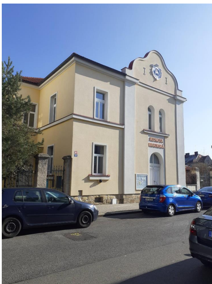
Obrázek 9 - Budova obnovené Jednoty bratrské v Mladé Boleslavi