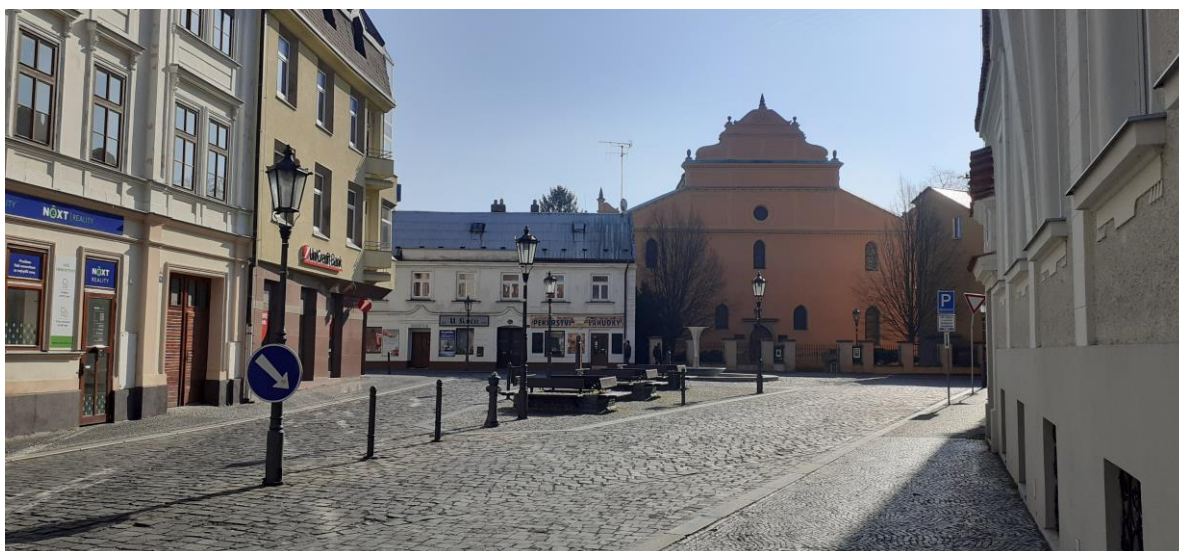
Obrázek 6 - Českobratrské náměstí se Sborem českých bratří