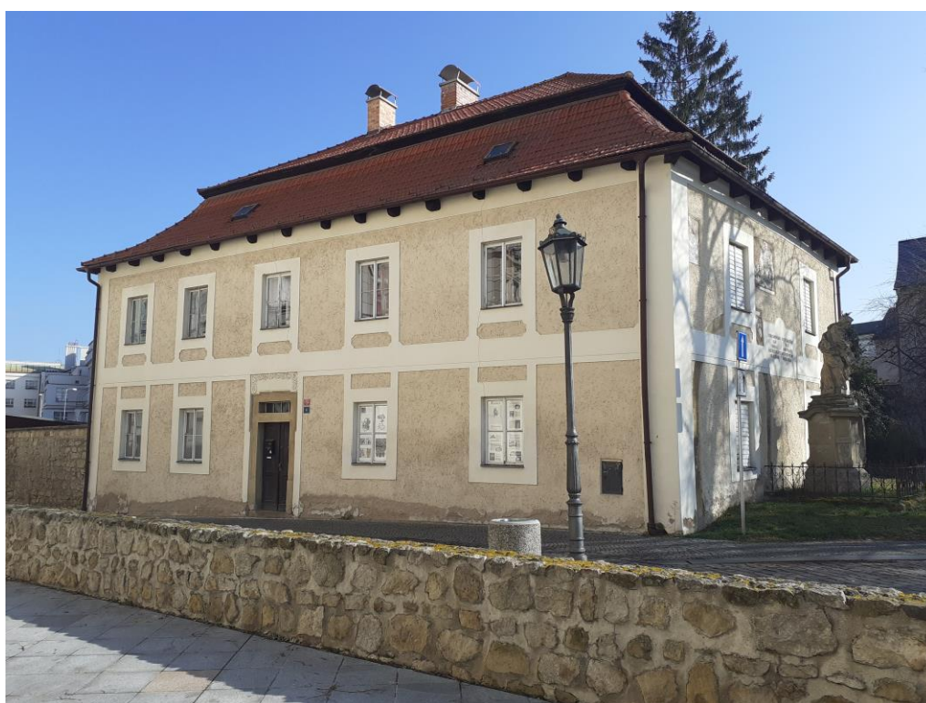
Obrázek 5 - Budova bratrské školy

Unikátem byla spolupráce českobratrské školy se zahraničními protestantskými univerzitami. Právě tento kontakt s cizím prostředím, novými vyučovacími prostředky, a především stykem se zahraničními vzdělanci vedl k pozvednutí kvality vzdělanosti v Mladé Boleslavi i českých zemích a možnosti dostat českou školu a své žáky do povědomí zahraničních učenců. Studenti tak pokračovali na univerzitách v Heiderbergu, Ženevě, Witenberku a Basileji, nikoliv na akademiích pražských. 97