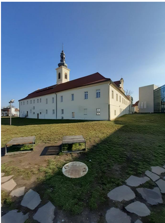
Obrázek 2 - Komplex u kostela sv. Bonaventury

Vysokou školou, které se stává novým centrem vzdělávacím i kulturním kvůli nespočtu pořádaným akcím v prostorách moderního areálu. Ke vzdělávacímu centru, a tedy do vlastnictví automobilky Škoda Auto, spadá i klášterní komplex a kostel sv. Bonaventury, který společně se Sborem českých bratří slouží k civilním svatbám, výstavám i módním přehlídkám. Rozhodnutí vrátit Karmeli jeho kdysi zašlou slávu vedlo i k další senzaci. Při provádění oprav v místě bývalého minoritského kláštera byly nalezeny dvě truhly, které historici označují jako poklad století. Jedná se převážně o písemnosti a korespondenci z dob působení biskupa Matouše Konečného v Mladé Boleslavi. 91 Celá oblast tak ve 21. století opět ožívá, vrací se jí její důležitost a její každodenní ruch, který zajišťují především studenti, profesori a zaměstnanci Vysoké školy a automobilky Škoda Auto.