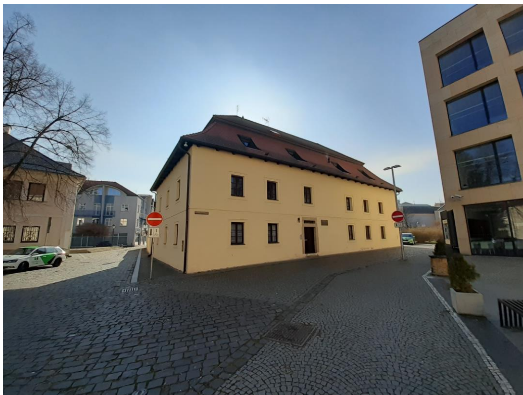
Obrázek 4 - Budova bratrské tiskárny

Předchozí kapitoly připomínají Mladou Boleslav jako centrum kultury a vzdělanosti. Na této skutečnosti má největší vliv právě Jednota bratrská s jejím školským vzděláváním a využíváním knihtisku, který byl v jejich době naprostým unikátem. Budova bratrské tiskárny se dochovala až do dnešních dní v domě číslo popisné 77/III v areálu na Karmeli a připomíná tak působení lékaře, tiskaře a vydavatele první tištěné mapy Čech Mikuláše Kladiána v Mladé Boleslavi. Učení, které získal v Norimberku, přenesl v roce 1518 95 do centra Jednoty bratrské a přispěl tak k šíření jejich spisů a tištění jejich náboženských, historických i lékařských publikací pomocí dřevěného vřetenového lisu.