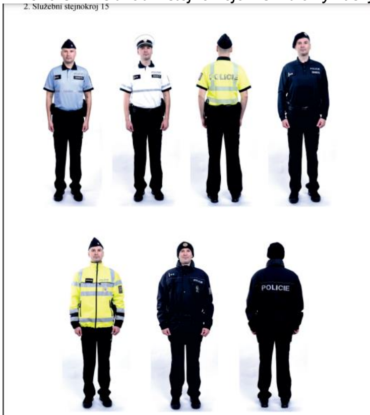
OBRÁZEK 4 - SLUŽEBNÍ STEJNOKROJ 15