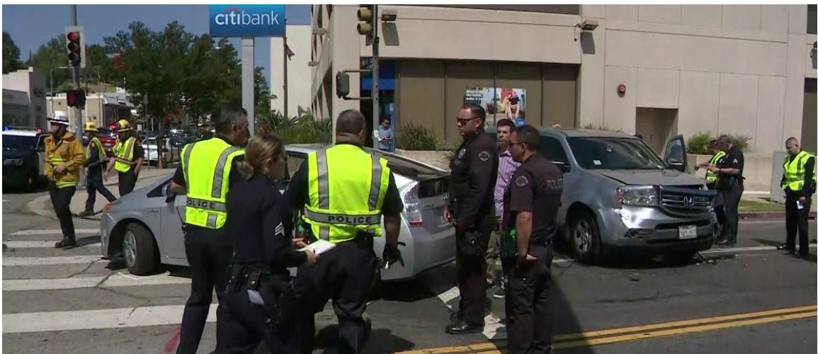
OBRÁZEK 3 - LAPD POLICISTÉ V REFLEXNÍCH VESTÁCH PŘI NEHODĚ