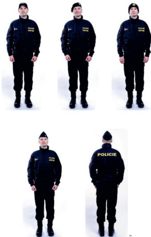
OBRÁZEK 5 - SLUŽEBNĚ – PRACOVNÍ STEJNOKROJ 92