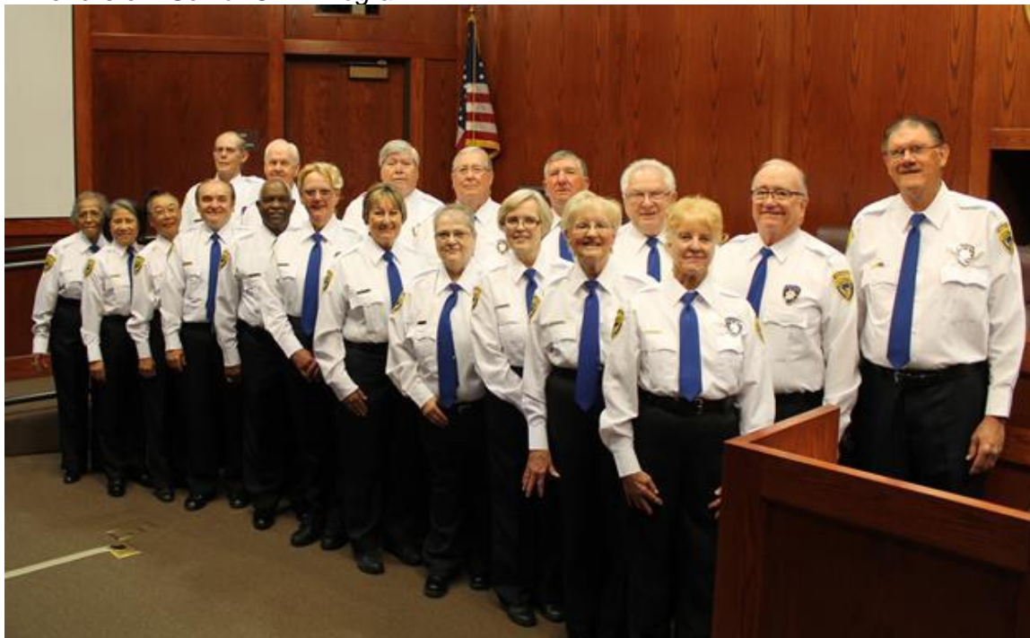
OBRÁZEK 6 - SENIOŘI V RÁMCI SENIOR CHP PROGRAMU