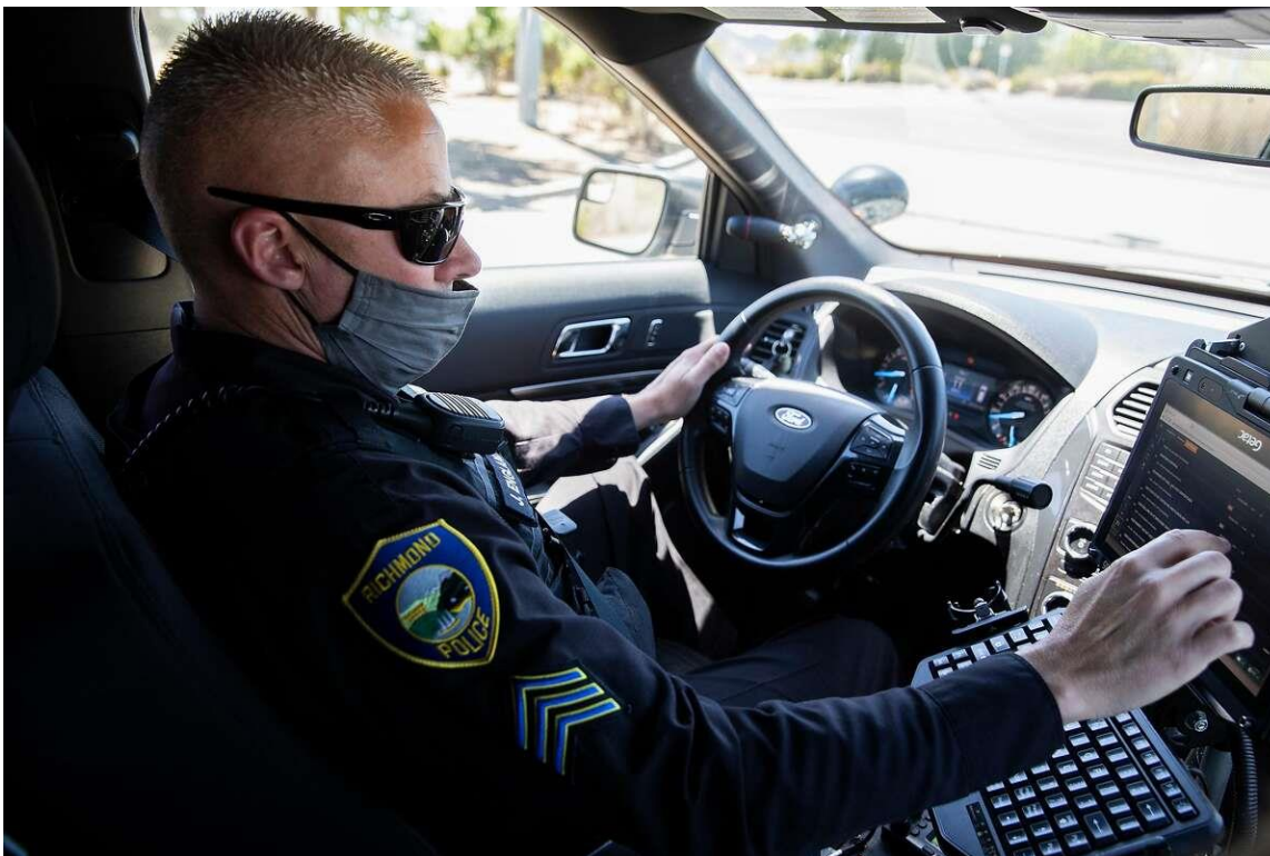
OBRÁZEK 8 - POLICISTA V AUTĚ RICHMONDSKÉHO POLICEJNÍHO SBORU