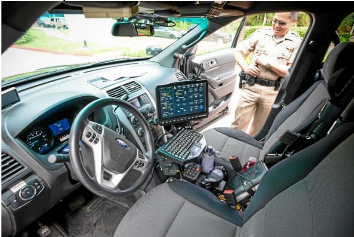
OBRÁZEK 7 - VOZIDLO CHP (UVNITŘ)