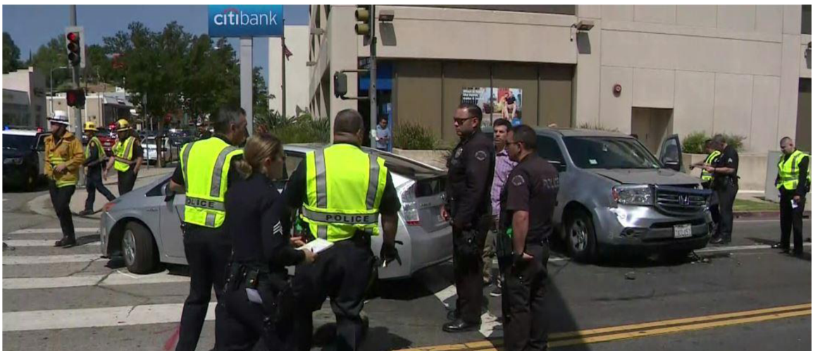
OBRÁZEK 3 - LAPD POLICISTÉ V REFLEXNÍCH VESTÁCH PŘI NEHODĚ