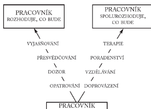
Obrázek 6 - Aktivity v rámci kontroly a pomáhání (Úlehla, 2004, s. 33)

Třetí model – založený na formulaci řeckého filozofa Prótagora, je preferován, jestliže se mluví o skutečném pomáhání v kontextu systemického přístupu. Když už se pomáhající profesionál rozhodne pomáhat, mělo by jít skutečně o pomoc, nikoliv o skrytou kontrolu. Zneužití pomoci má jedinou, zato velmi často opakovanou podobu: pod záminkou pomáhání je vykonávána kontrola... O zneužití kontroly můžeme mluvit všude tam, kde pracovník pod záminkou prospěchu klienta a péče o něj prosazuje své cíle. Když cíl pracovníka, i ten sebeušlechtlejší, má přednost před přáním klienta, pak plně platí, že cesta do pekel je dlážděna dobrými úmysly (Úlehla, 2004, s. 40).