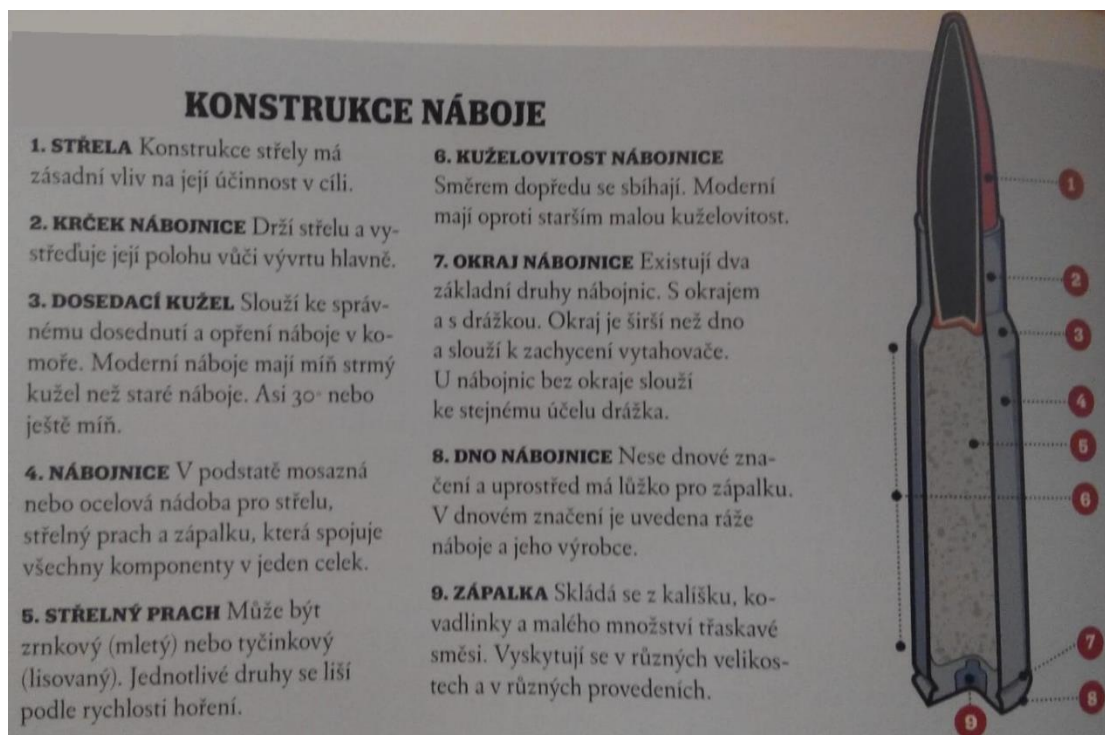
Obr. č. 2 Průřez náboje pro puškové zbraně (Petzal & Bourjaily, 2013)