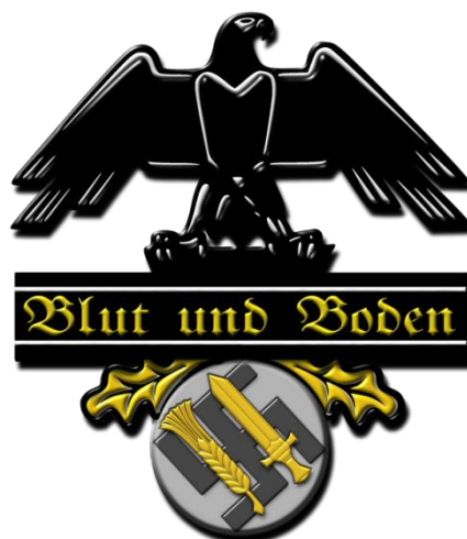
Obr. č. 9 Oficiální znak Blut und Boden

Zkráceně řečeno, program měl přinést novou a silnou rasu rolníků, kteří vyprodukují dostatek potravin pro případnou krizi a Německo tak opět nespadne k hladomoru jako po Velké válce. Mladí lidé byli využíváni k pracím a Wehrmacht mohl vést rozsáhlé válečné operace s dostatečnou lidskou silou. Posledním faktem je i krajina, která měla být v Rusku srovnána se zemí a znovuvybudována se zemědělskými dvorci, tvořící jakýsi středověký hrad sloužící jako opevnění proti nepříteli, zmiňují se Corni & Gies (1994).