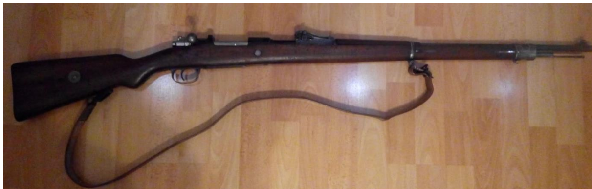
Obr. č. 4 Gew.98 (Svoboda, 2019)

Zbraň jsem nabíjel náboji jednotlivě, i když byl při ruce nábojový pásek. Pět nábojů jsem hladce vložil do nábojové schránky a následně již zmíněným závěrem uvedl do komory první náboj. Při líčení zbraně bylo příjemné její držení a ohnisko mušky se nacházelo přiměřeně ke vzdálenosti mého oka. Výstřely jsem byl velmi příjemně překvapen přesností pušky a kultivovaným chování při zpětném rázu.