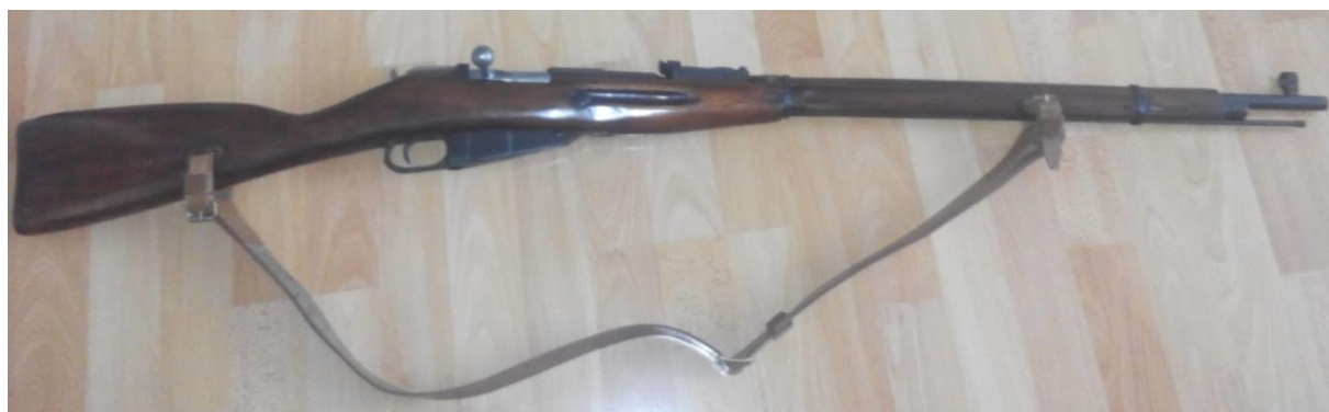
Obr. č. 5 Mosin-Nagant (Svoboda, 2019)

Zbraň jsem nabíjel jednotlivě bez pásku a musel jsem klást důraz na správné vkládání nábojů, aby se nezachytily okrajem nábojnic jedna o sebe. Při pokračující střelbě a bližším zkoumání nábojového pásku, který jsem měl při ruce a následně jej použil pro přebíjení zbraně, jsem si všiml, že je velice jednoduché zaměnit směr řazení nábojnic vkládaných do zbraně za pomoci tohoto pásku, ve kterém byly nábojnice řazené. Tím pádem je větší pravděpodobnost výskytu závady. Zbraň při střelbě byla nepříjemná, cítil jsem nepříjemnou bolest v rameni kvůli okované botce na pažbě, která je spíše vhodná pro úspěšné bití vojáků nepřítele, za předpokladu, že není nasazen efektivnější bodák a ve zbrani se nenachází náboje pro ještě efektivnější vyřazení nepřítele střelbou. Je pravdou, že svůj podíl na vystřílení míru v Evropě proti Němcům má, ale upřímně do bitvy a ani pro lovecké účely bych si ji ne zvolil.