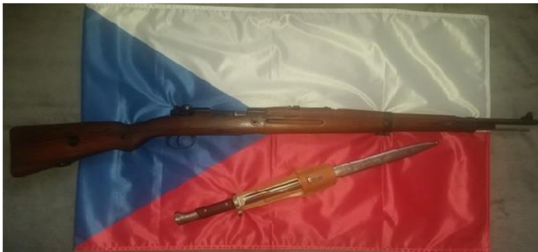
Obr. č. 6 CZ vz. 24 s bodákem (Kořánek, 2019)

Zbraň je lehká, závěr funguje bez vůlí a celkově se se zbraní velmi jemně a snadno manipuluje. Zbraň jsem opět nabíjel jednotlivě, bez žádných problémů. Zamíření na terč proběhlo velmi rychle kvůli krátké délce zbraně. Zpětný ráz byl větší než u zbraně Geweher 98, ale příjemnější než u Mosina. Při přiblížení k terči jsem zjistil, že všech pět nábojů bylo ve středu terče, tím pádem vyhodnocuji tuto zbraň jako nejlepší z používaných a nejdostupnějších pro myslivecké účely v období druhé světové války. Nejdostupnějších i z toho důvodu, že po demobilizaci v roce 1938 hodně lidí odmítalo tyto střelné zbraně odevzdat.