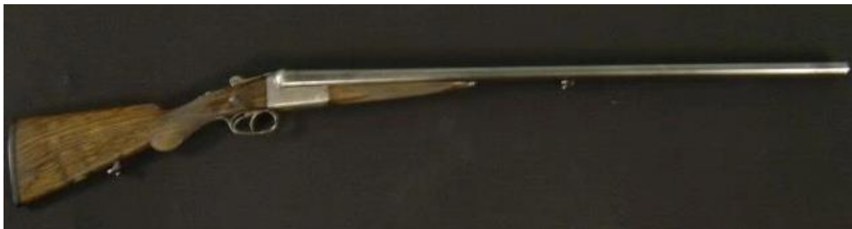
Obr. č. 7 Broková zbraň Hammerless (doublegunshop.com, 2019)

Zbraň jsem musel zlomit v bodu mezi hlavněmi a pažbou (baskulí), abych mohl provést nabití. Brokové náboje jsem vkládal přímo do dvou nábojových komor a následně jsem uzavřel zbraň pohybem hlavňového svazku vzhůru. Brokovnice je těžší, než vypadá, ale při výstřelech se tato skutečnost nejeví obtížně, protože cíl dokonale smrtelně pokryje broky. Bylo příjemné, že náboje na sebe navazují mačkáním dvou spouští při výstřelu a nemusel jsem manipulovat se závěrem. Zbraň vyhodnocuji jako skvělou pro lovecké účely, konkrétně ptactva.