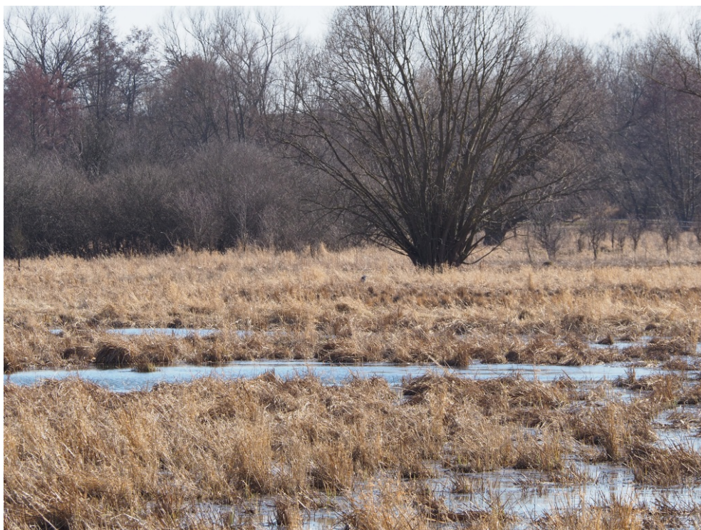
březen 2022 – močály a strže