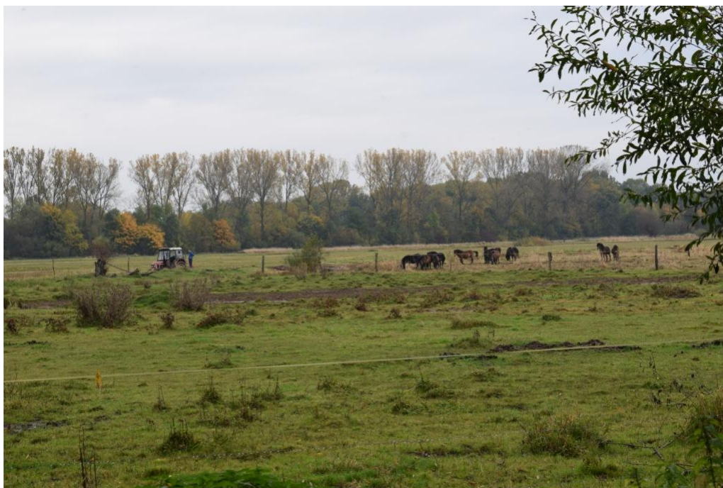
říjen 2022 – pastva a podzimní seč