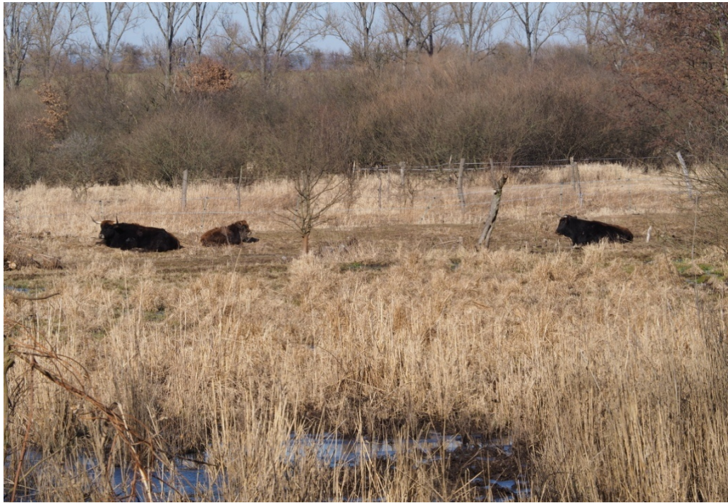
březen 2022 – pratuři

- autorkou všech fotografií v příloze je i autorka BP