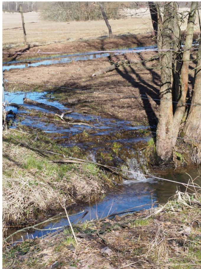
březen 2022 – strouha a zavlažovací kanál