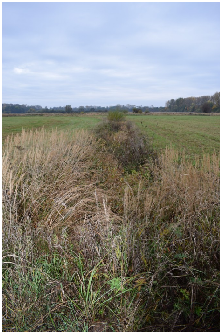
říjen 2022 – zavlažovací kanál