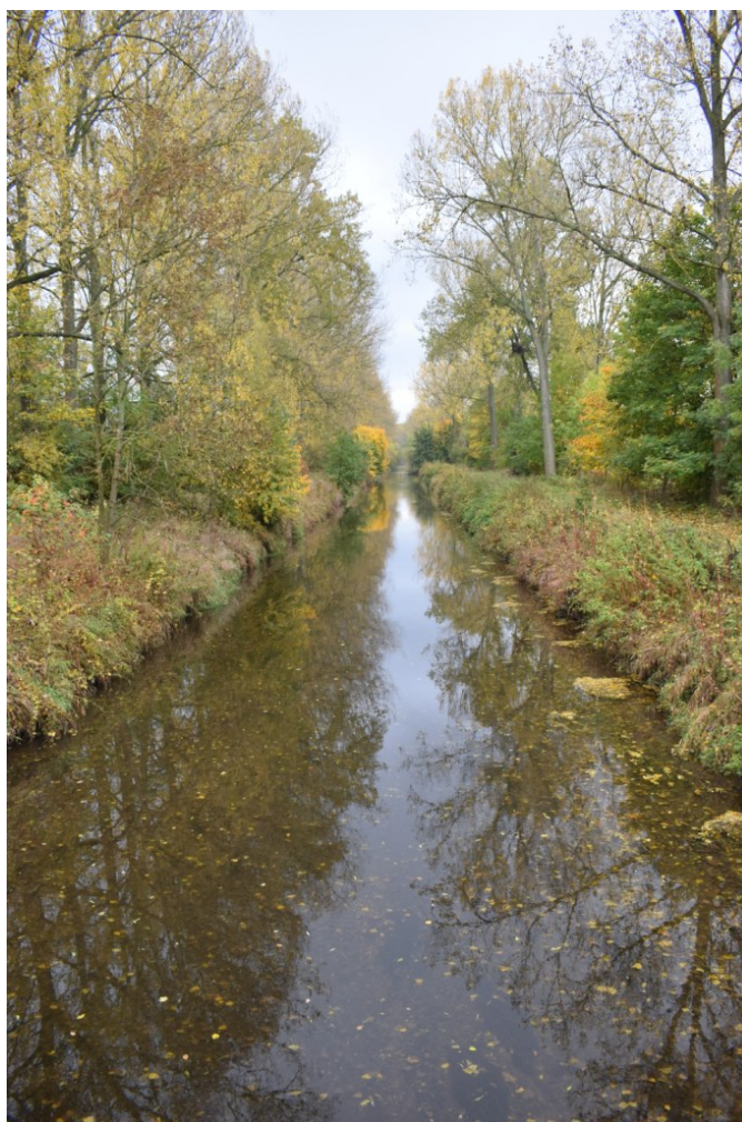
říjen 2022 – koryto Nové Metuje