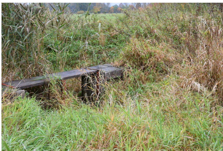
říjen 2022 – zavlažovací kanál s hradítkem