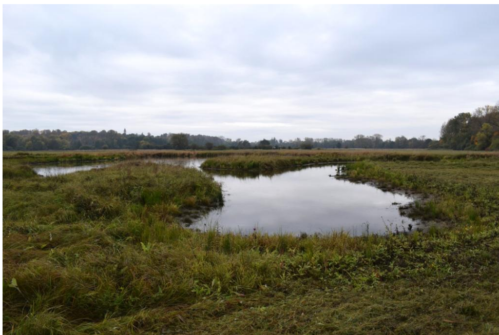
říjen 2022 – tůň centrálního ptačníku