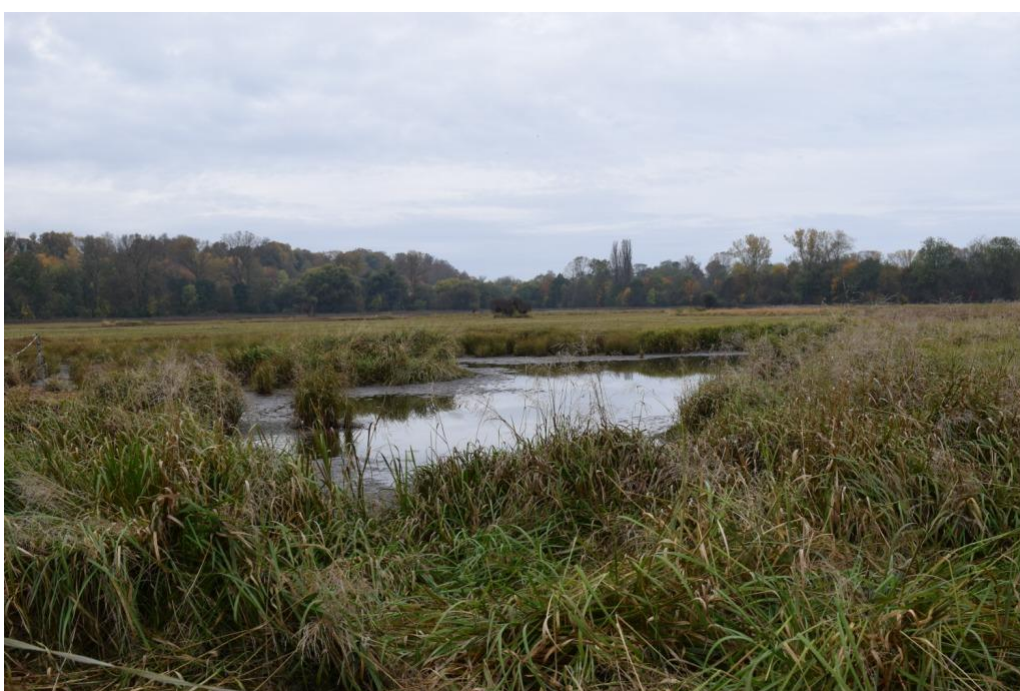
říjen 2022 – menší tůň a močál