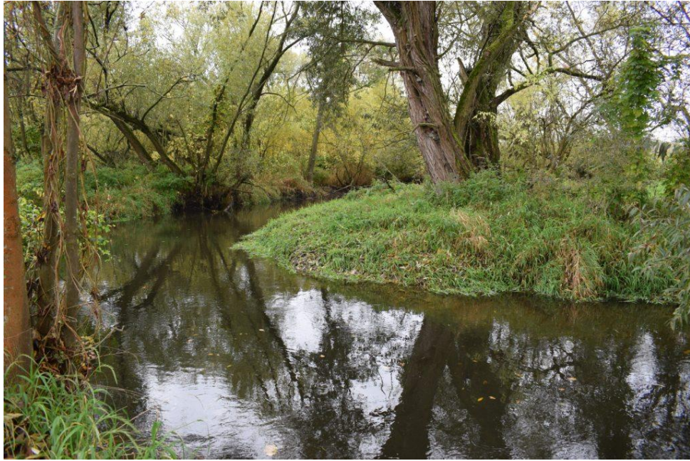
říjen 2022 – meandry Staré Metuje