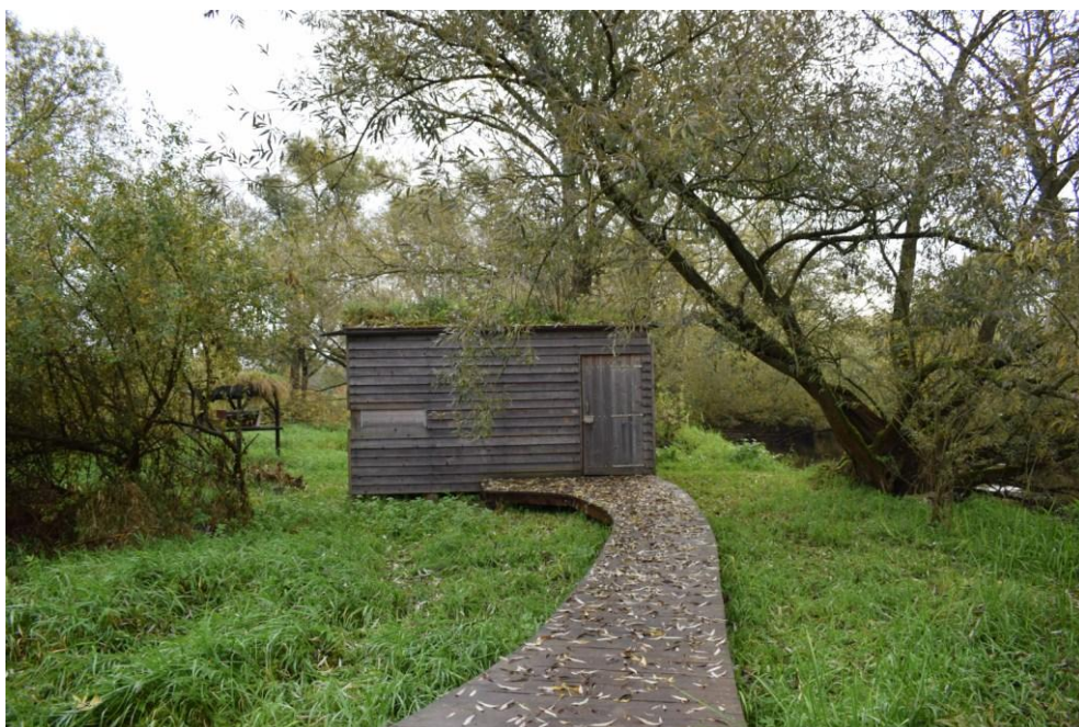
říjen 2022 – ptačí pozorovatelna při vstupu