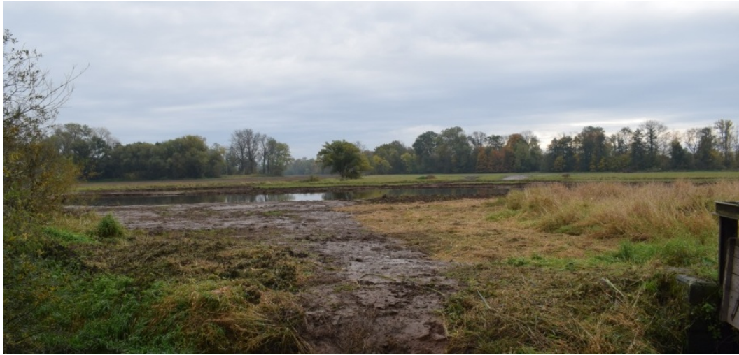
říjen 2022 – poslední okrajová tůň projektu Centrální ptačník