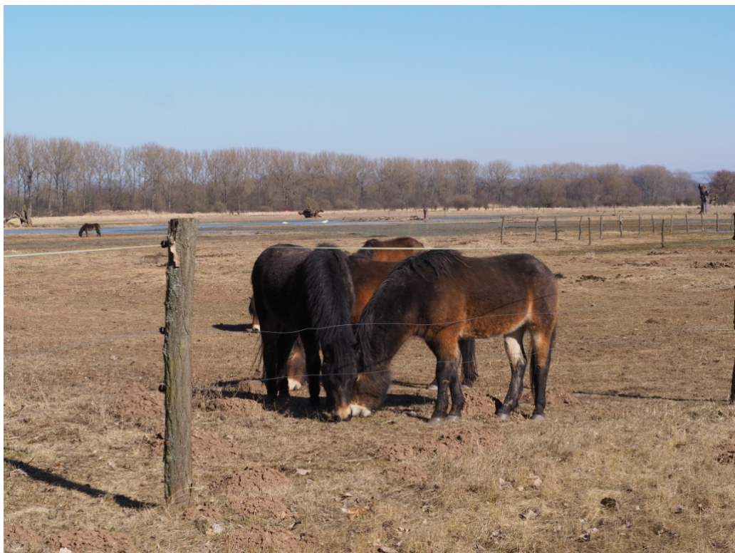
březen 2022 – exmoorští koně na pastvině, v pozadí tůňky a močály