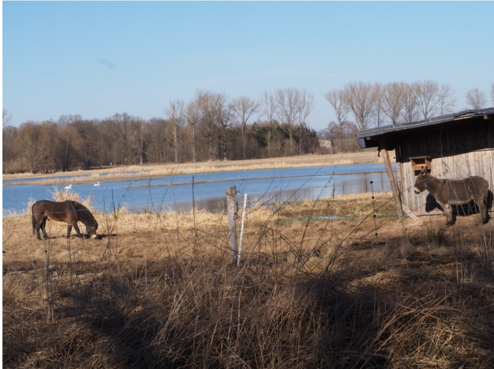
březen 2022 – exmoorský kůň a osel na pastvině, Slavíkovský ptačník