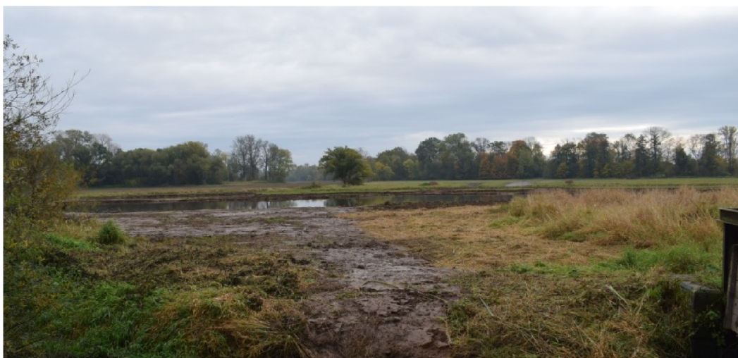
říjen 2022 – poslední okrajová tůň projektu Centrální ptačník