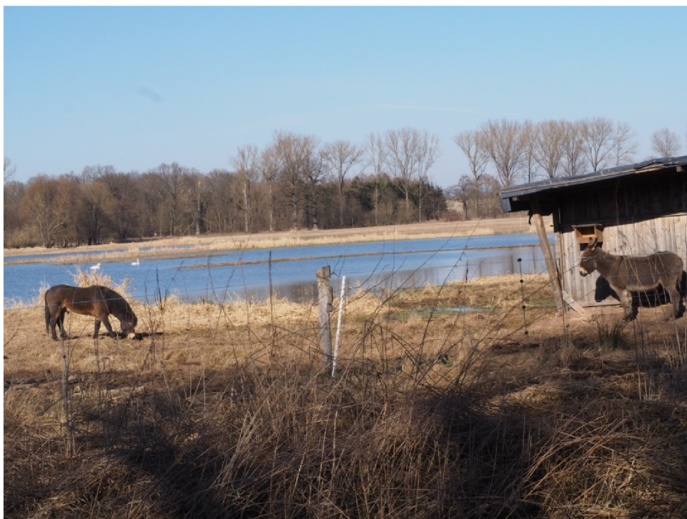
březen 2022 – exmoorský kůň a osel na pastvině, Slavíkovský ptačník