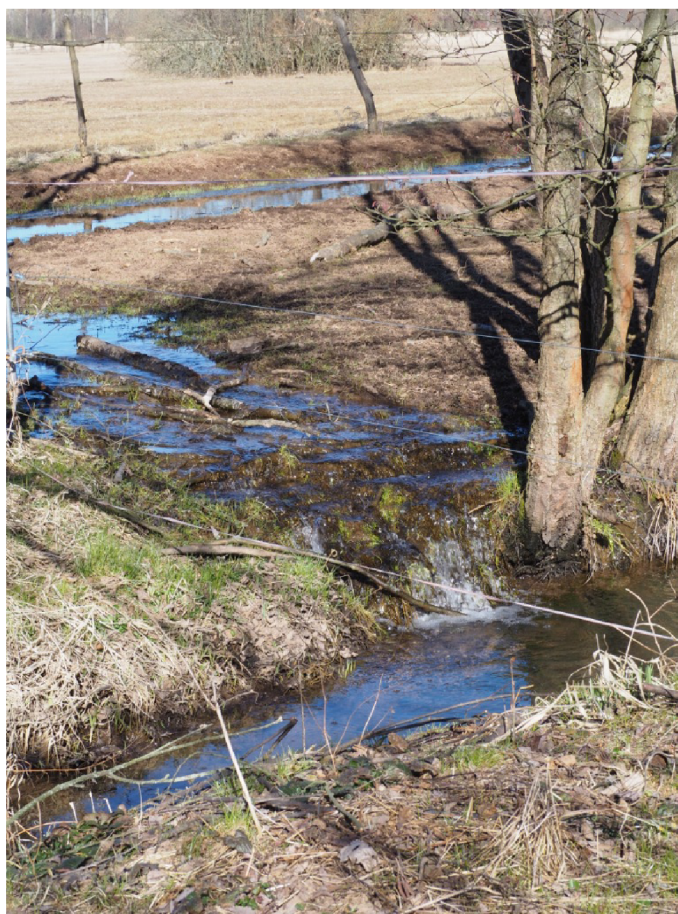
březen 2022 – strouha a zavlažovací kanál