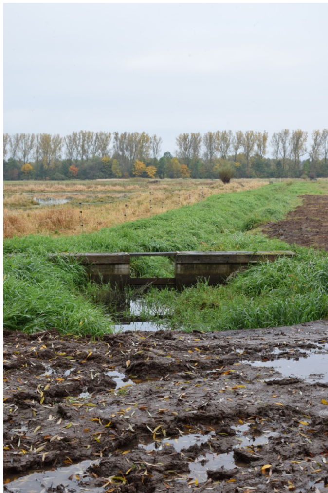
říjen 2022 – závlahový systém s hradítkem, v pozadí vlevo tůňe centrálního ptačníku