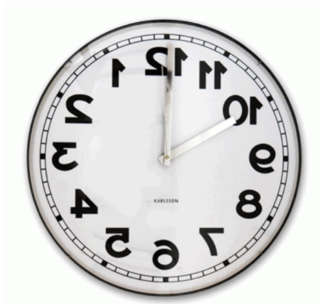
Obrázek 2: Nástěnné hodiny – opačně jdoucí