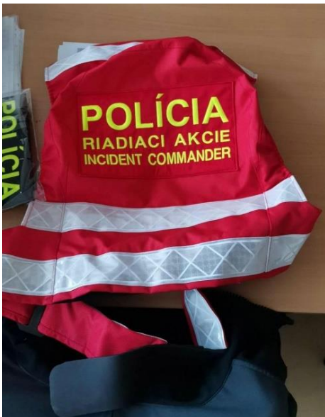
Velitelská vesta VP PMJ Nitra