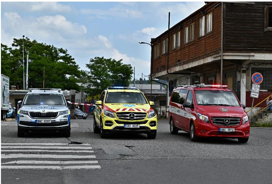
Velitelská vozidla Velitele policie, Inspektora, Velitele hasičů