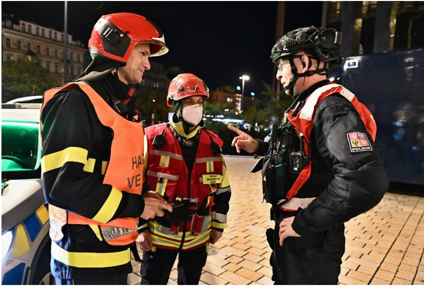
Součinnostní cvičení složek IZS – Muzeum