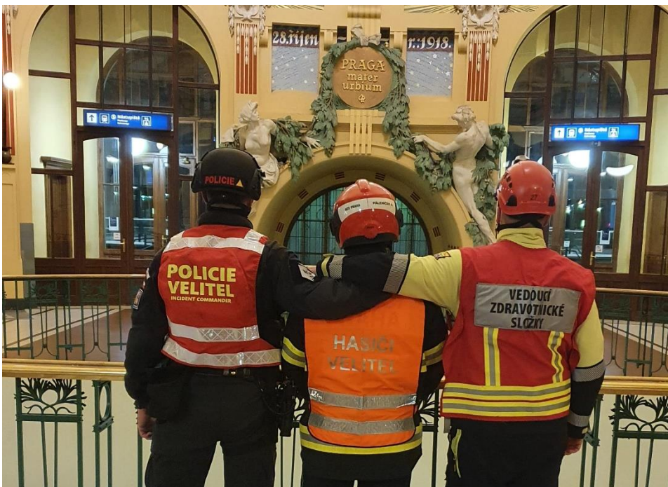
Velitelé složek VP, HZS, ZZS