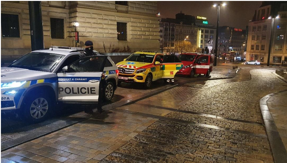
Velitelská vozidla VP, Inspektora, HZS