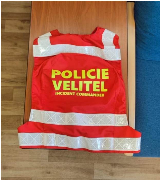
Velitelská vesta VP PMJ Praha