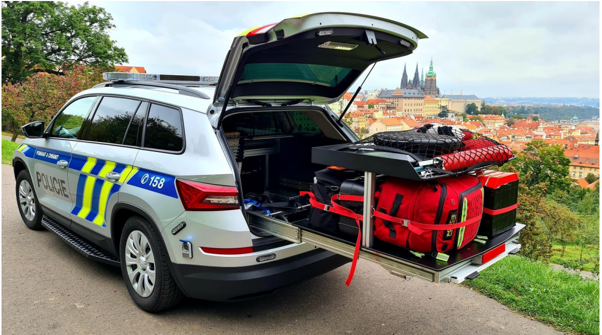
Obr. č. 1: Služební vozidlo VP 7

výsuvným systémem, kde se lze i díky přehlednosti v systému k veškerému vybavení okamžitě dostat.