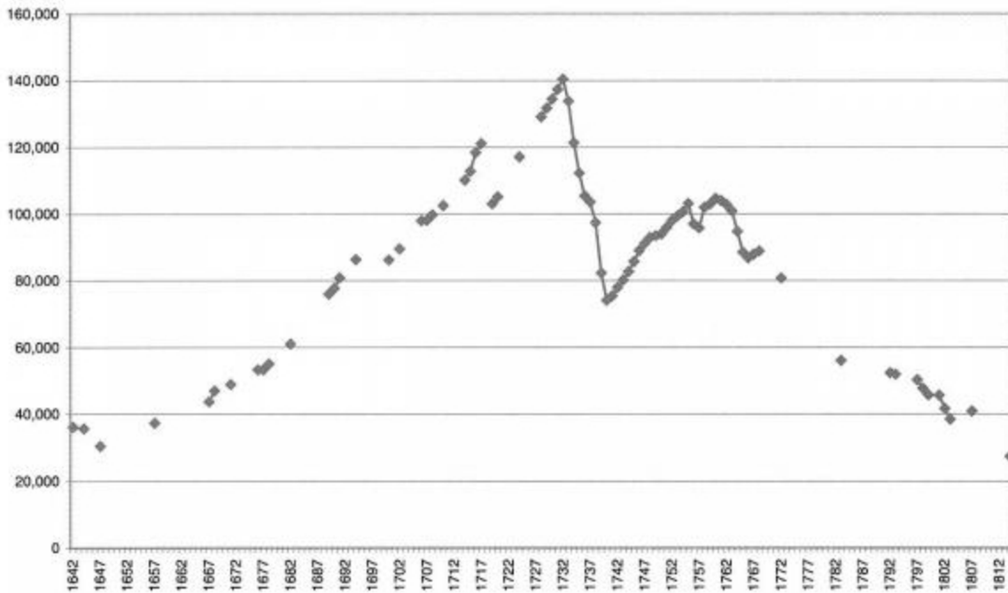
Fig. 3 Population of the Missions, 1642–1815

Převzato. Dostupné z WWW: < http://www.jstor.org/stable/3656812 >.