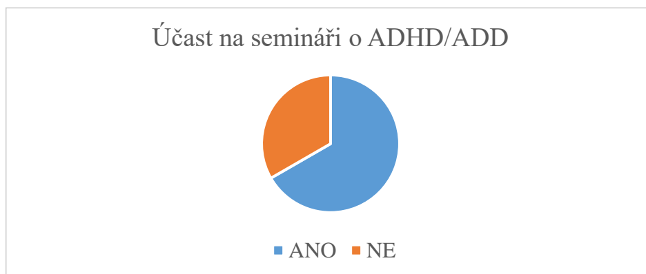
Graf č. 3

Poslední otázka se zabývala účastí na semináři či kurzu o ADD/ADHD. Zde 4 respondenti ze 6 uvádí že se vzdělávacího kurzu o ADHD či ADD někdy zúčastnili, pokud se o ADD přednášející zmínil bylo to pouze okrajově. Zbylé 2 respondenti udávají že se nikdy žádného kurzu nezúčastnili.