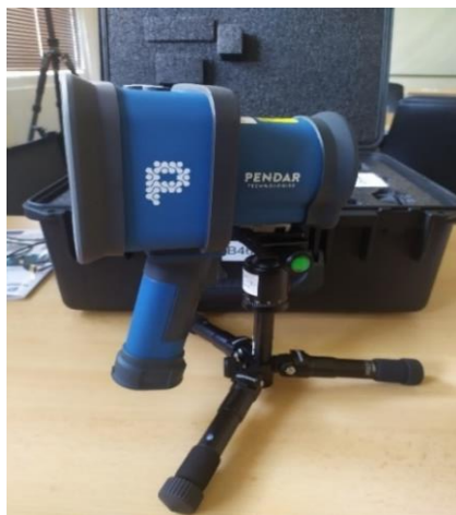
Obrázek 6: Ramannův spektrometr Pendar X10.

Možnost postupných softwarových aktualizací knihovny spekter v oblasti NL, výbušnin, drog a BCHL poskytuje tomuto přístroji velkou flexibilitu. Pendar X10 umožňuje měření NL až ze vzdálenosti dvou metrů, možnost měřit i přes několik vnějších obalů, eliminuje riziko inicializace termicky nestabilních vzorků či materiálů a používá novou generaci technologie k přesnějšímu měření komplikovaných směsí NL. 58