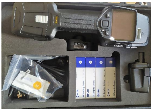
Obrázek 9: Přenosný detektor stopového množství výbušnin FLIR Fido X4.

Pyrotechnická služba, například pro detekci výbušnin s podezřením na rozptýlení CBRNE materiálu, používá analyzační prostředky za využití Ramanovy spektrometrie a hmotnostních spekter společně s detektory stopového množství výbušnin, viz obrázek 9. K osobní ochraně pyrotechnika jsou vybaveni plynotěsnými POO typu 1a v kombinaci s autonomním izolačním vzduchovým dýchacím přístrojem a odstupnými manipulačními zařízeními (roboty).