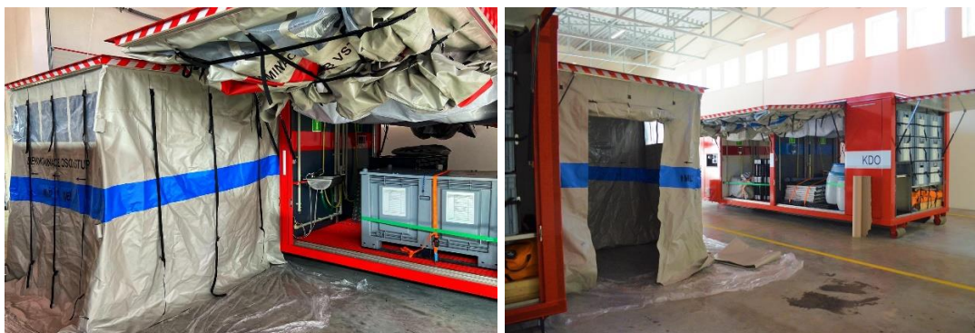
Obrázek 8: Dekontaminační kontejner se stanovištěm čtvrté generace SDO – 4.