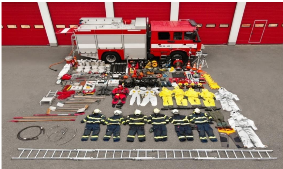
Obrázek 1: Ukázka obsáhlosti vybavení „prvovýjezdové“ CAS-20 Tatra-Terno.