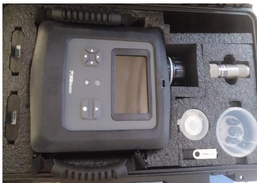
Obrázek 7: Mobilní HMS spektrometr MX908.

Vyznačuje se extrémní odolností proti vysokým teplotám a účinkům NL, snadným ovládním v POO s automatickou analýzou vzorků NL v plynné, kapalné nebo i pevné formě s přesnými výsledky do několika sekund a v měření ovzduší je výsledek dostupný každou sekundu. Nové aktualizace softwaru a knihovny do- dávají velmi komplexní databáze a vylepšují se identifikace nízkých koncentrací fentanylů v tabletách a aerosolu.