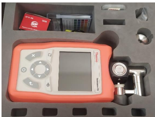
Obrázek 4: IČ spektrometr TrueDefender FTX.

Infračervený spektrometr TrueDefender FTX – k měření využívá technologii infračervené spektrometrie k identifikaci vysoce nebezpečných chemických kapalných a pevných látek, BCHL a drog. Knihovna činí až 10 000 spekter, které je přístroj schopný obsluhu identifikovat do několika sekund. Jedná se o starší generaci IČ (infračervených) spektrometrů, avšak stále je ve výbavě JPO HZS krajů.