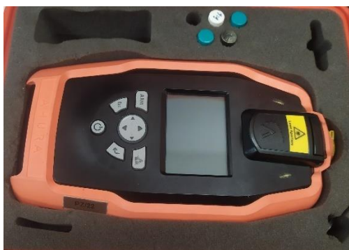
Obrázek 3: Ramannův spektrometr First Defender XL.

Ramannův spektrometr First Defender XL – tento analyzační přístroj je zástupce, dnes už starší generace spektrometrů, určený k analýze a identifikaci kapalných a pevných látek na základě Ramanovy spektrometrie. Jedná se o velmi spolehlivý přístroj, který se pyšní vnitřní knihovnou 11 316 spekter potenciálně NL a BCHL. Tento přístroj je schopný tyto látky identifikovat do několika sekund. Využíván je především základními a opěrnými body JPO HZS krajů nebo chemickými laboratořemi HZS ČR.