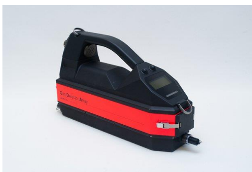
Obrázek 5: Analyzátor plynů a par GDA 2.

Analyzátor nebezpečných a bojových otravných plynů a par GDA 2 – je využíván k identifikaci a stanovení NCHL a BCHL v ovzduší. GDA 2 využívá čtyř detekčních principů pomocí detekčních čidel, kdy software přístroje vyhodnotí poměr signálu v jednotlivých detektorech a porovná je s daty ve vnitřní knihovně. Na základě daného signálu vyhodnotí koncentraci v ovzduší. Dokáže detekovat a stanovit čtyřicet tři NCHL a BCHL v koncentracích ppm.