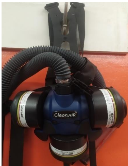
Obrázek 10: Filtrační jednotka CleanAir Chemical 3F od MalinaSafety

dýchací techniku, jako například autonomní izolační vzduchové dýchací přístroje se systémem dvou tlakových lahví pro větší zásobu vzduchu, kyslíkovými dýchacími přístroji či chemickými filtračně-ventilačními jednotkami.