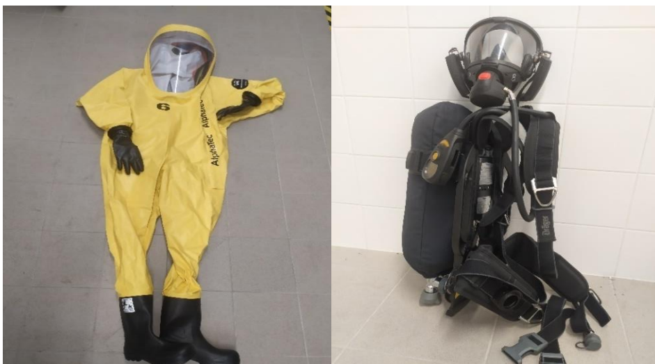
Obrázek 2: Ochranný protichemický oděv plynotěsný 1a AlphaTec VPS CV/VP1 a autonomní izolační přetlakový vzduchový dýchací přístroj Dräger PSS 7000 s ochranou přetlakovou obličejovou maskou Dräger FPS 7000.