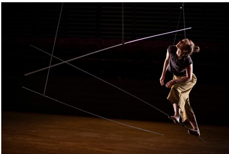
Zkouška v KD Mlejn