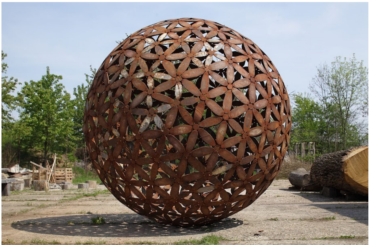
Čestmír Suška, Rezavé Kvety 2007