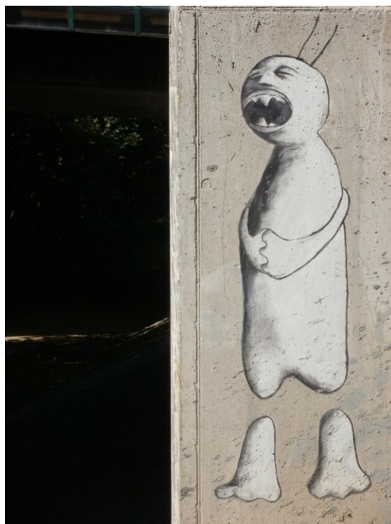
Timo, Křik na betonu