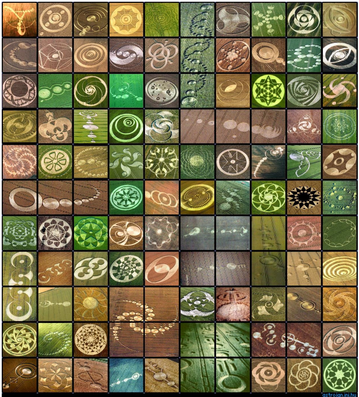
Neznámý tvůrce - Kruhy v obilí nebo také agrosymbyoly