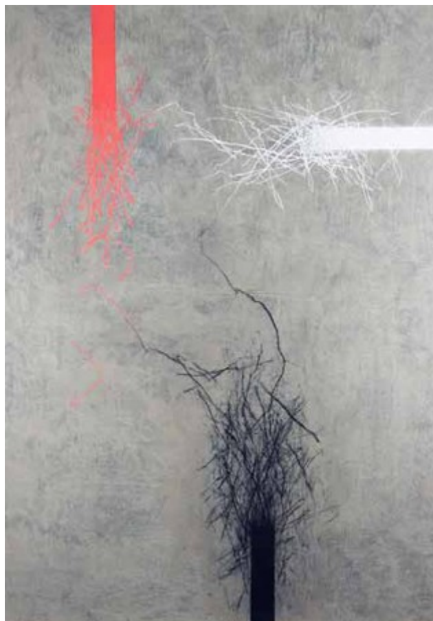
Milivoj Husák, kresba, 2010