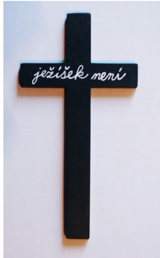
Timo, Ježíšek není