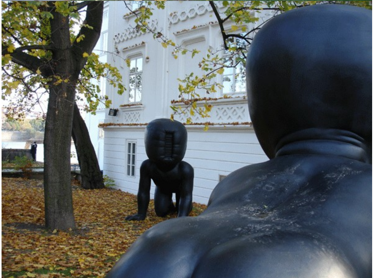
David Černý, Mimi, Kampa, 2006