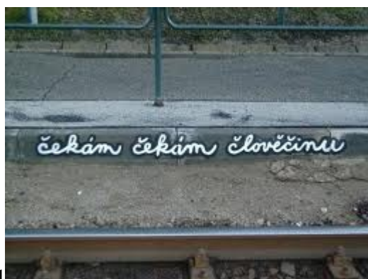
Timo, Čekám... 1