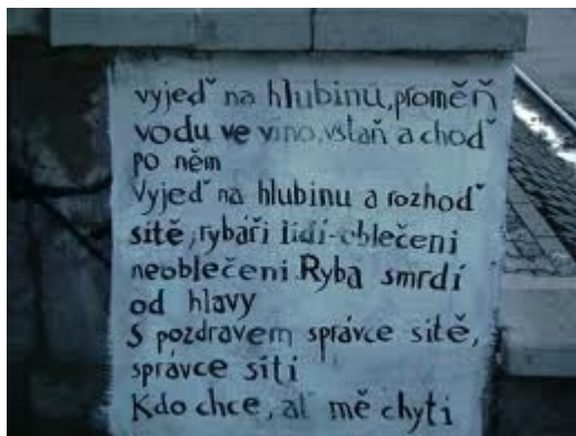
Timo, Vyjed' na hlubinu..