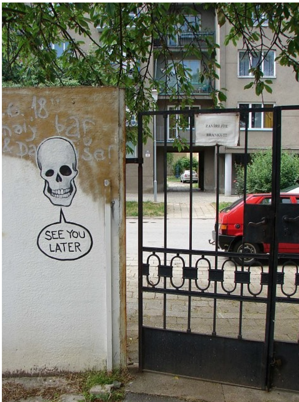
Timo, See You Later