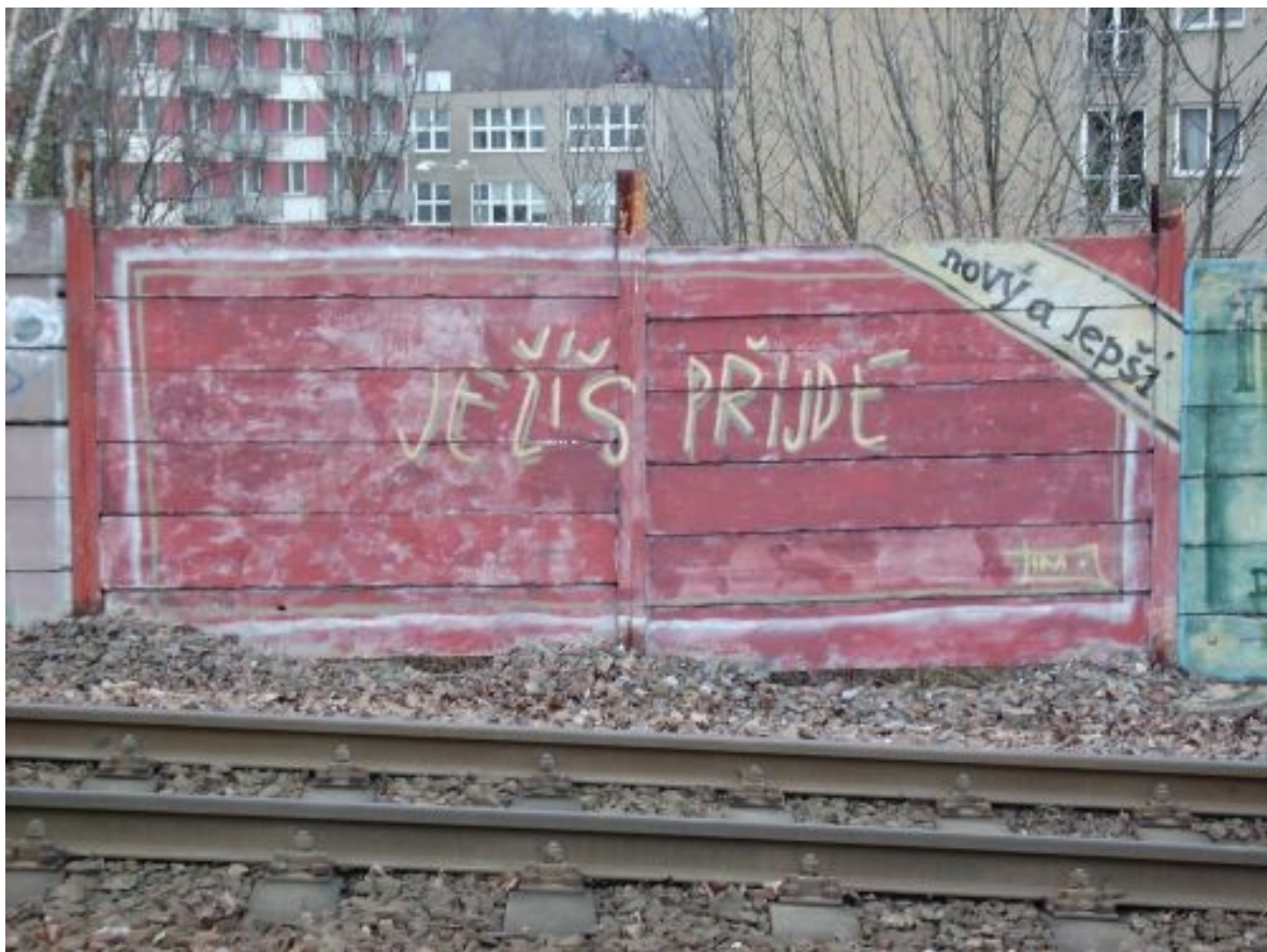
Timo, Ježíš přijde...