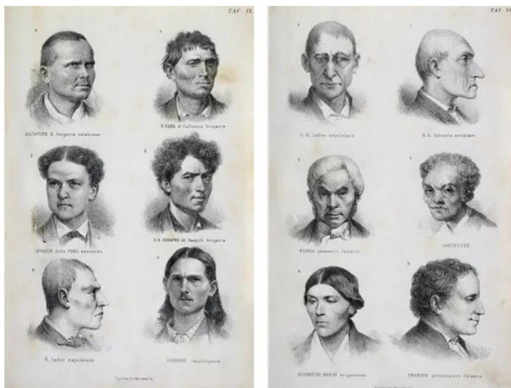
Obrázek 1: Příklady fyziognomie zločinců ilustrované z L'uomo Delinquente (zločinec), 1876, Cesare Lombroso.

Jeden z prvních badatelů v kriminologii, Cesare Lombroso, ve svém hlavním díle „ L'Uomo Delinquente “ představil myšlenku, že zločinci by měli být považováni za regres ve vývoji, jako by se vracely na primitivní úroveň vývoje. Lombroso vycházel ze studií frenologie, tedy podle toho, jaký tvar lebky zločinec měl, takového se měl dopustit zločinu. Rozlišoval „rozené zločince, občasné zločince, zločince z vášně, morální imbecily a kriminální epileptiky“. (Lombroso, 2017, s. 187).