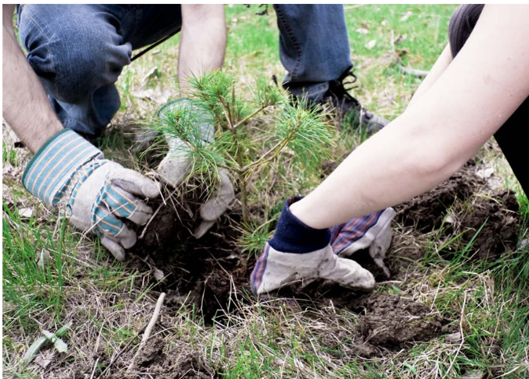
Realizácia sadenia stromov, happening, 2017