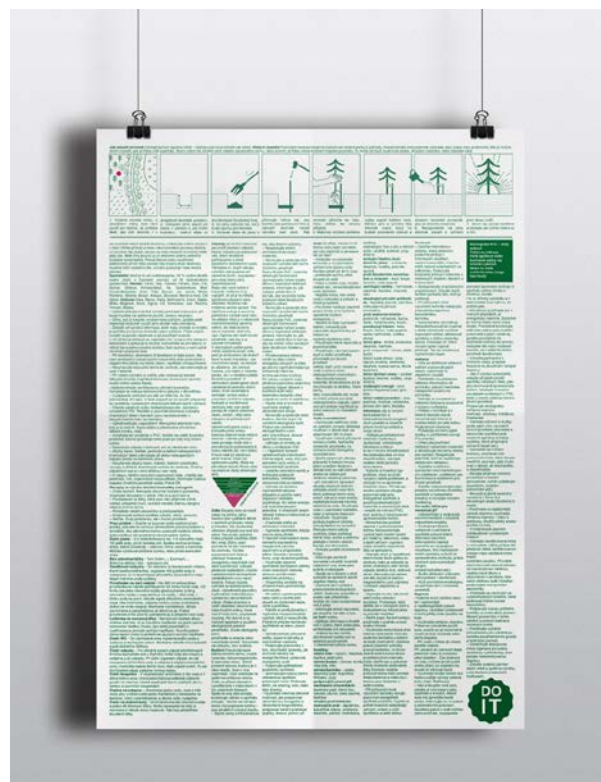
Propagačný plagát zadná strana, risograf, recyklovaný papír, 297x420 mm, 2017