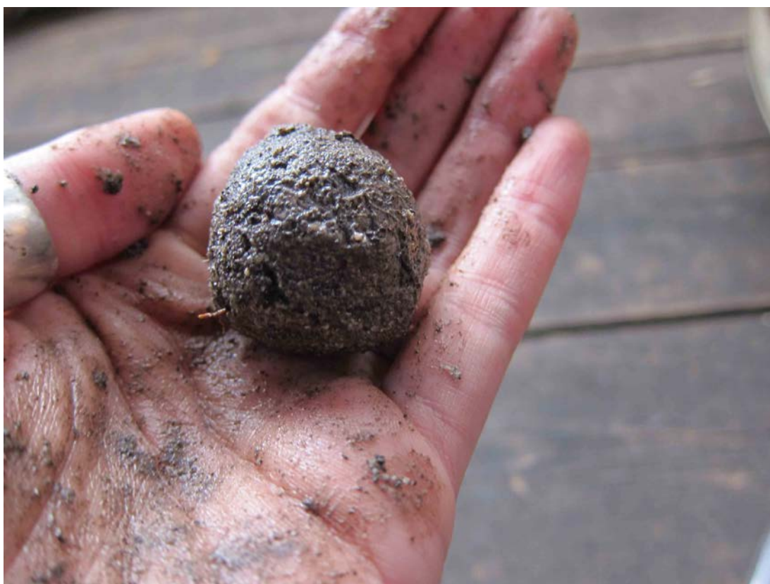
Guerilla kampaň – semienková bomba, hlina, papier, semienka lokálnych rastlín, 2017