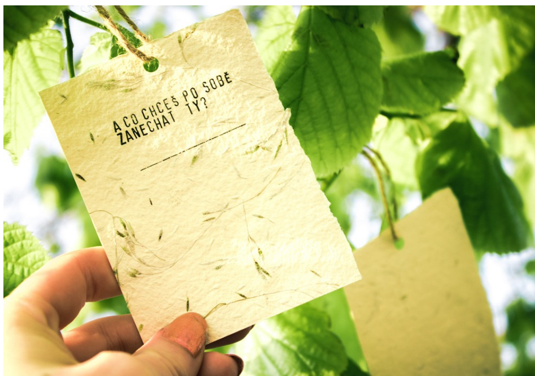
Guerilla kampaň “Strom nádeje” – razítko, ručný papier, semená lokálnych rastlín, 2017