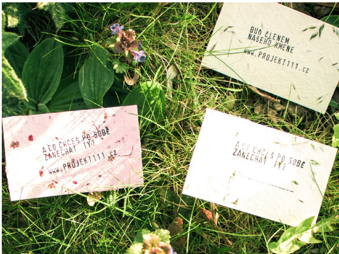
Vizitky, ruční papier so zalisovanými rastlinami a semienkami, razítko, 2017