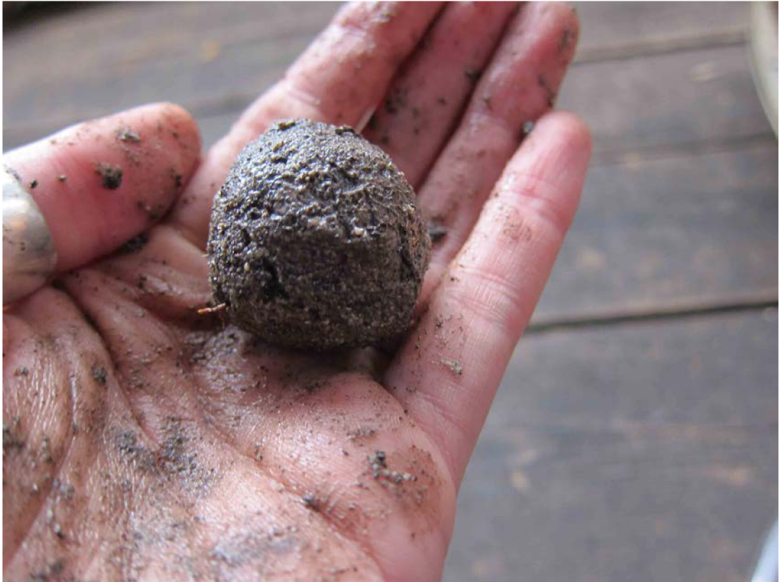
Guerilla kampaň – semienková bomba, hlina, papier, semienka lokálnych rastlín, 2017