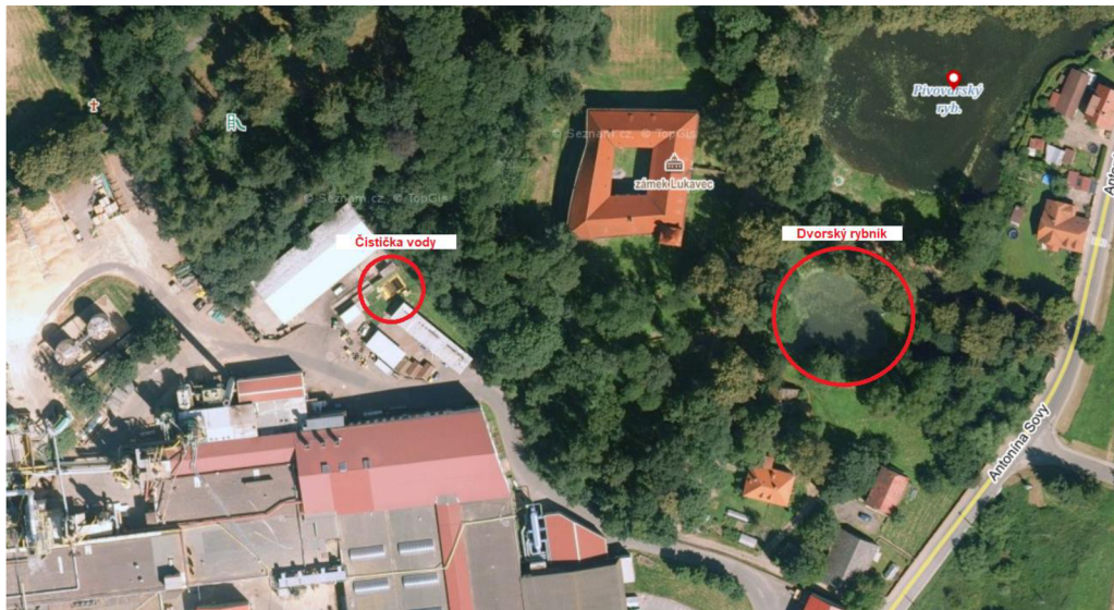
Obrázek 4 Umístění čističky vody a rybníku Dvorský

pracovníků družstva určených k likvidaci následků havárie. V případě havárie velkého rozsahu a možnosti rozšíření znečištění dále mimo podnik je vyžádána pomoc Hasičského záchranného sboru města Pacov. 60