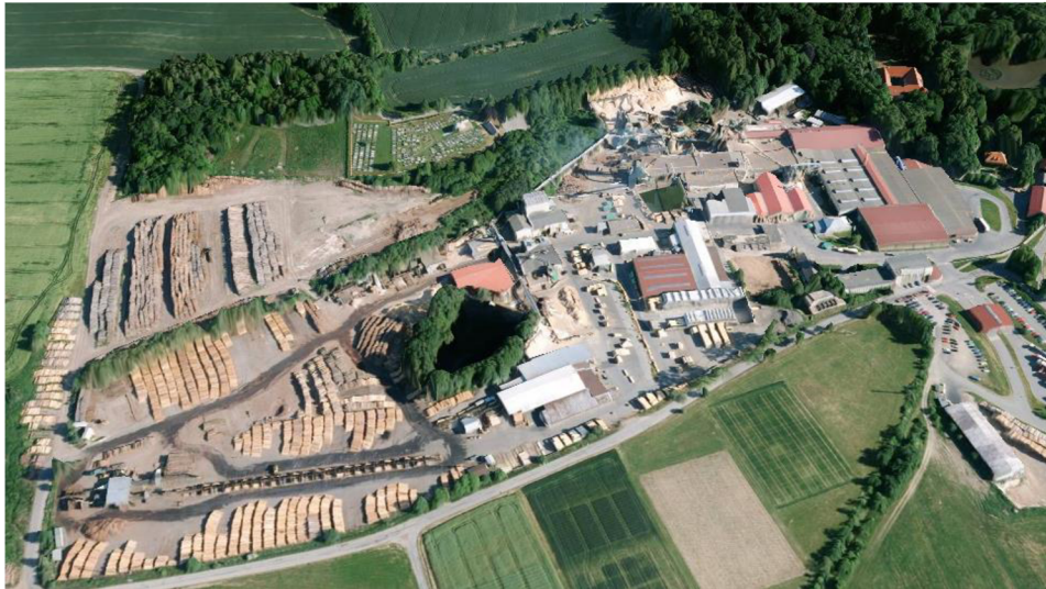
Obrázek 1 Letecký pohled na Dřevozpracující družstvo Lukavec