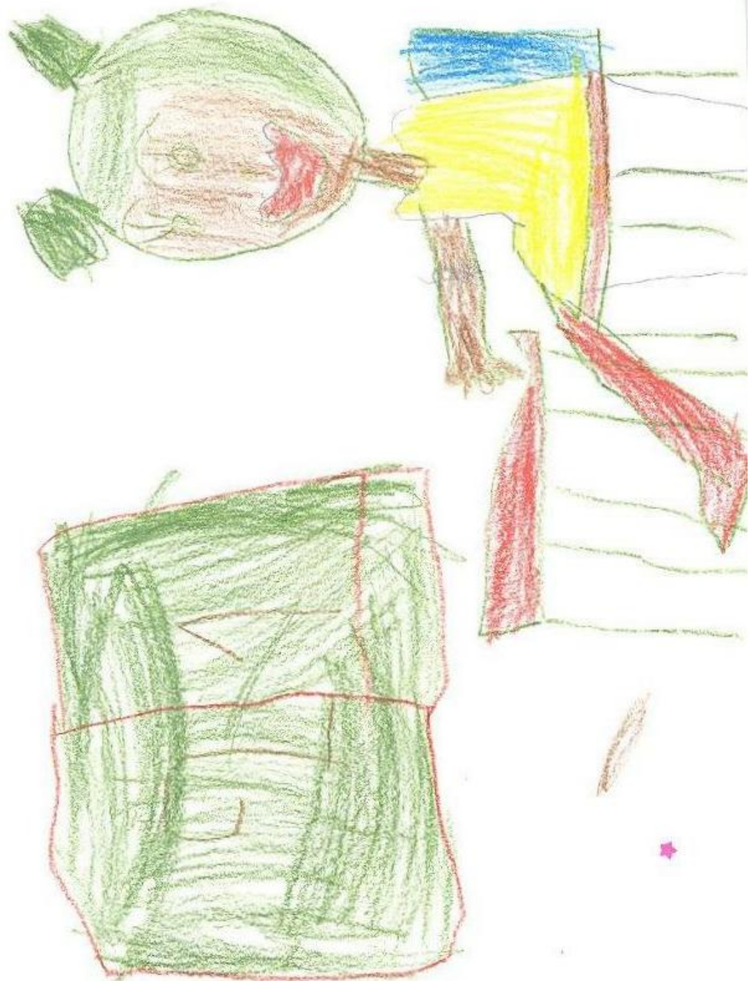
Kresba respondenta č.6: Dívka sedí v lavici v hodině matematiky.