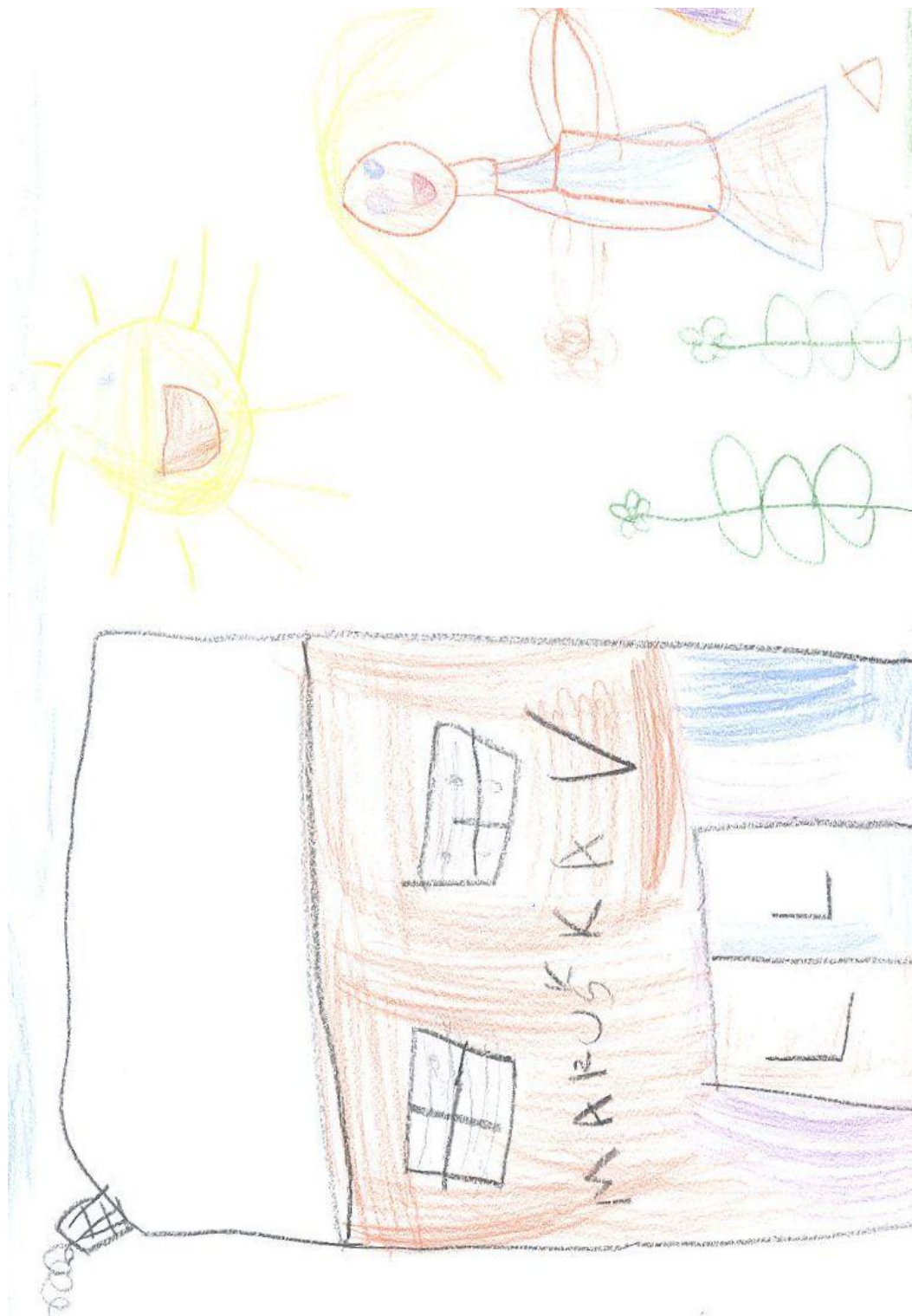
Kresba respondenta č.5: Dívka jde do školy, vlevo je budova školy.