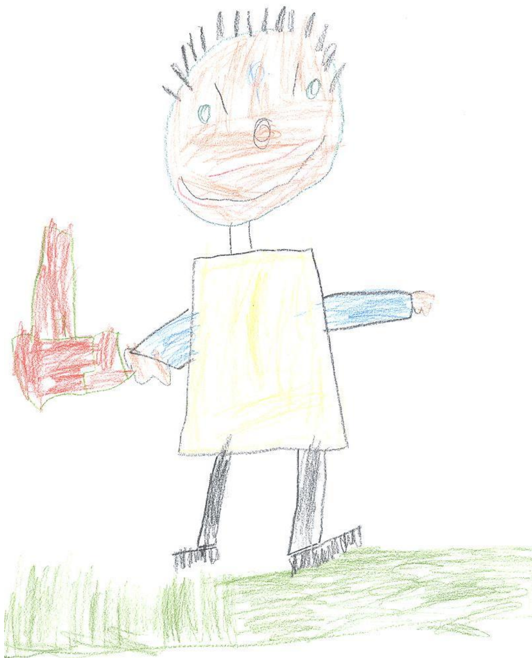
Kresba respondenta č. 3: Chlapec se školní taškou.