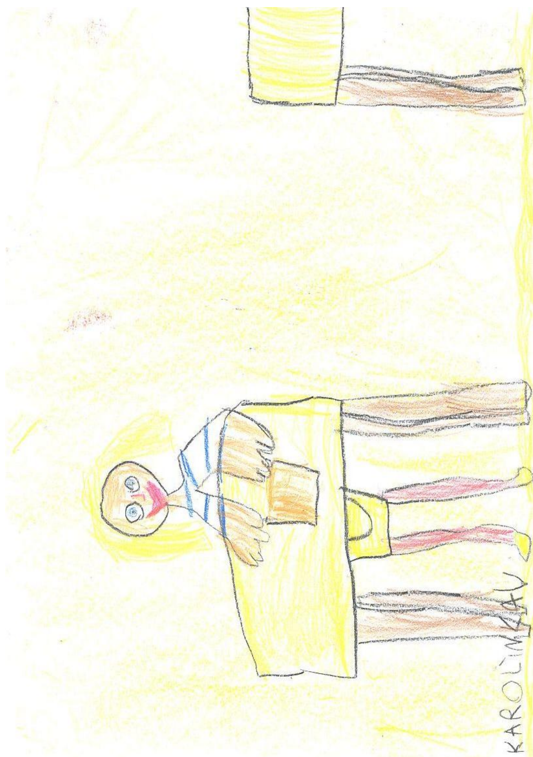
Kresba respondenta č.4: Dívka sedící v lavici.