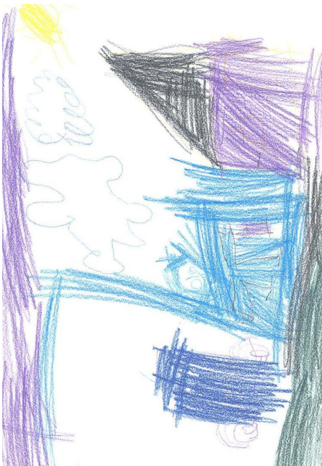
Kresba respondenta č.2: Chlapec při cestě do školy.