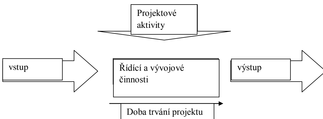
Obr. 1 - Proces projektu 14