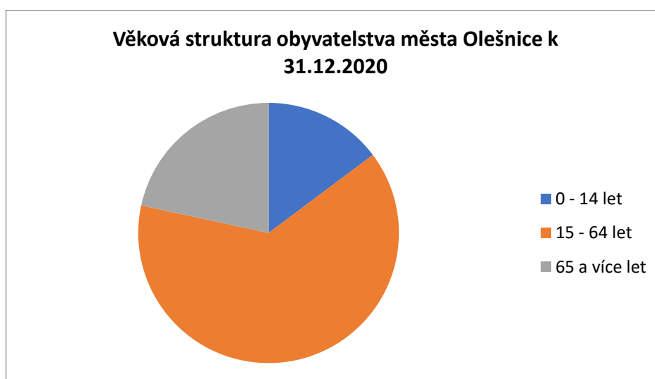
Obr. 4 Věková struktura obyvatelstva města Olešnice k 31.12.2020

Z dat Českého statistického úřadu vyplývá evidentní nárůst počtu obyvatel ve věku 65+ z 268 ke konci roku 2010, na 360 obyvatel ve věku 65+ k 31. prosinci 2020, což je navýšení z 15,5% na 21,6% ze všech obyvatel Olešnice. Jedná se tedy o nárůst 1,2% a to je více než je celorepublikový průměr (Město Olešnice, 2021).