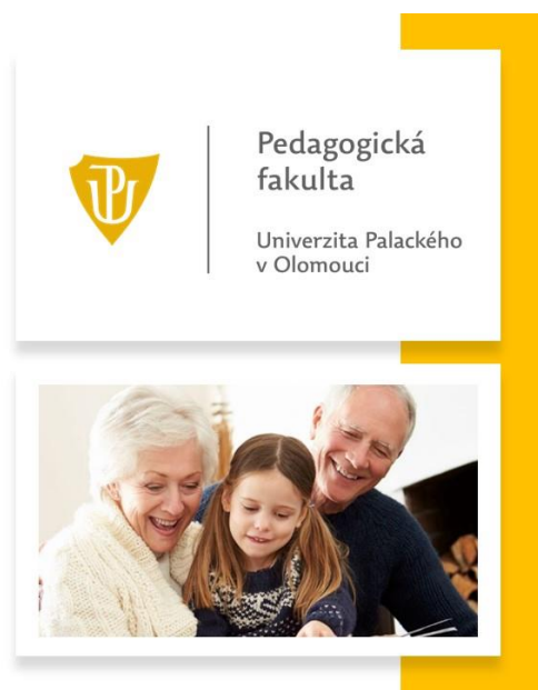
Obr. 1 Výzva občanům starším 65 let