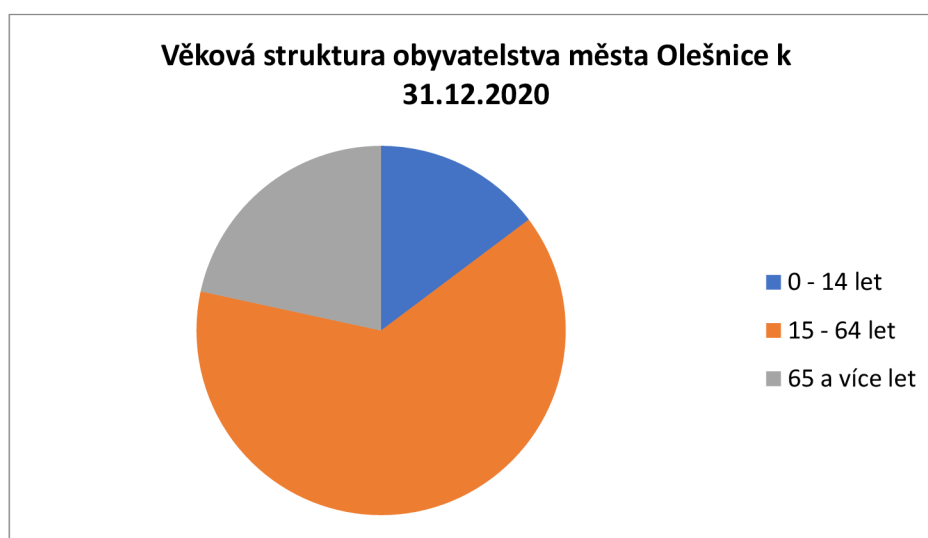
Obr. 4 Věková struktura obyvatelstva města Olešnice k 31.12.2020

Z dat Českého statistického úřadu vyplývá evidentní nárůst počtu obyvatel ve věku 65+ z 268 ke konci roku 2010, na 360 obyvatel ve věku 65+ k 31. prosinci 2020, což je navýšení z 15,5% na 21,6% ze všech obyvatel Olešnice. Jedná se tedy o nárůst 1,2% a to je více než je celorepublikový průměr (Město Olešnice, 2021).