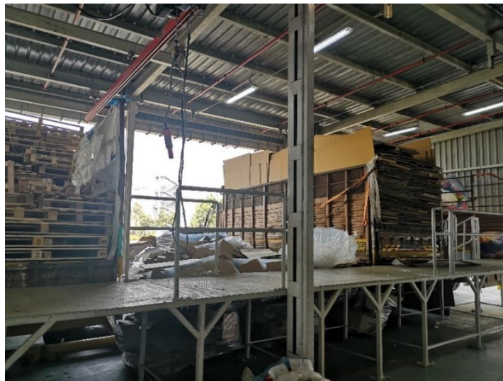
Obr. 3 Nakládací stanoviště u montážní haly

Na venkovním stanovišti je pak obalový materiál manuálně nakládán na nákladní vozy. Primárním cílem je naložit na vůz co největší množství odpadu. Nakladači jsou schopní zajít do extrémů, které by v Evropě nebyly tolerovány. V Indii jsou nicméně silnice široké, semaforů je málo, zpravidla stávají až za křižovatkou nebo na sloupu vedle silnice, a nadzemní elektrické vedení bývá dostatečně vysoko, takže není problém naložit vozy tak, jak je patrné na obrázku 4. Tyto vozy jsou ve vlastnictví firem, které odpad vykupují a dále zpracovávají nebo přepravují (viz. Kapitola 1). Těchto firem je v okolí Pune několik a zpravidla mívají odlišné zaměření. Řidič s posádkou vozu se většinou aktivně podílí na nakládání odpadu.