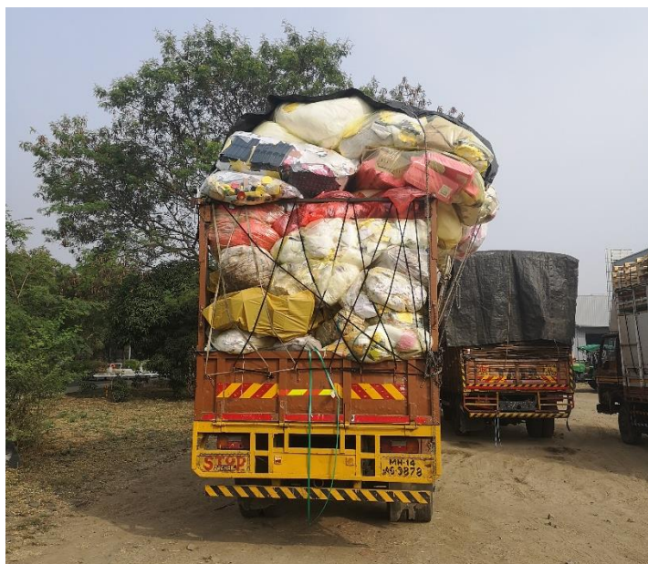
Obr. 4 Naložený nákladní vůz

Směsný odpad z košů z kanceláří je během dne sbírán agenturními zaměstnanci a je svážen zvlášť. To stejné platí pro odpad z kuchyně.