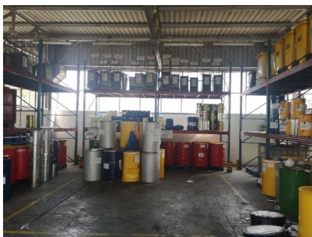
Obr. 6 Krytá buňka sběrného dvora

Sběrným dvorem prochází veškerý nebezpečný odpad, jež výrobní podnik vyprodukuje. Skladuje se zde, dokud ho není dostatečné množství pro naplnění nákladního vozu. Nebezpečný odpad je skladován zejména v desetitunových kontejnerech a plechových sudech. Tyto nádoby jsou uloženy v přístřešku, který je ze tří stran krytý, aby nedocházelo k případnému uvolňování nebezpečných látek do okolí a případně kanalizace při dešti. V přístřešku je několik buněk (viz Obr. 6). V každé z buněk jsou místa určená pro skladování určeného druhu nebezpečného odpadu. Na obrázku 7 je ukázáno takové místo, toto je určené pro skladování odpadních ředidel. Čas, kdy se nechává odpad vyvážet, závisí zcela na úsudku personálu sběrného dvora. Není nastaven žádný mechanismus, který by monitoroval množství uloženého odpadu ani dobu skladování. Z toho vyplývají dvě hlavní rizika, které budou rozvedeny v následující kapitole.