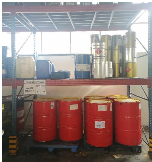
Obr. 7 Místo skladování odpadních ředidel