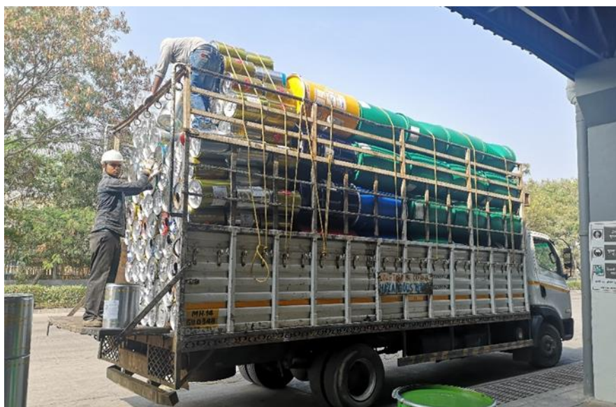
Obr. 8 Nákladní vůz odvážející sudy

Druhým rizikem je překročení maximální povolené doby uskladnění nebezpečného odpadu. Zákony státu Maharastra zakazují skladování nebezpečného odpadu po dobu delší než 90 dnů. Jelikož není nastavený mechanismus, jež by maximální dobu uložení kontroloval, není možné stoprocentně zaručit splnění tohoto nařízení, i když prakticky je to nepravděpodobné. Problém by mohl nastat při případném auditu státních kontrolních orgánů. Absence sledovacího systému by v krajním případě mohla znamenat neschopnost potvrzení splnění zákonných požadavků, což by mohlo vést k pokutám nebo jiným formám reparaace.