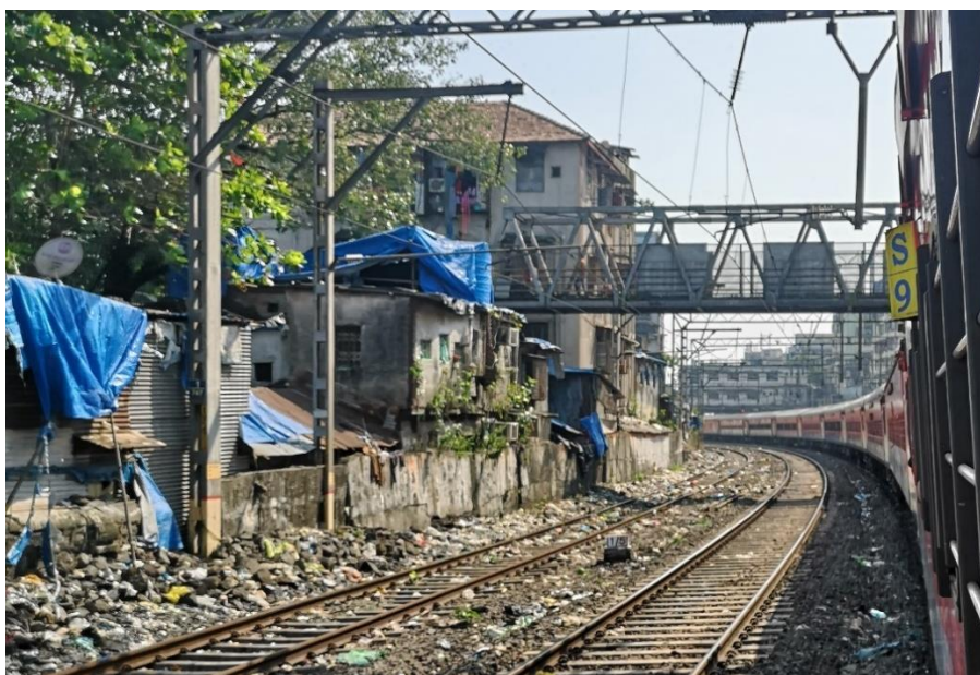
Obr. 1 Odpadky podél železniční trati v Mumbai

Na obrázku 2, který byl pořízen během pobytu v Indii, je znečištěné okolí řeky Mula-Mutha v Pune. Během období monzunových dešťů bývá tato část země zcela zaplavena a nahromaděný odpad se tak může šířit dál po proudu.