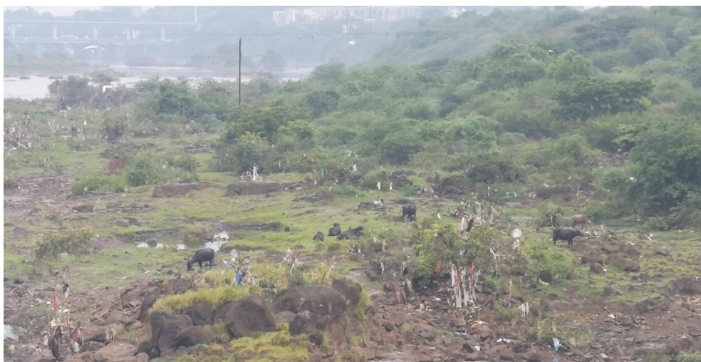
Obr. 2 Odpadky podél řeky Mula-Mutha v Pune

V případě, že se postupem času nahromadí příliš velké množství odpadků v blízkosti lidských obydlí, zapálí obyvatelé tyto malé černé skládky a množství odpadu zase na čas klesne. V případě chladného počasí si lidé rozdělávají malé táboráky, v jejichž blízkosti se ohřívají. Palivem jsou jim právě odpadky. Pro lidi, kteří takto dýchají plyny vzniklé při spalování odpadků, to může znamenat vážné zdravotní obtíže.