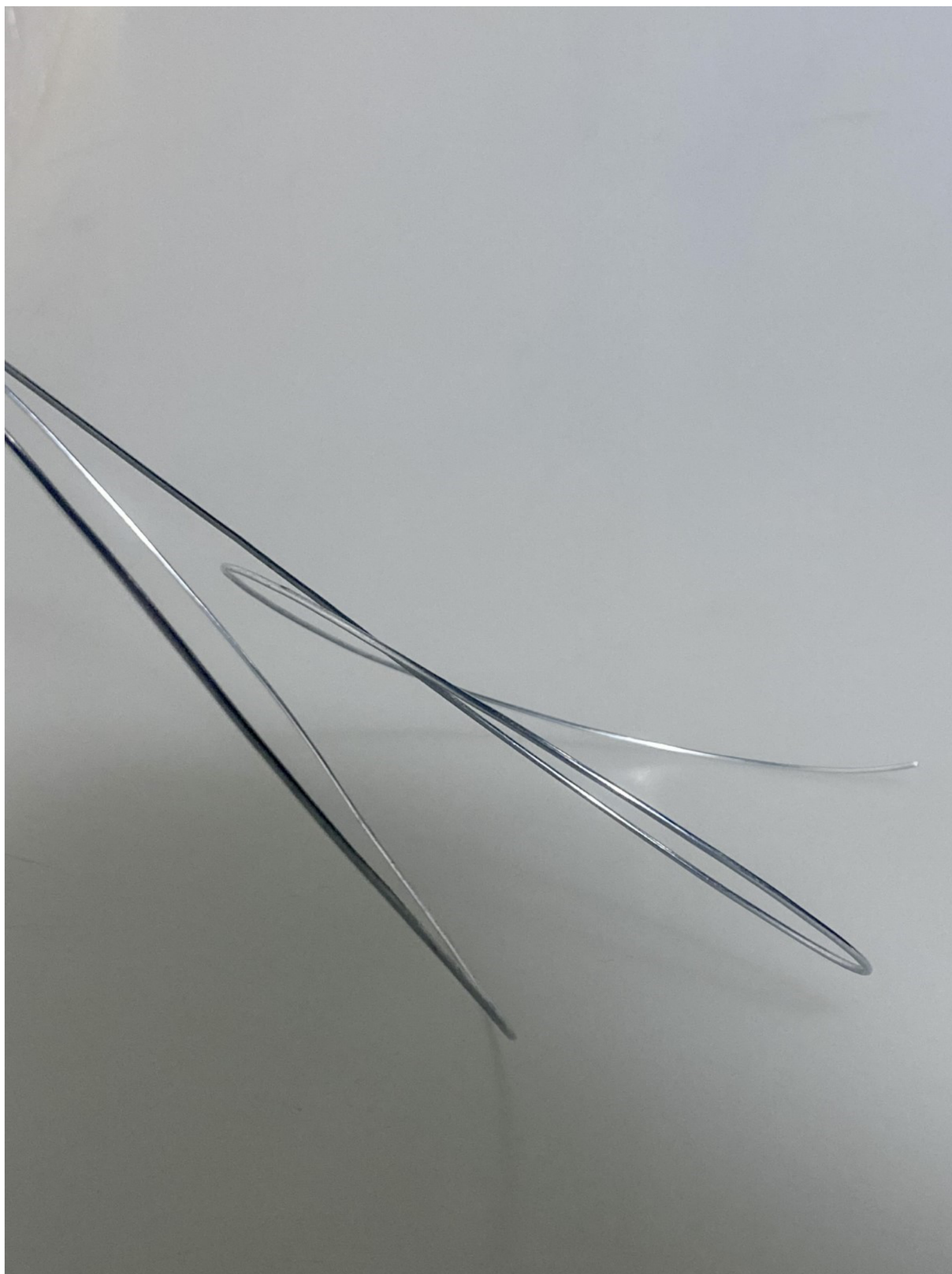
Model trubkového objektu v inštalácii “If you are too sensitive, apply SPF50+”, drôt, 2024