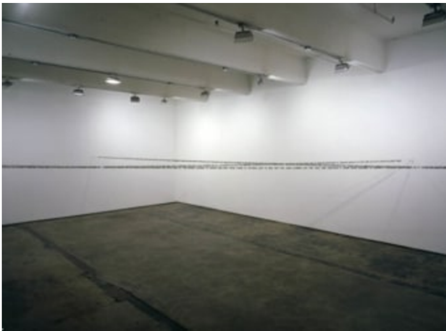
“True story”, NY, 2004