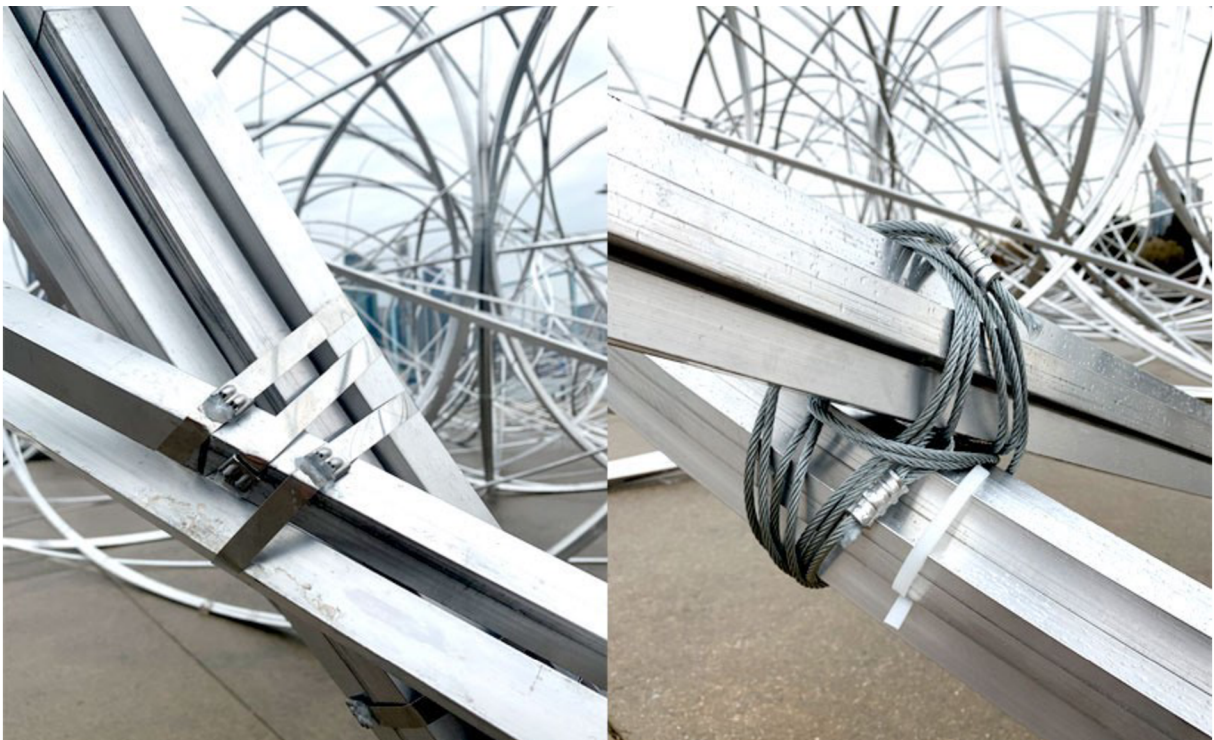
“New York Clearing”, NY, 2020